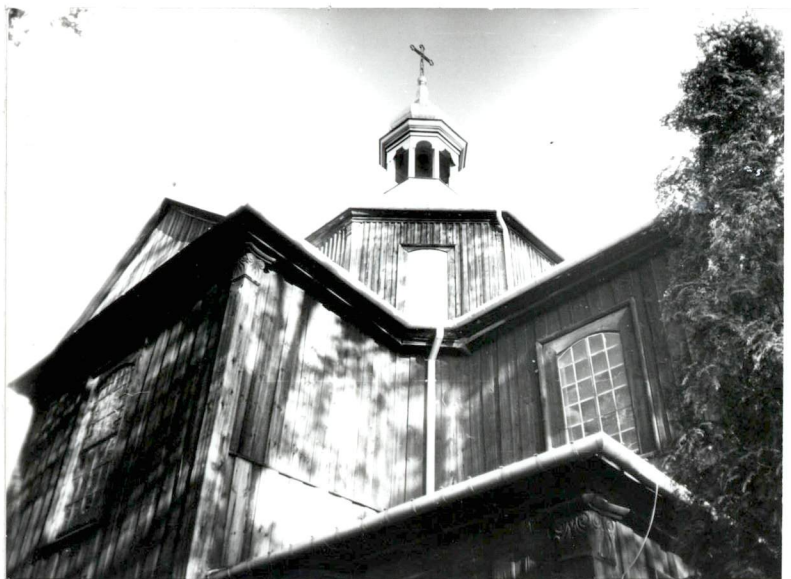
Widok na kościół /skrzyżowanie nawy z transeptem/.