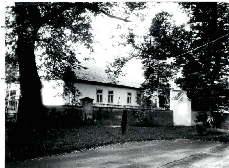
Widok z placu przykościelnego na starą plebanię.