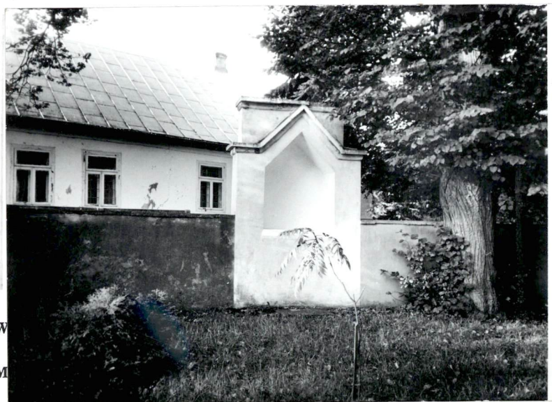
Widok na kapliczkę pd.-wsch.