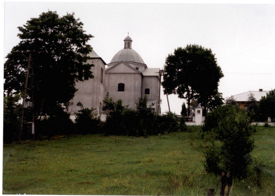
Widok na zespół od pd.