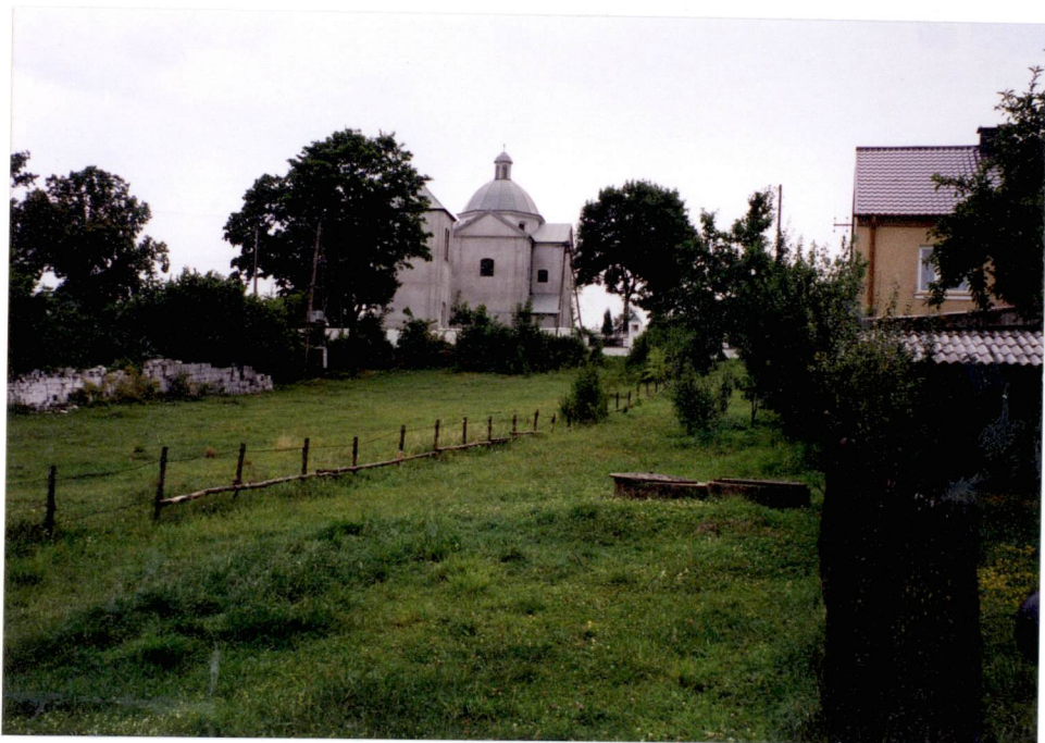
Widok na zespół od strony pd.