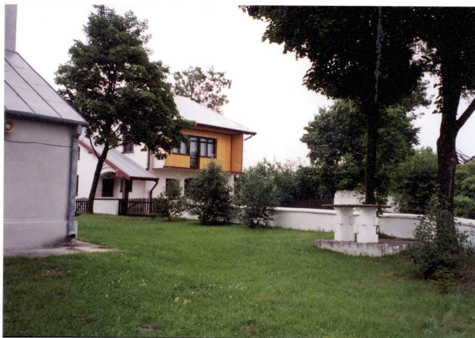
Widok na część południowo-wschodnią placu przykościelnego (w głębi plebania).