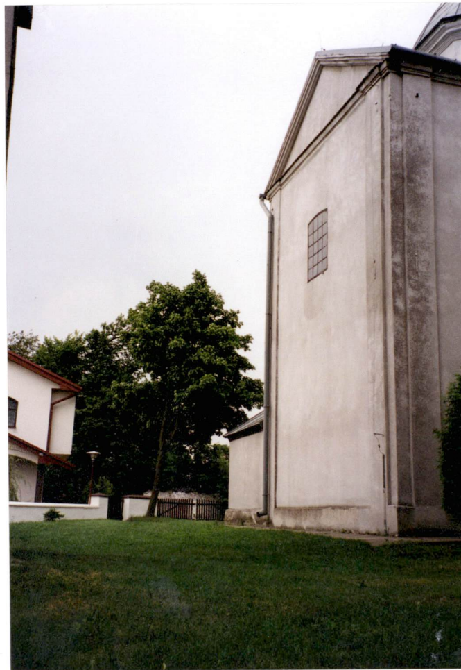
Widok od pn-zach. na szczytową ścianę transeptu - fragment ogrodzenia i pleba- nię.