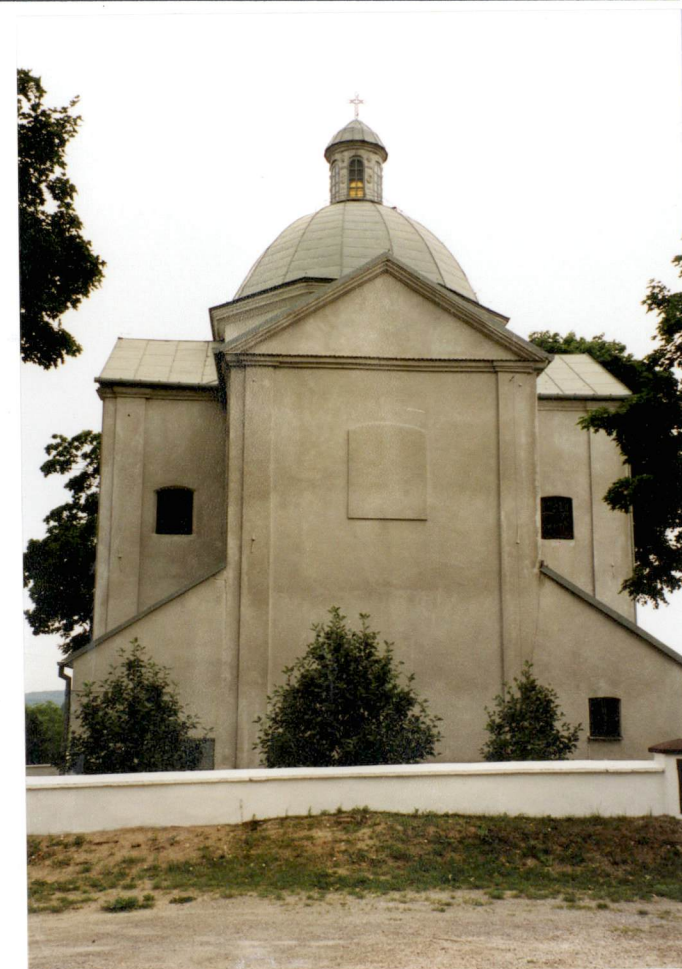
Widok od wsch. na elewację wsch. prezbiterium i ogrodzenie