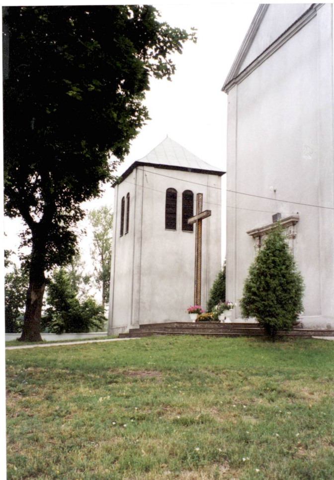
Widok od strony pd.- zach. na kościół i dzwonnice /obecnie kaplicę przedpogrzebową /.