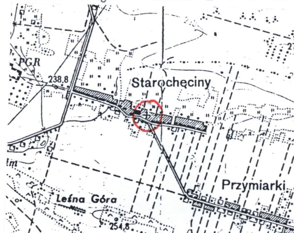
Orientacja - skala 1 : 25 000

4. Adres 26-060 Chęciny Starochęciny nr 43