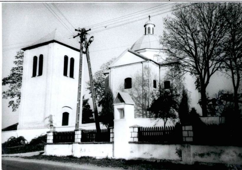
Widok zespołu kościoła par. w Starochę- cinach od strony pd.-wsch.