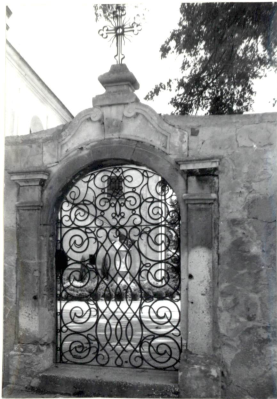
Fot.7. Bramka zachodnia.