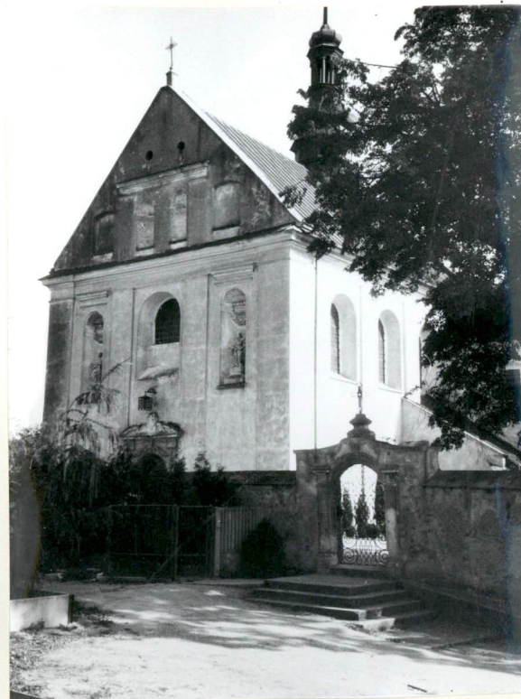
Fot.3. Kościół od zachodu.