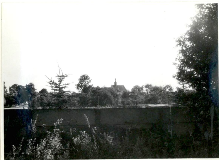
Fot.2. Zespół od północy.