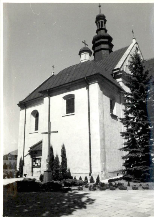
Fot.8. Kościół od południa.