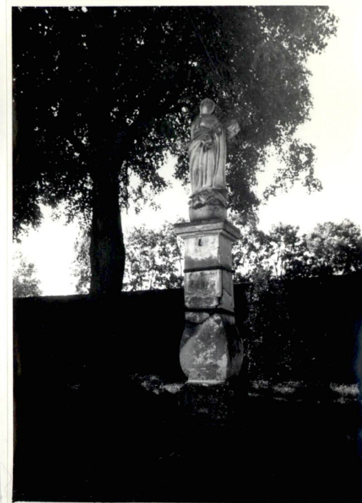
Fot.10. Figura Matki Boskiej na placu kościelnym.