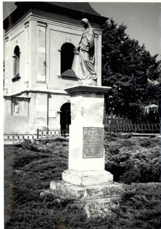
Fot.9. Figura Matki Boskiej przed dzwonnica.