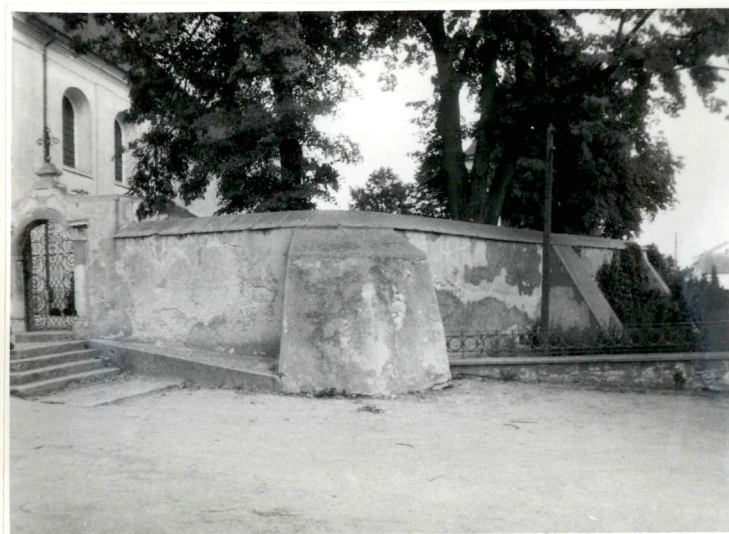
Fot.5. Mur z bramką od zachodu.