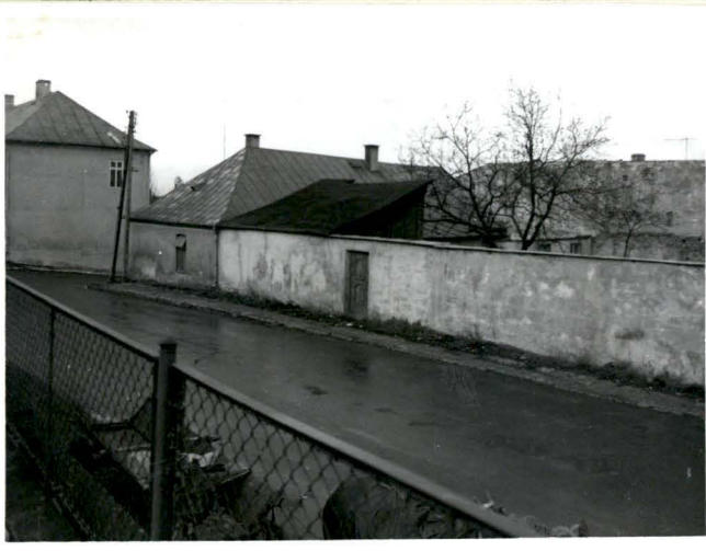
POSESJA OD STRONY PD.