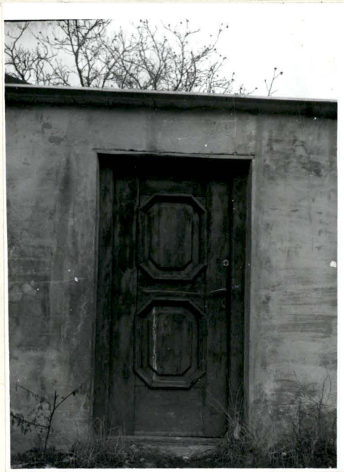
DRZWI W MURZE OD STRONY PD.