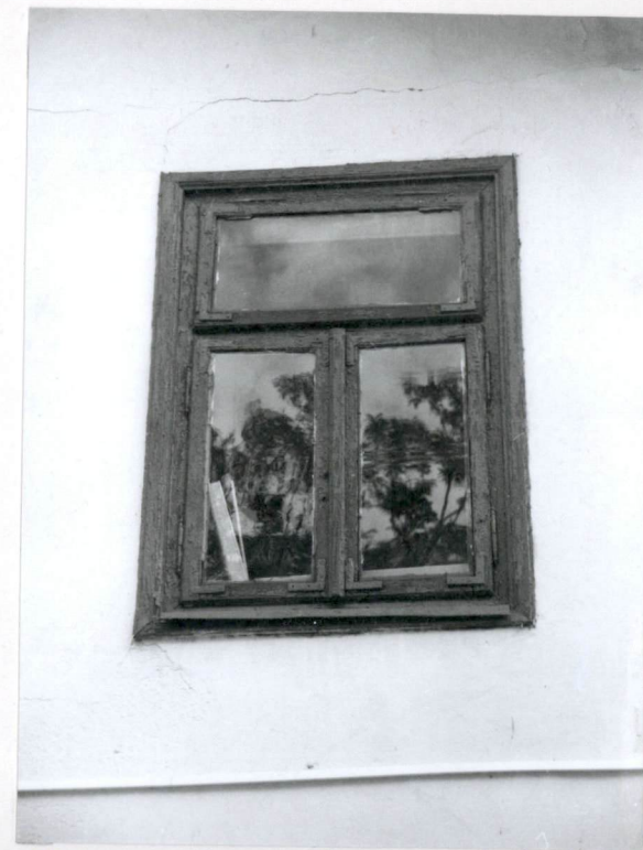
Okno w elewacji wschodniej (nr neg.83/2)