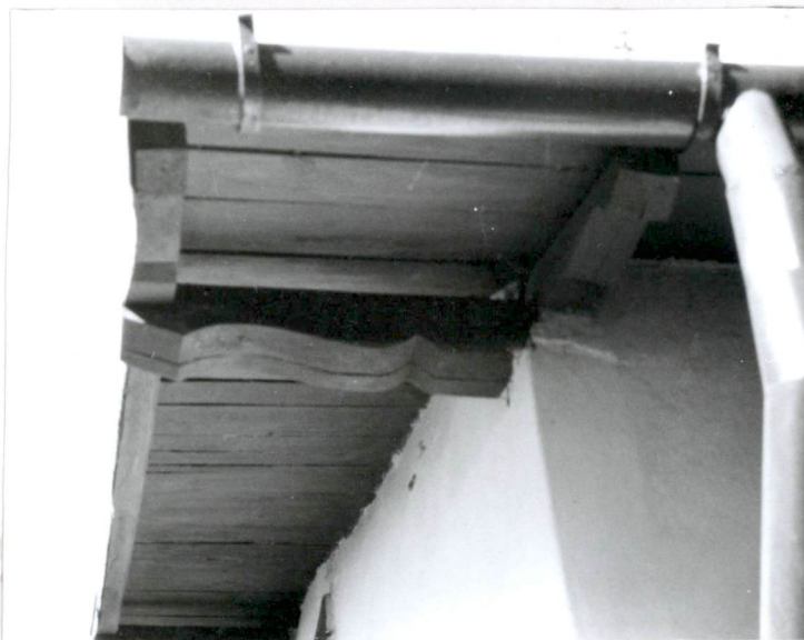
Fragment okapu dachu (nr neg.83/1)