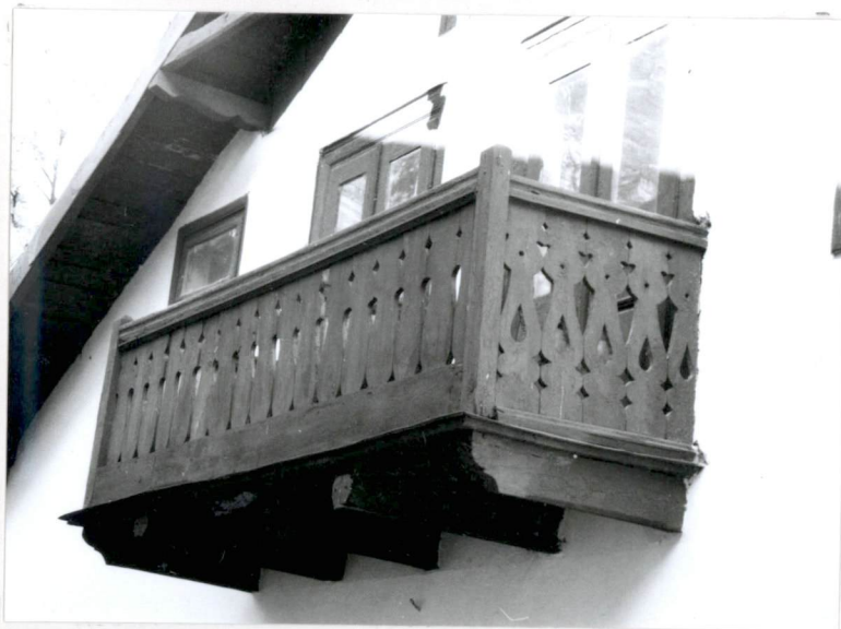
Balkon w elewacji południowej (nr neg.83/4)