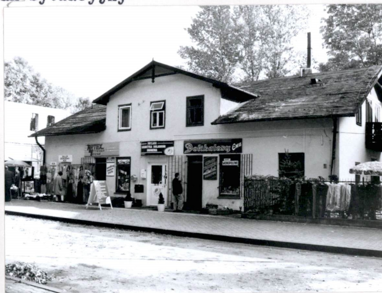
Elewacja zachodnia (nr neg.83/8)