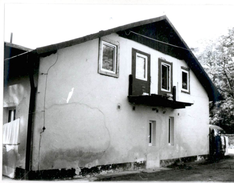
Elewacja północna (nr neg.83/5)