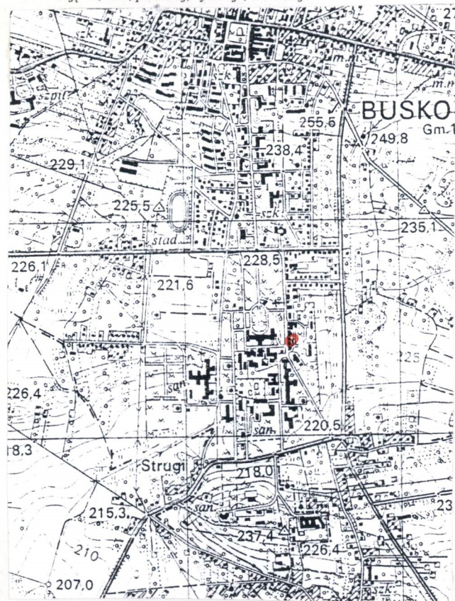
Plan orientacyjny, skala 1:25000. Lokalizacja willi.- w czerwonym kółku.

11. Zdjęcia, rzut, przekrój, sytuacja, orientacja