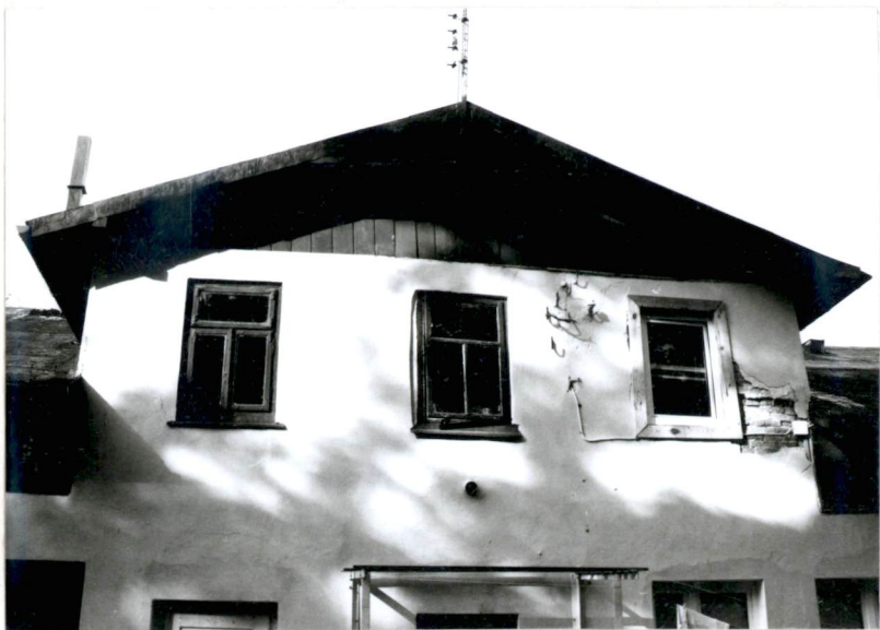
Fragment elewacji wschodniej (nr neg.83/7)