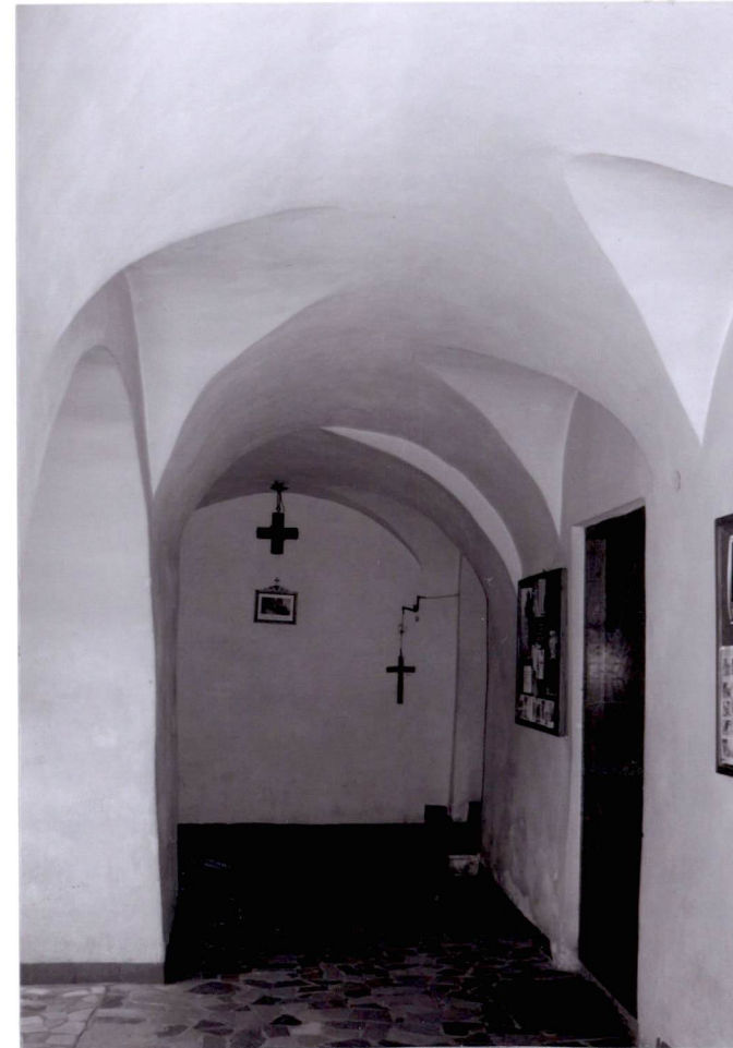
Wnętrze krużganków, widok w stronę północną

Wkładkę założył: ..... (imię, nazwisko, data)