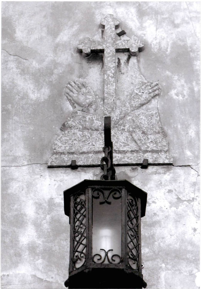
Detal - symbol franciszkański