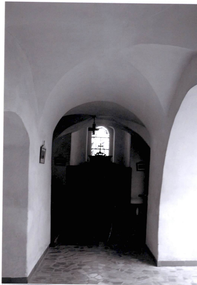
Krużganki, wnętrze, widok w stronę zachodnią