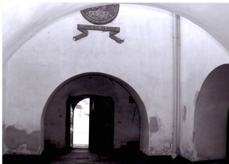
Krużganki - widok w stronę zachodnią

INSTALACJE : elektryczna, c.o., odgromowa