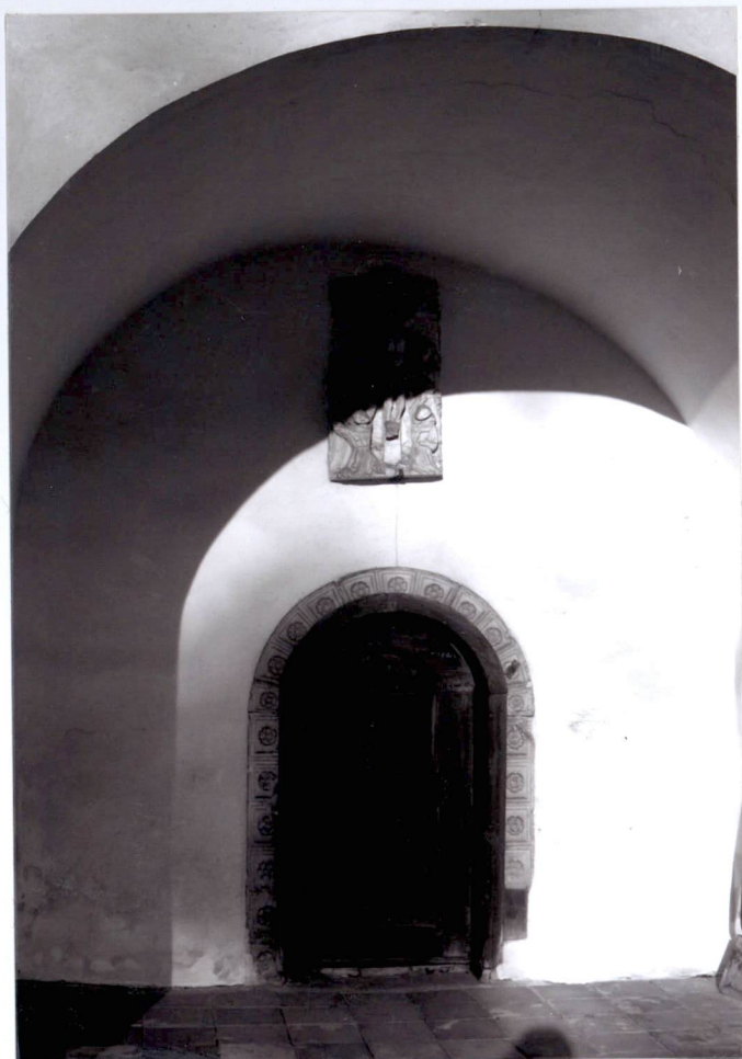
Obejście krużgankowe - wejście od strony cmentarza przykościelnego