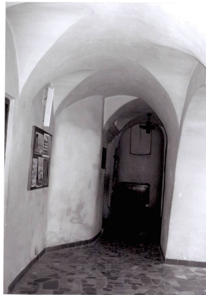
Krużganki, wnętrze, widok w stronę południową