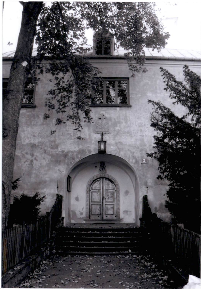
Obejście krużgankowe, wejście główne na teren zespołu