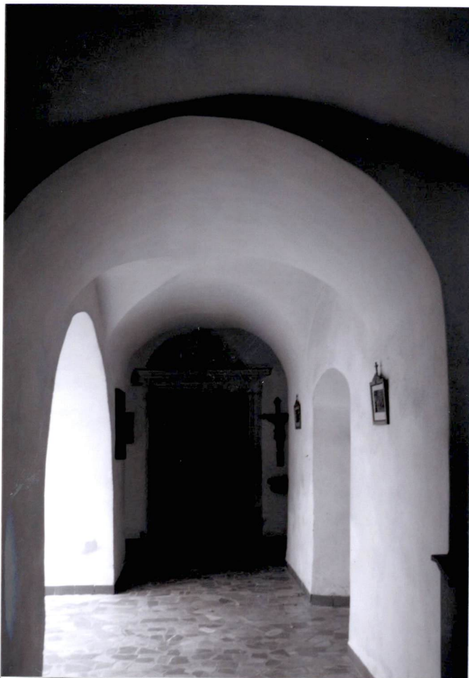
Krużganki, wnętrze, w głębi wejście do kościoła