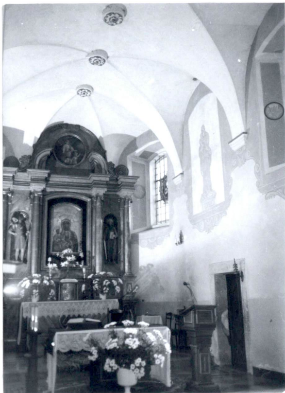
Widok na wnętrze prezbiterium.