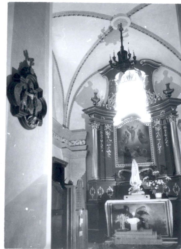
Widok na wnętrze kaplicy Przemienienia Pańskiego.