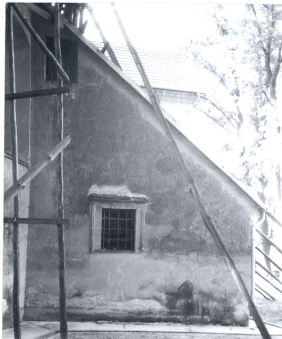
Widok na zakrystię /od strony wsch./.