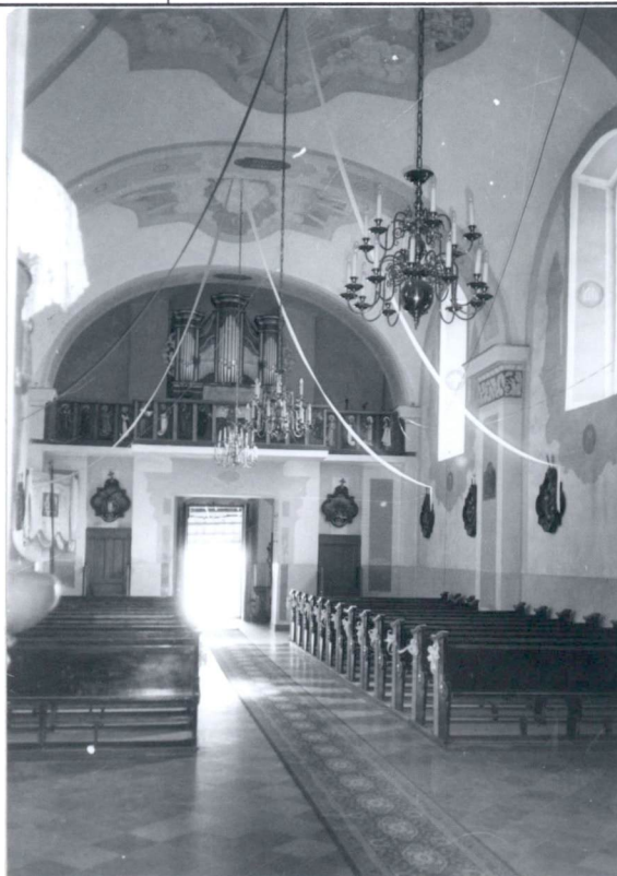
Widok na chór muzyczny.