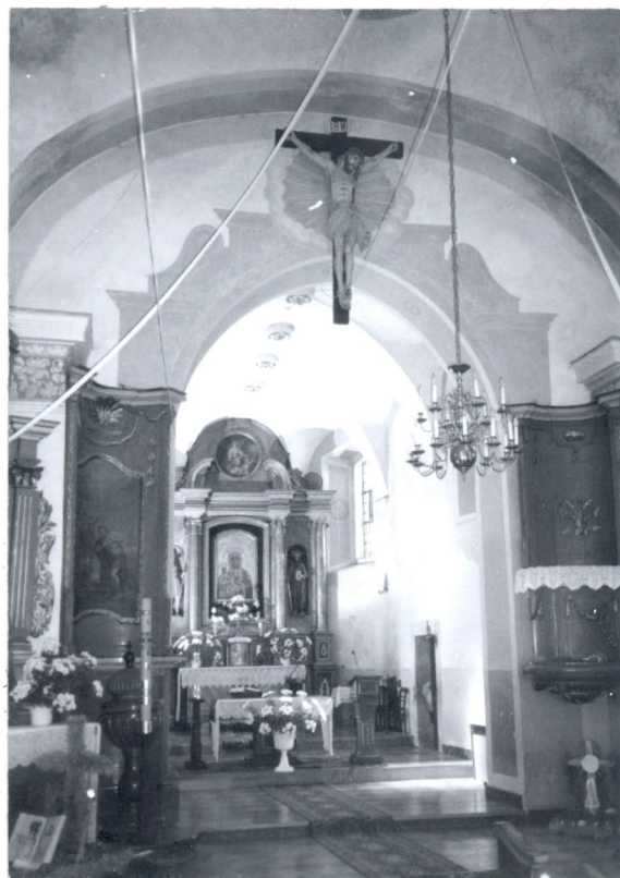
Widok na ścianę tęczową.