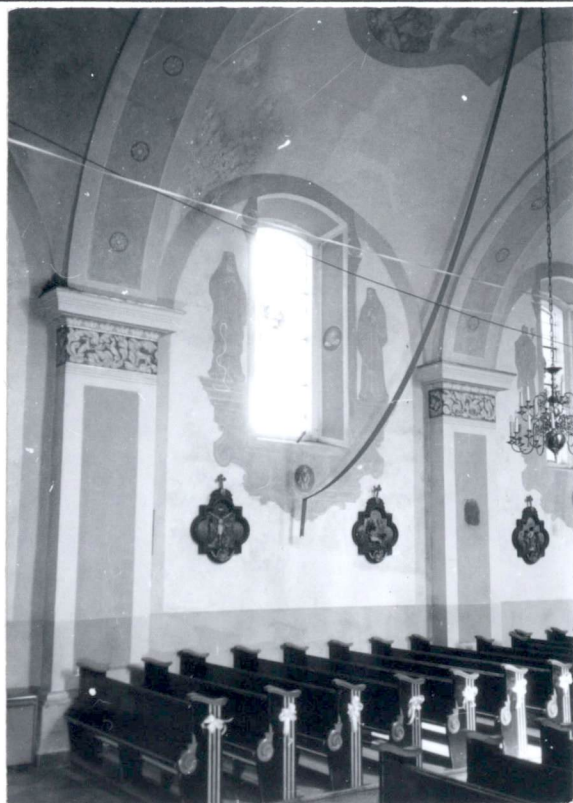
Fragment ściany bocznej nawy /po stronie pn./.

Dokumentacja fotograficzna i plan sytuacyjny zespołu.