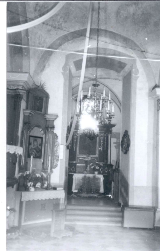
Wejście do kaplicy pd. p.w. Matki Boskiej.