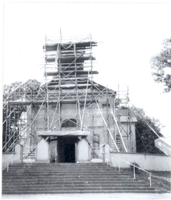
Widok na fasadę kościoła /od strony zach./.