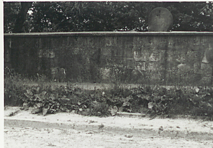
6. FRAGMENT MUROU OGRODZENIOWEGO