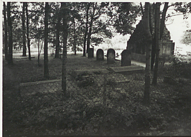
2. WIDOK NA CMENTARZ W KIERUNKU PN.