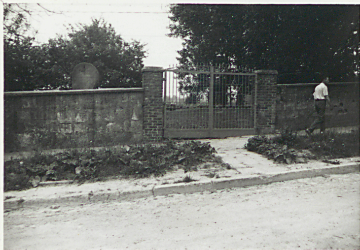
5. BRAMA GŁÓWNA