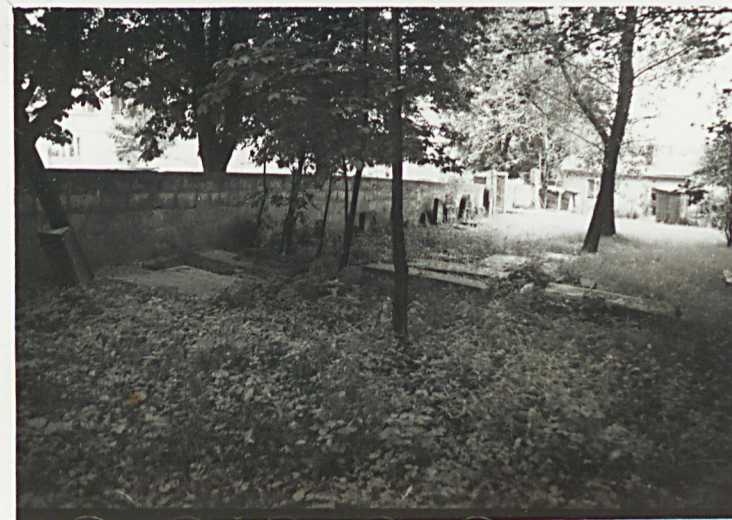
4. FRAGMENT CMENTARZA - WIDOK W KIERUNKU PN.