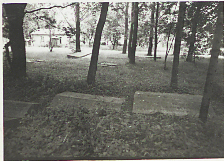
3. PŁYTY NAGROBNE