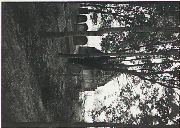
1. POMNIK OFIAR II WOJNY ŚWIATOWEJ Z MACEW