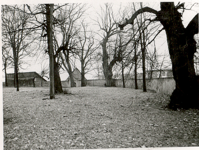
3. WIDOK CMENTARZA W KIERUNKU PD-WSCH.