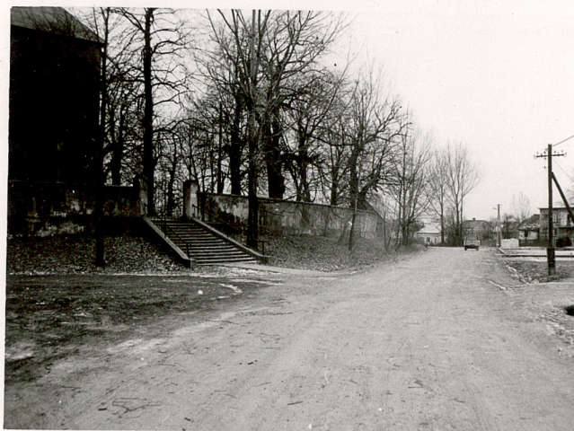
2. WIDOK NA CMENTARZ OD PD-ZACH.