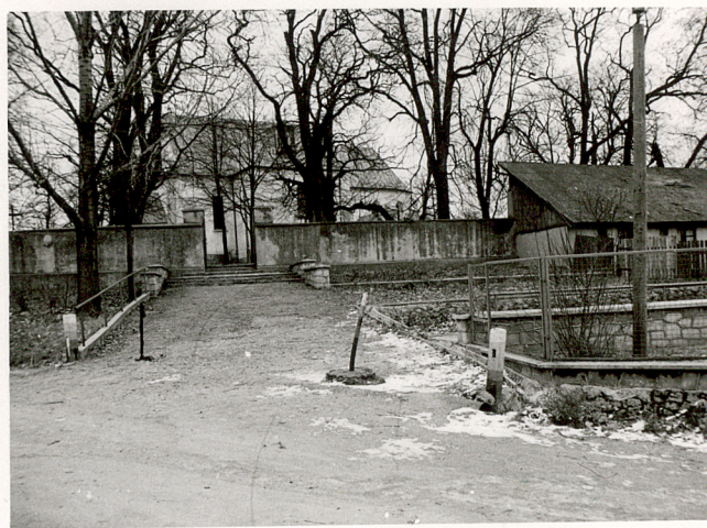
6. WIDOK NA CMENTARZ OD PD.