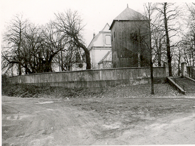
1. WIDOK NA CMENTARZ OD PD-ZACH.