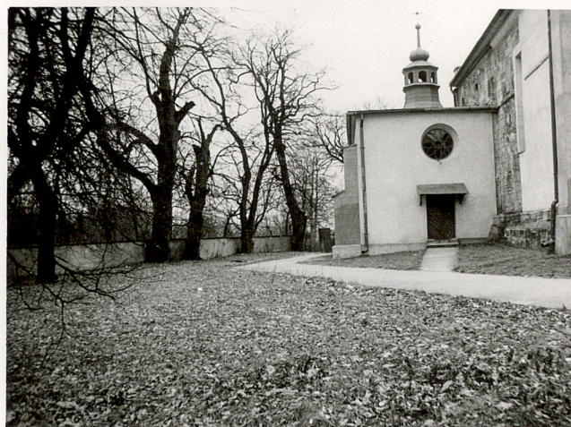
4. WIDOK CMENTARZA W KIERUNKU PN-WSCH