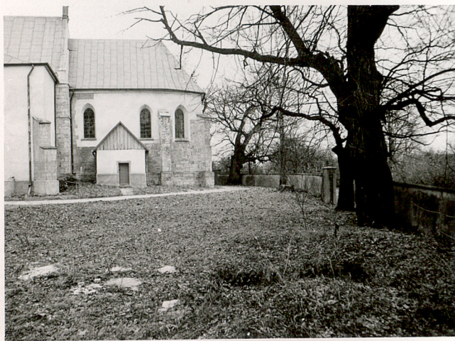
5. WIDOK CMENTARZA W KIERUNKU PN-ZACH.