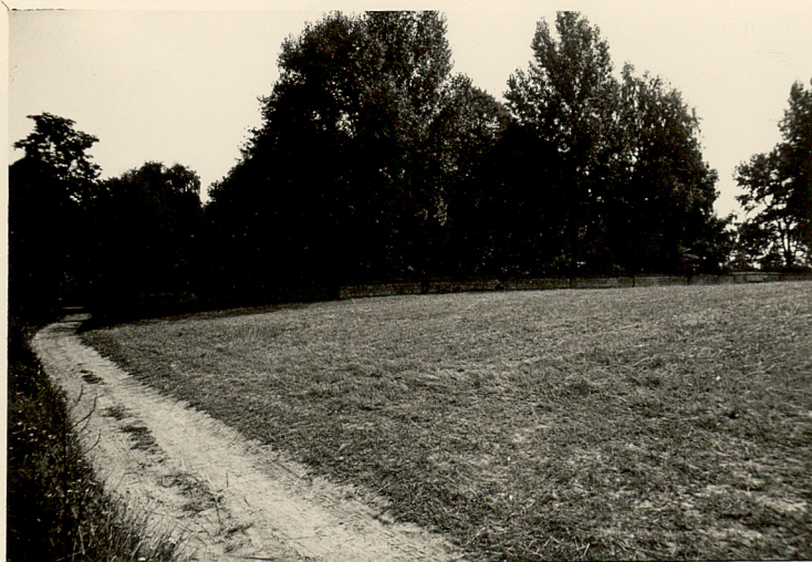
3. WIDOK OD PN - WSCH.