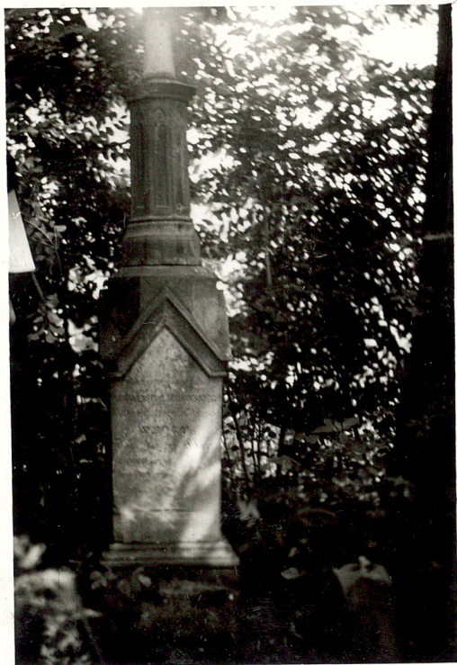
NAGROBEK W. KOPROWSKIEGO