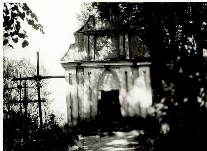
2. KAPLICA GROBOWA ROHOZIŃSKICH