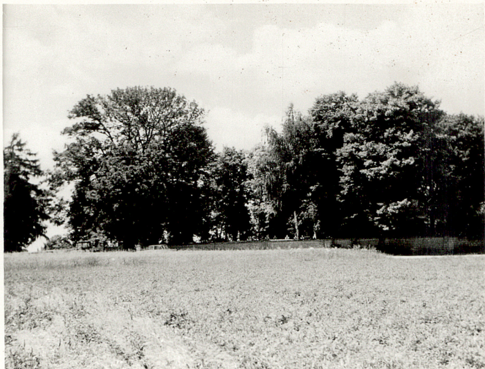
1. WIDOK NA CMENTARZ Z KIERUNKU PN.