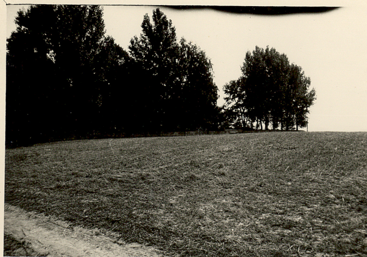
4. WIDOK OD WSCH.