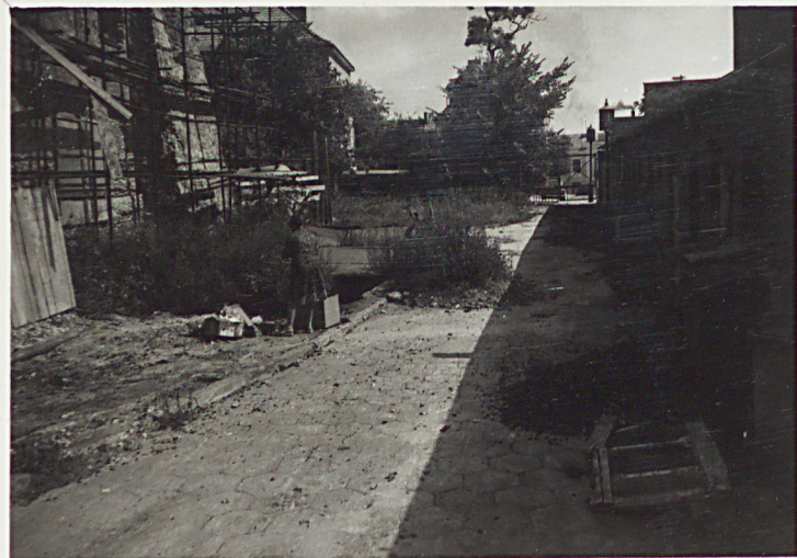
1. TEREN CMENTARZA OD ZACH.