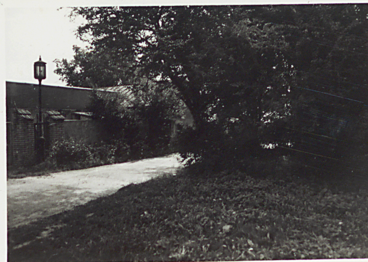
2. TEREN KOŚCIOŁA OD PN.