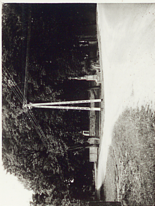
5. WIDOK OD WSCH. NA NAJSTARSZĄ CZEŚĆ CMENTARZA