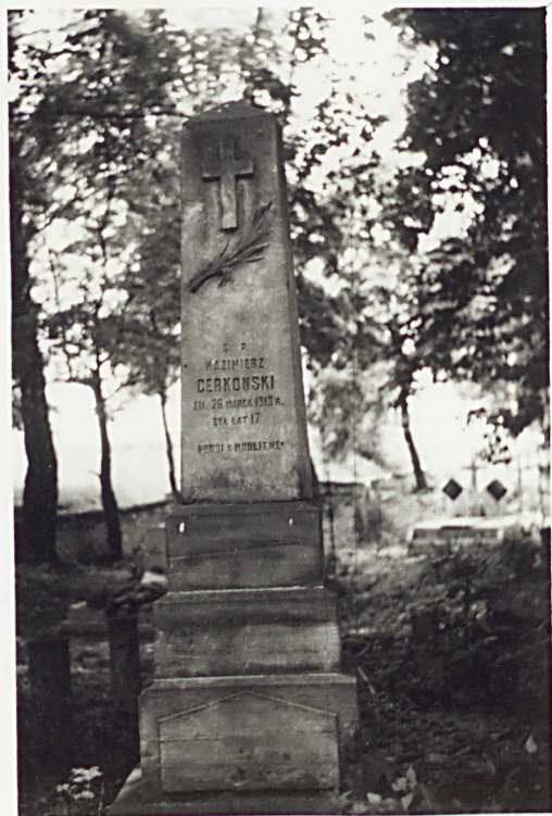
NAGROBEK ŻN. KAZIMIERZA CERKOWSKIEGO