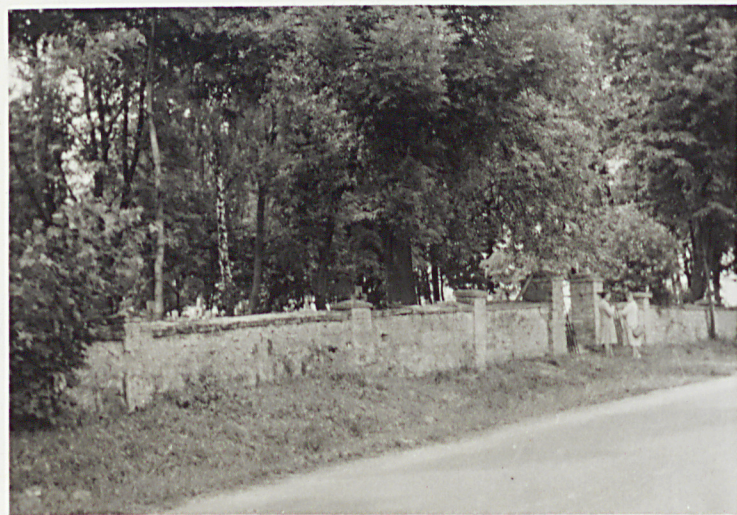
3. MUR OGRODZENIOWY STAREGO CMENTARZA OD WSCH.