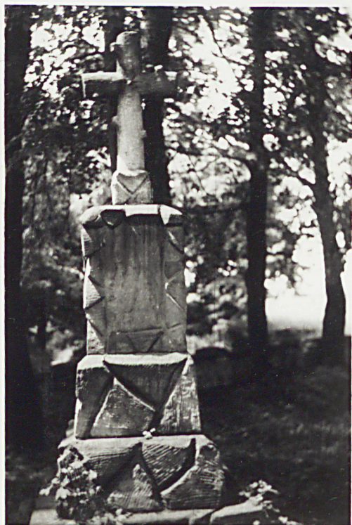
NAGROBEK ZM. MICHAŁINY WIKTOROWSKIEJ