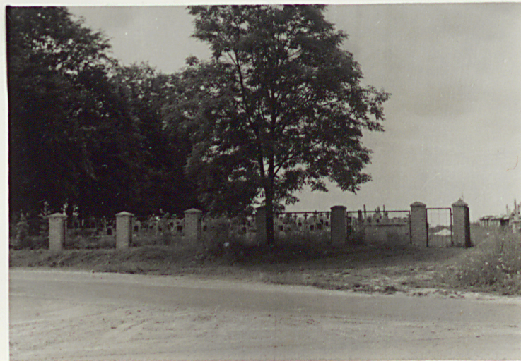
4. OGRODZENIE NOWEJ CZĘŚCI CMENTARZA OD WSCH.