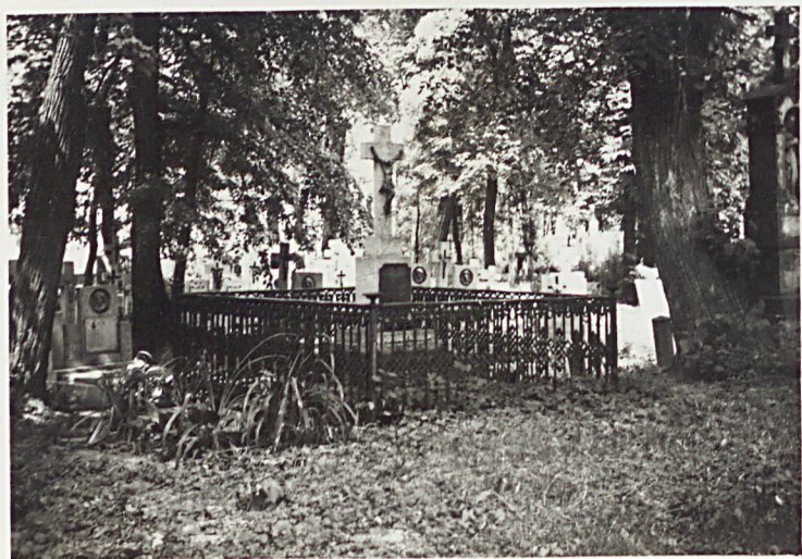
1. WIDOK Z PD-ZACH. NA NAJSTARSZĄ CZĘŚĆ CMENTARZA