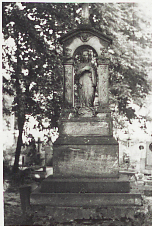
NAGROBEK ZM. JULIANNY OZDZYŃSKIEJ