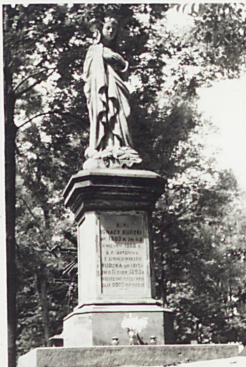
NAGROBEK ŻN. IGNACEGO RUDZKIEGO