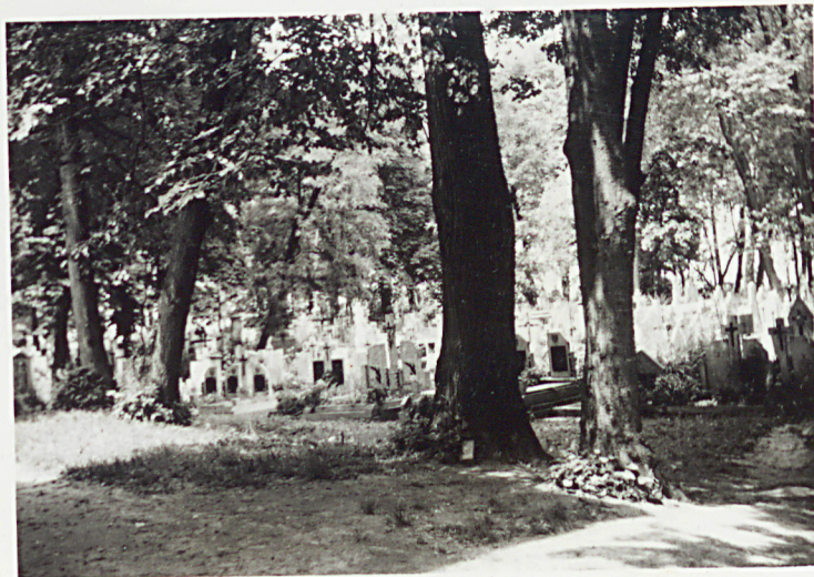
2. WIDOK OD KOŚCIOTA W STRONĘ CMENTARZA