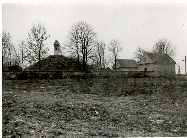
4. WIDOK NA CMENTARZ OD PN-ZACH.