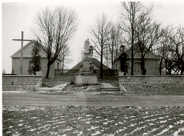
2. WIDOK NA CMENTARZ OD PD.