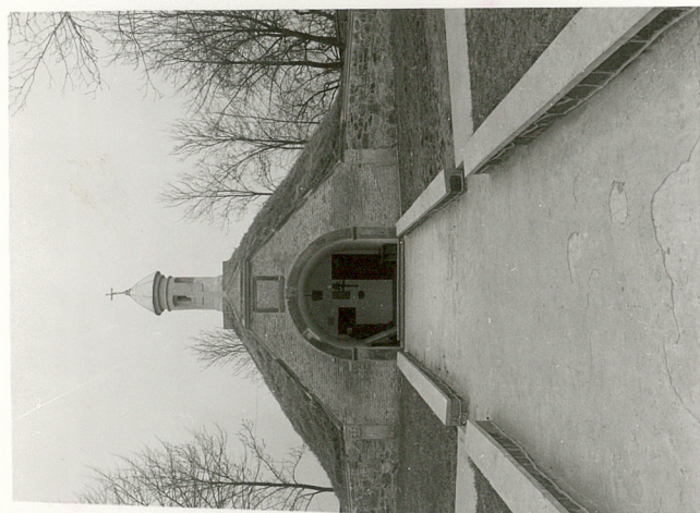
3. KAPLICA GROBOWA