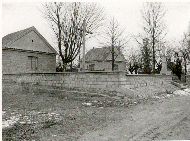
1. WIDOK NA CMENTARZ OD PD-ZACH.