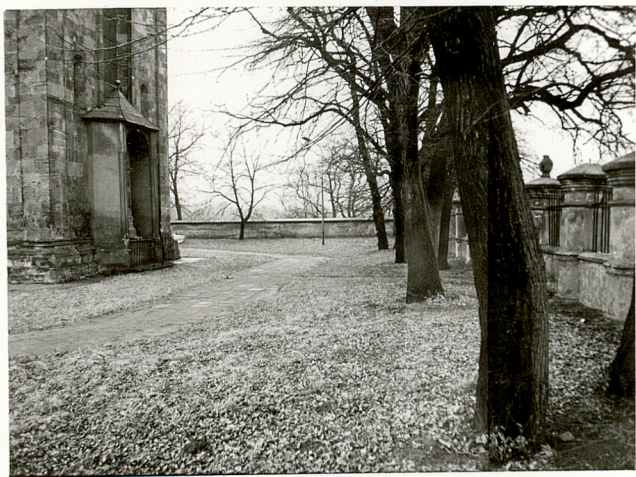
3. WIDOK CMENTARZA W KIERUNKU PN.