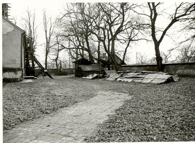
4. WIDOK CMENTARZA W KIERUNKU ZACH.