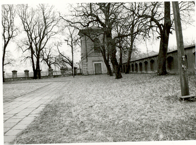
2. WIDOK CMENTARZA W KIERUNKU NSCH.