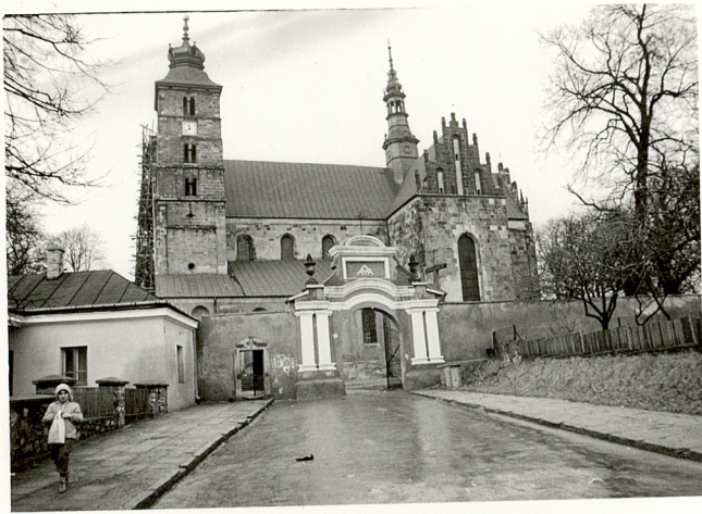
1. BRAMA GŁÓWNA