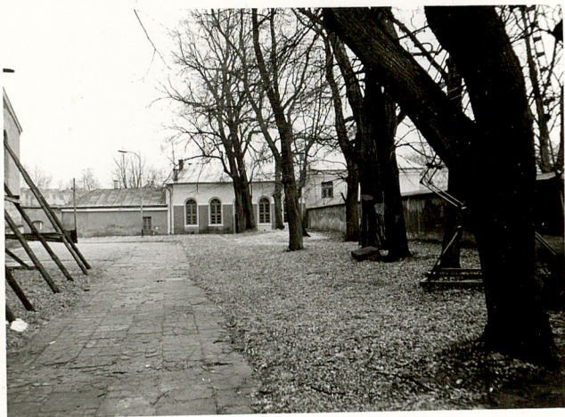
5. WIDOK CMENTARZA W KIERUNKU PD.