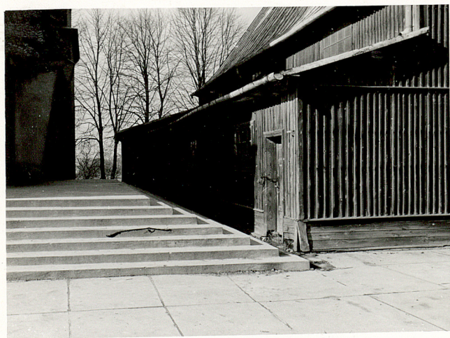
3. WIDOK CMENTARZA W KIERUNKU ZACH.