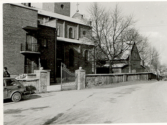
2. WIDOK NA CMENTARZ OD PD-WSCH.