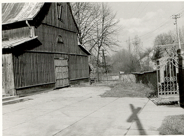
1. WIDOK CMENTARZA W KIERUNKU PN.