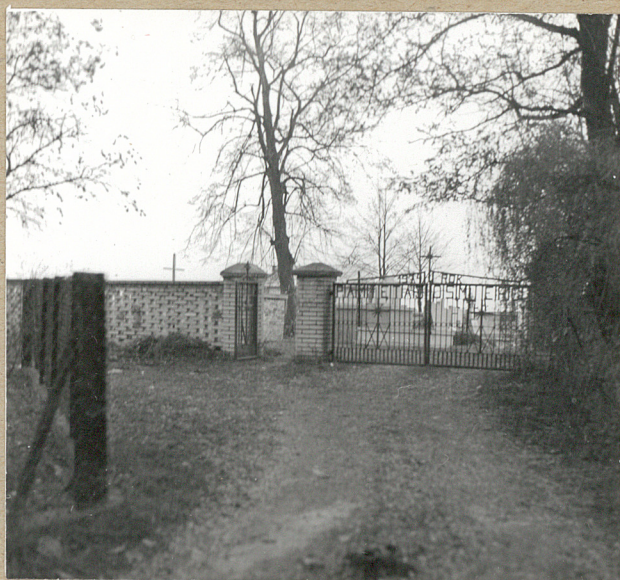
1. BRAMA WEJŚCIOWA