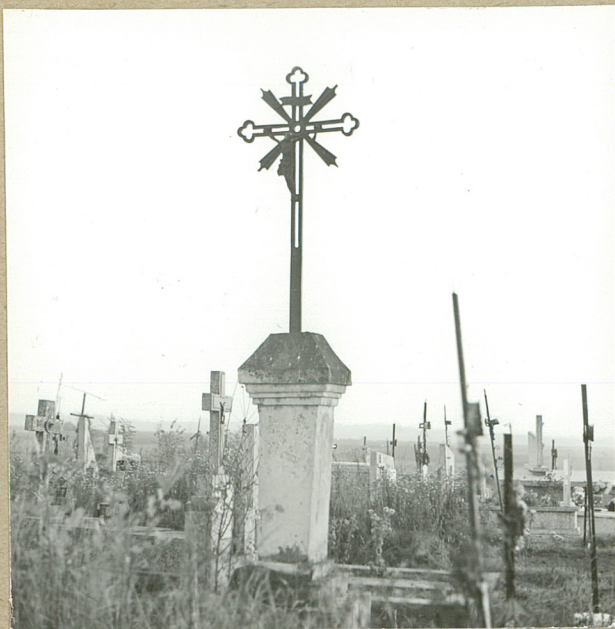
5. 1886 NN