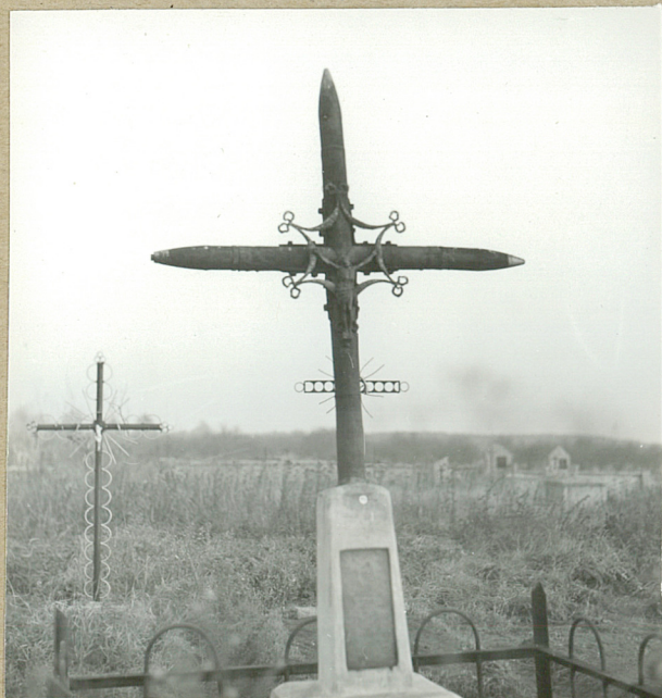
9. BOLESŁAW ŚLEŻYK, 1944