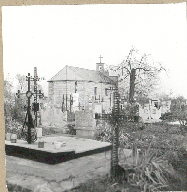
3. W STRONĘ, KAPLICY OD ZACH.