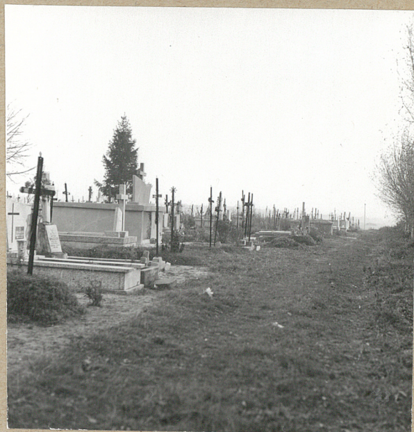
2. WIDOK OD BRAMY