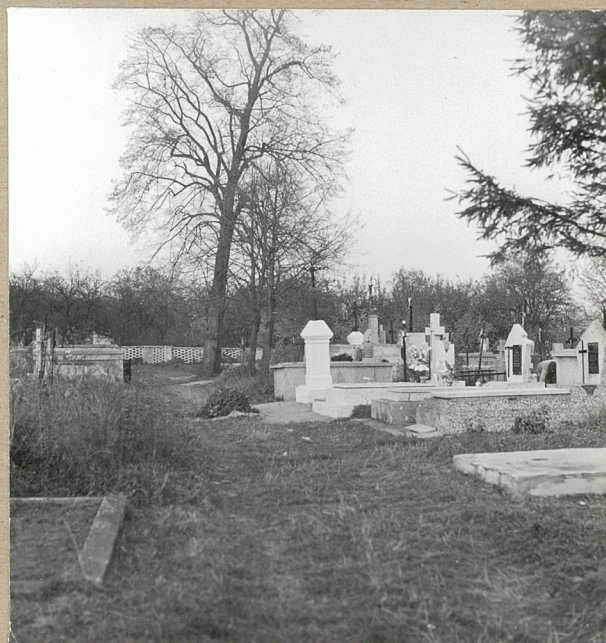
4. STRONA PN.