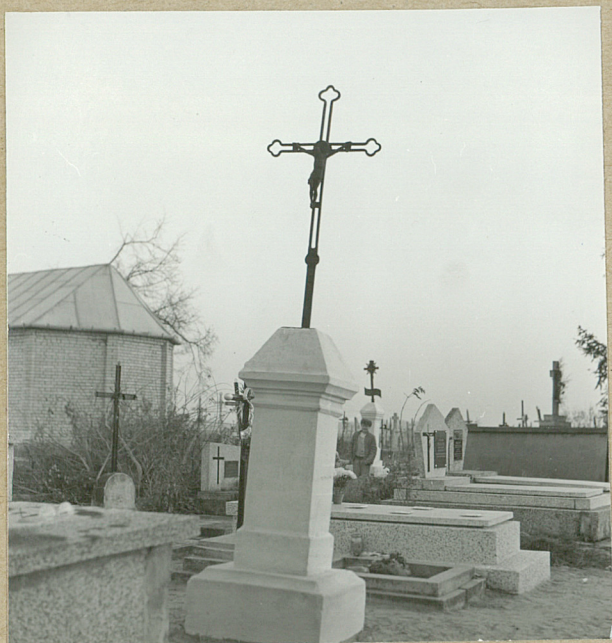
7. NN, 1913