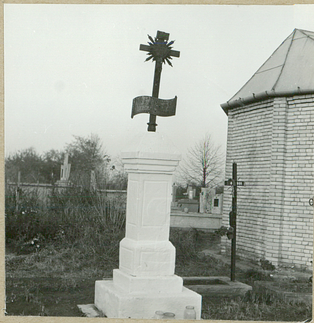
6. BŁAŻEJ WERDO, 1887