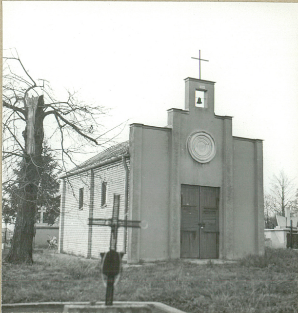
10. KAPLICA, 1979