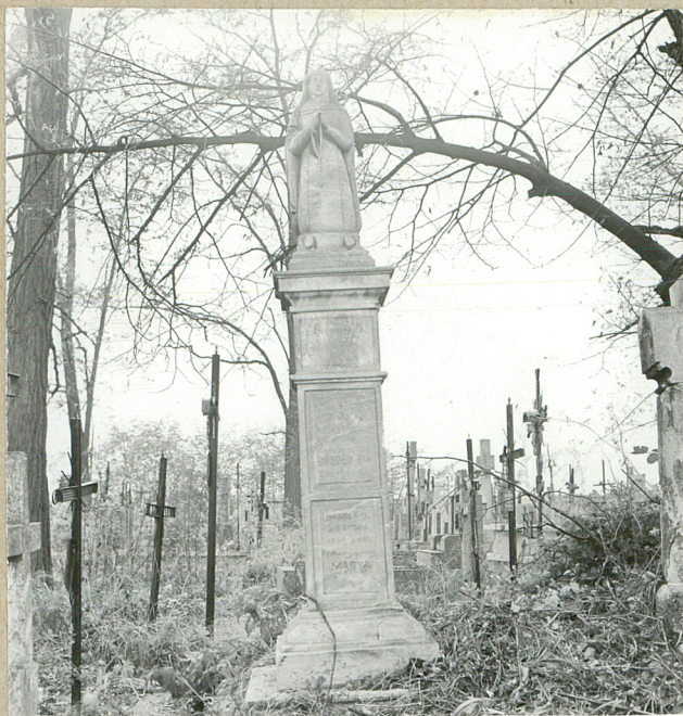
8. FRANCISZKA BRZOZOWSKA, 1890