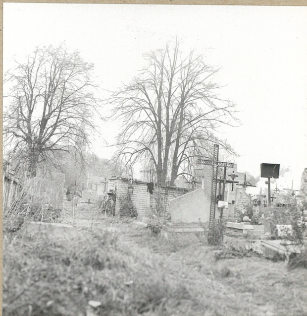
4. ALEJA W LEWO OD BRAMY