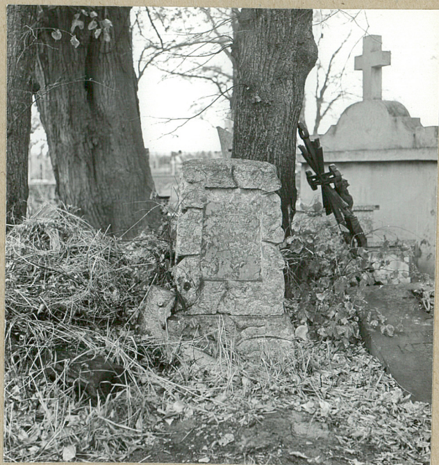
6. ANASTAZY REMISZEWSKI, 1906 WŁAŚCICIEL MAJATKU ZAGORZANY