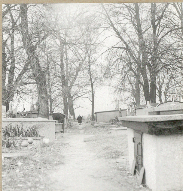
2. ALEJA OD BRAMY