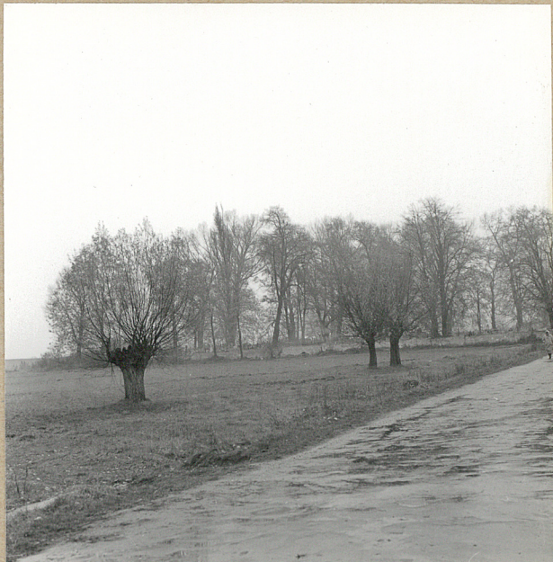
1. WIDOK Z DROGI OD PD.