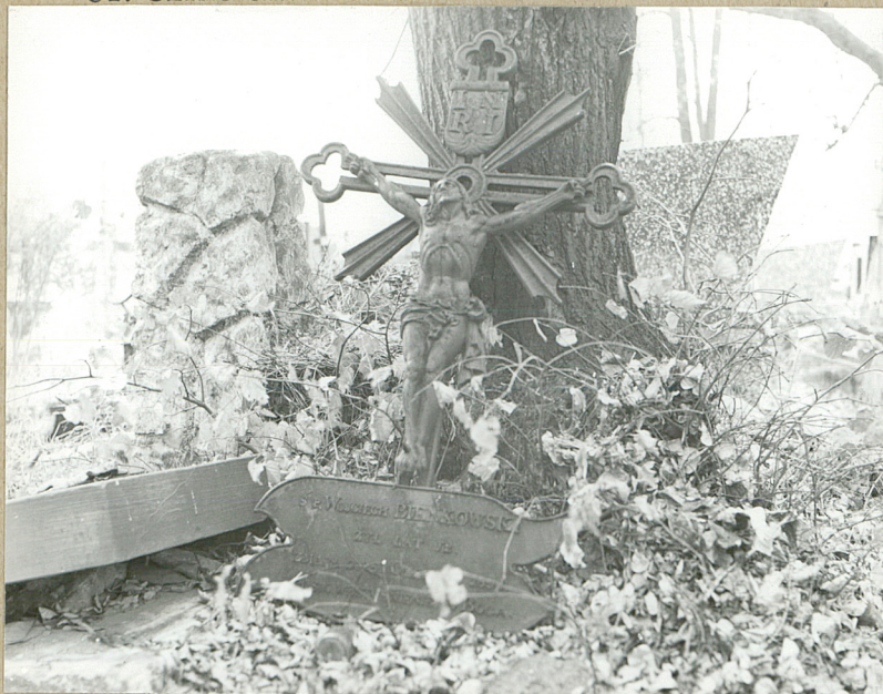
5. WOJCIECH BIENKOWSKI, 1852