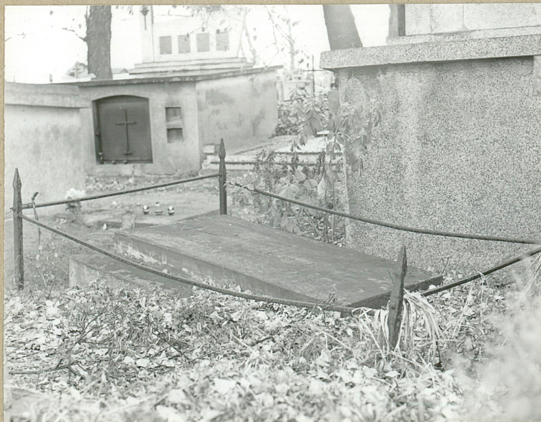
7. KS. HIPOLIT BOREWICZ, 1907