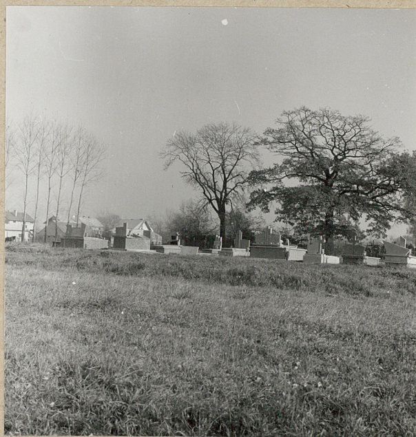
3. GROBOWCE W STRONIE WSCH. NA 31. Szkic cmentarza TŁE CMENTARZA PARAFIALNEGO