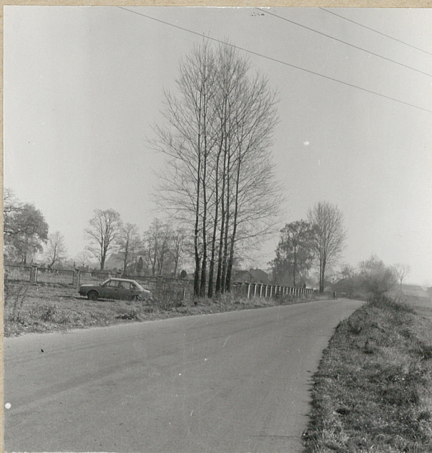
1. WIDOK Z DROGI OD ZACHODU