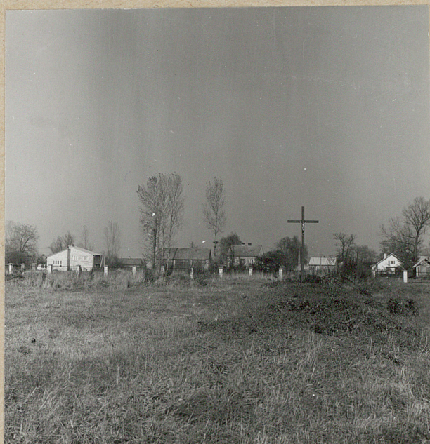
2. WIDOK OGÓLNY OD BRAMY