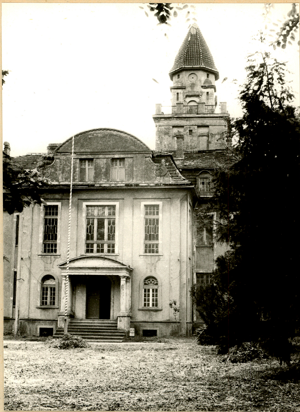
Fot. 1. Nieznanice. Dwór od frontu. 1987 r.