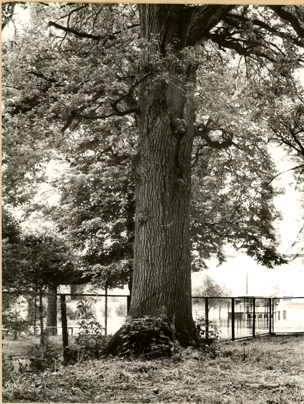
Fot. 7. Nieznanice. Pomnikowy dąb szypułkowy. fot. A. Grzyl 1987