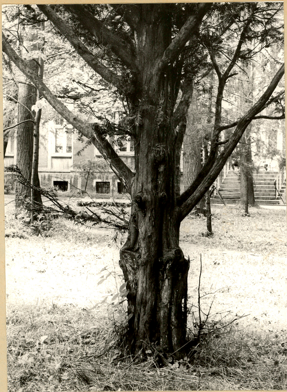
Fot. 4. Nieznanice. Cis pospolity. 1987