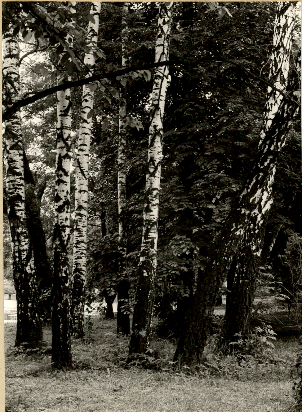
Fot. 6. Nieznanice. Altanka brzozowa. 1987