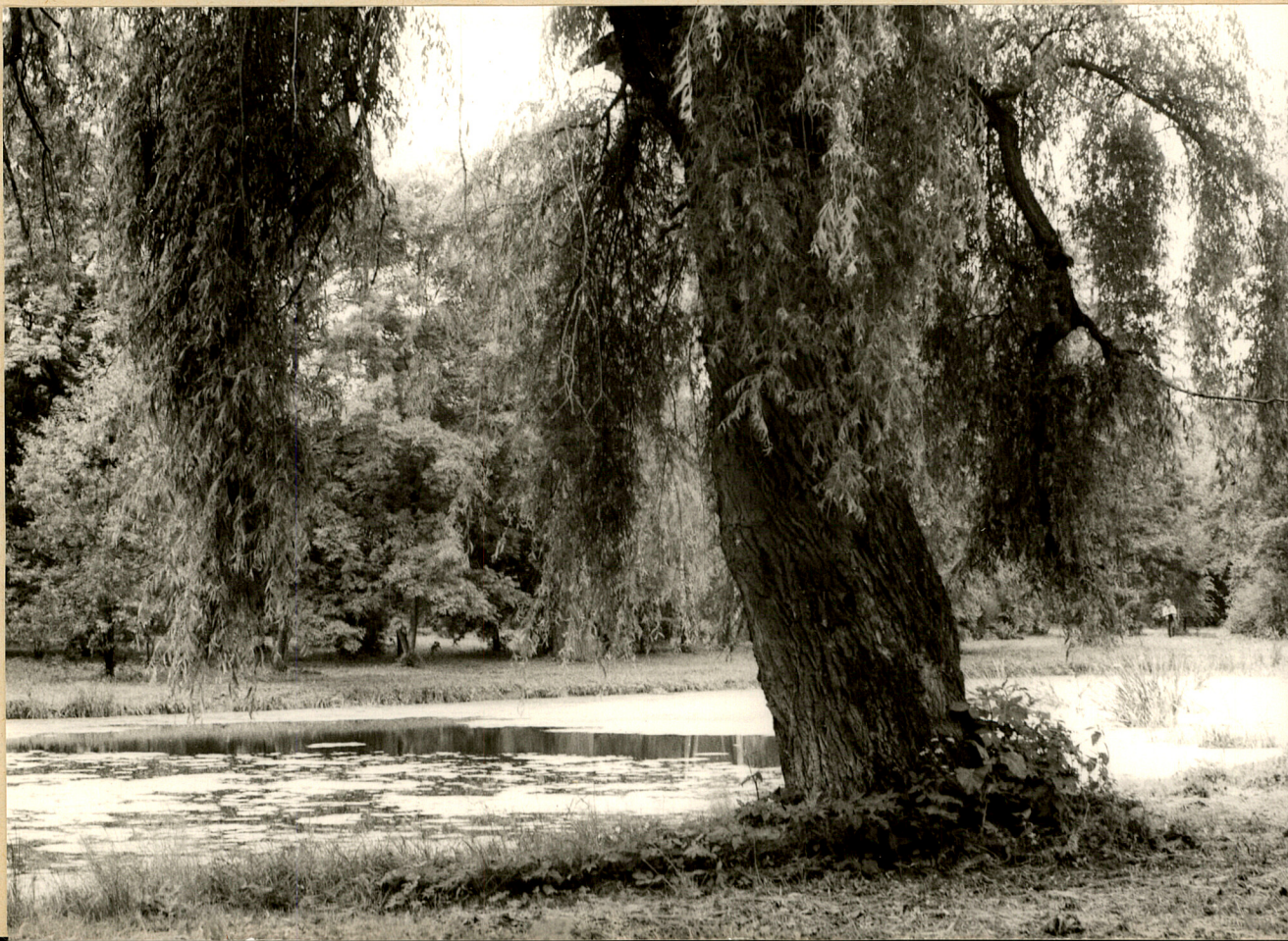
Fot. 3. Nieznanice. Wierzba biała odm. zwisająca na brzegu stawu. fot. A. Grzyl 1987 r.