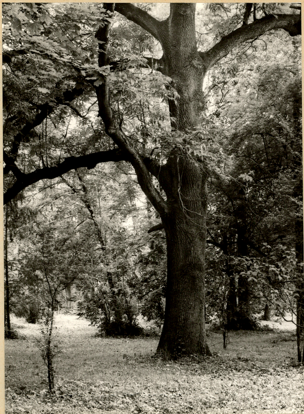
Fot. 5. Nieznanice, Fragment parku. fot. A. Grzyl 1987 r.