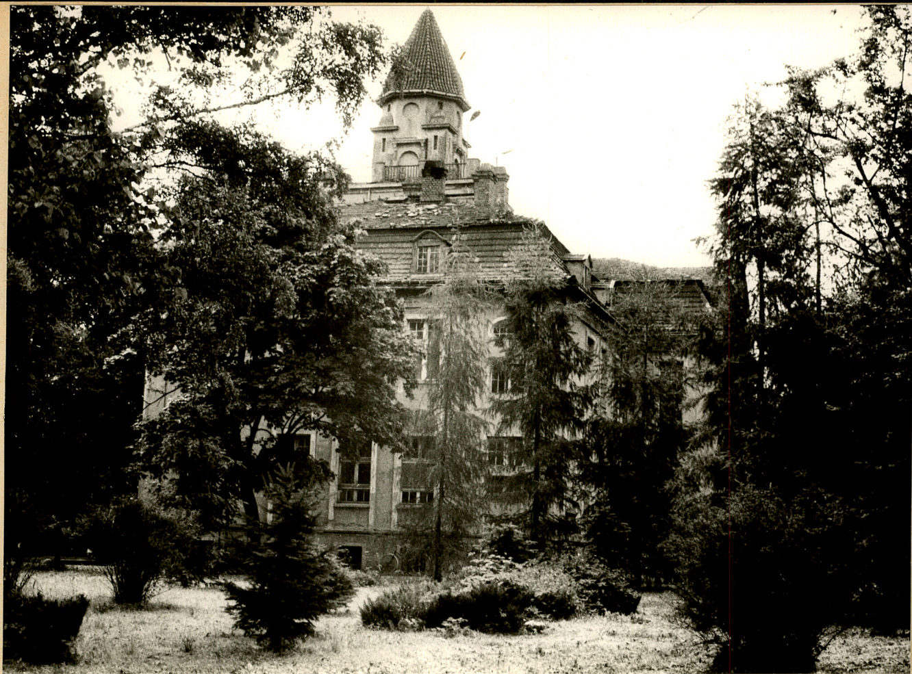
Fot. 2. Nieznanice. Dwór od strony stawu. fot. A. Grzyl 1987 r.