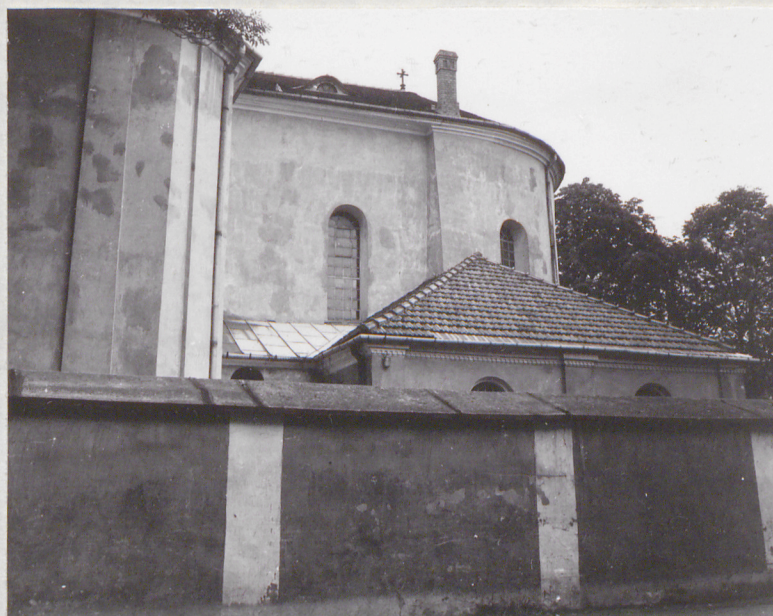
wschodni fragment elewacji południowej /widok z ulicy/