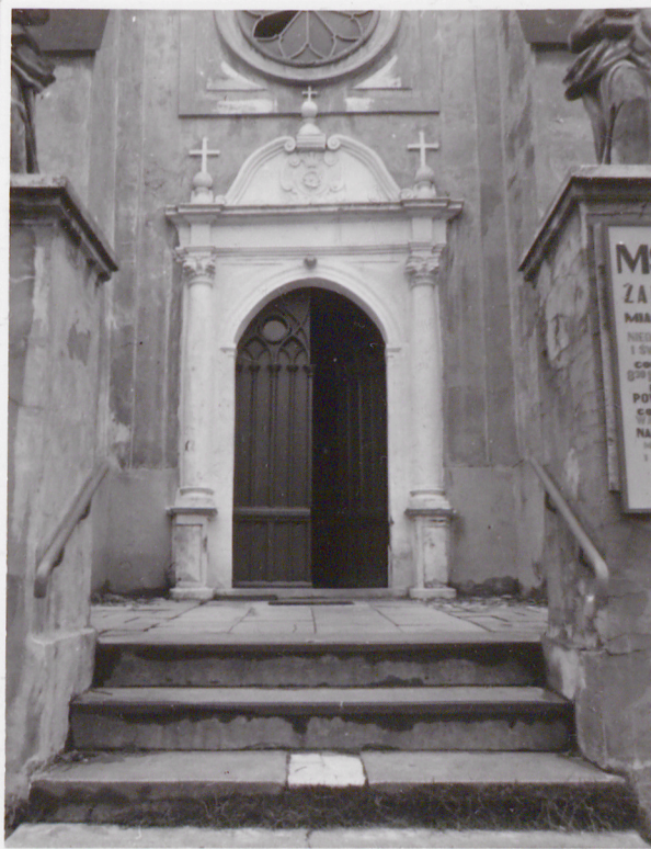
Portal w fasadzie zach.