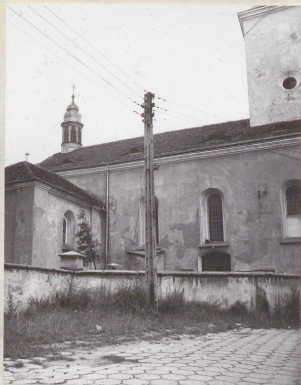
widok od strony północnej na część środkową elewacji pół- nocnej /z ulicy/