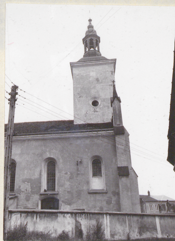
widok na wieżę i fragment zachodni elewacji północnej /z ulicy/