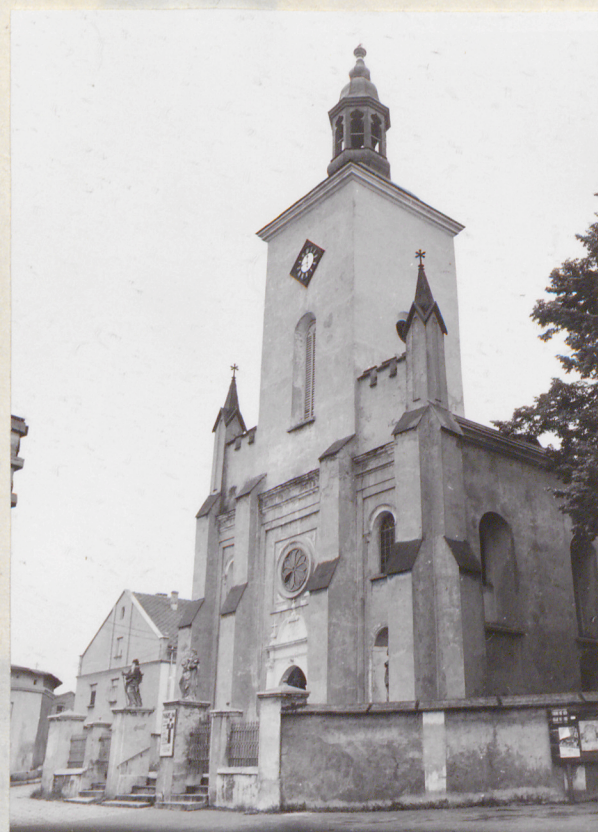
widok od strony południowo-zachodniej