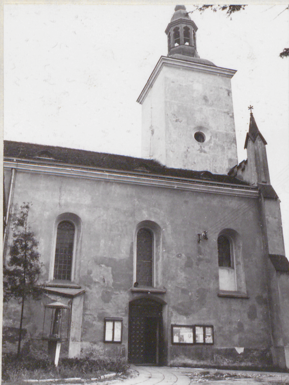
zachodni fragment elewacji północnej