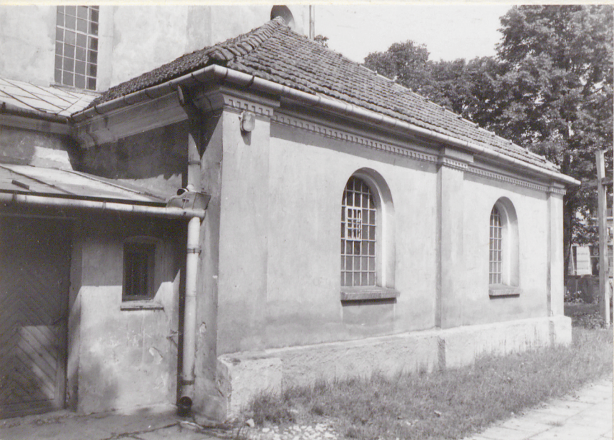
Zakrystia od pd-zachodu.