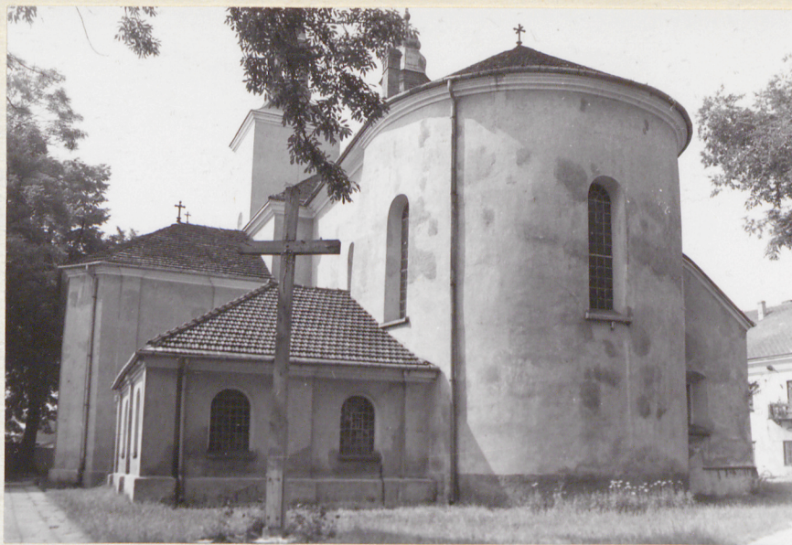
Widok ogólny od pd-wschodu.