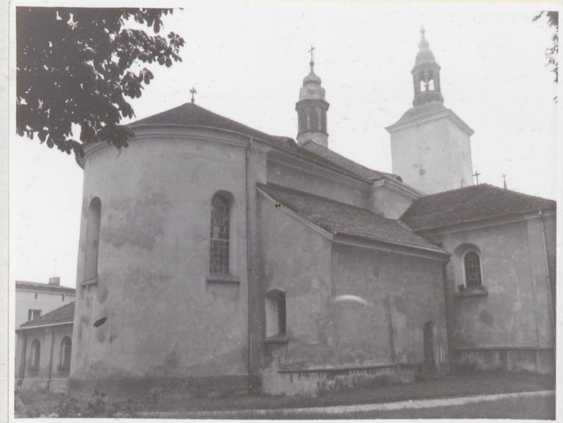
Widok od strony pn-wschodniej (fragment).