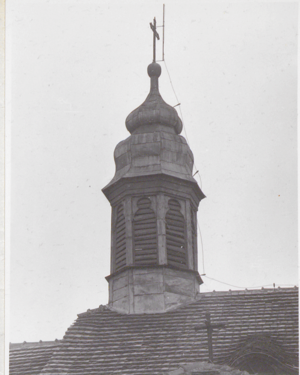
Sygnaturka - widok od północy.