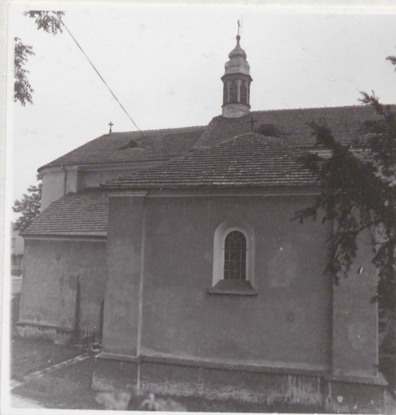
Widok od strony północnej (fragm.)