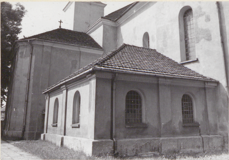
Zakrystia od pd-wschodu.