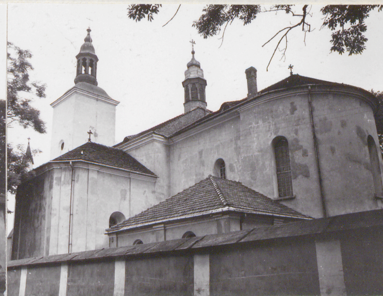
widok od strony południowo- wschodniej /z ulicy/