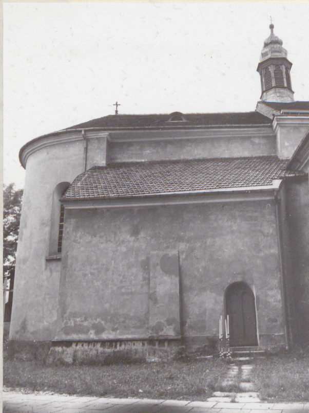
wschodni fragment elewacji północnej