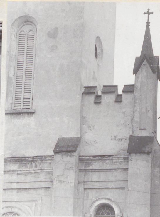
Fasada - fragment.