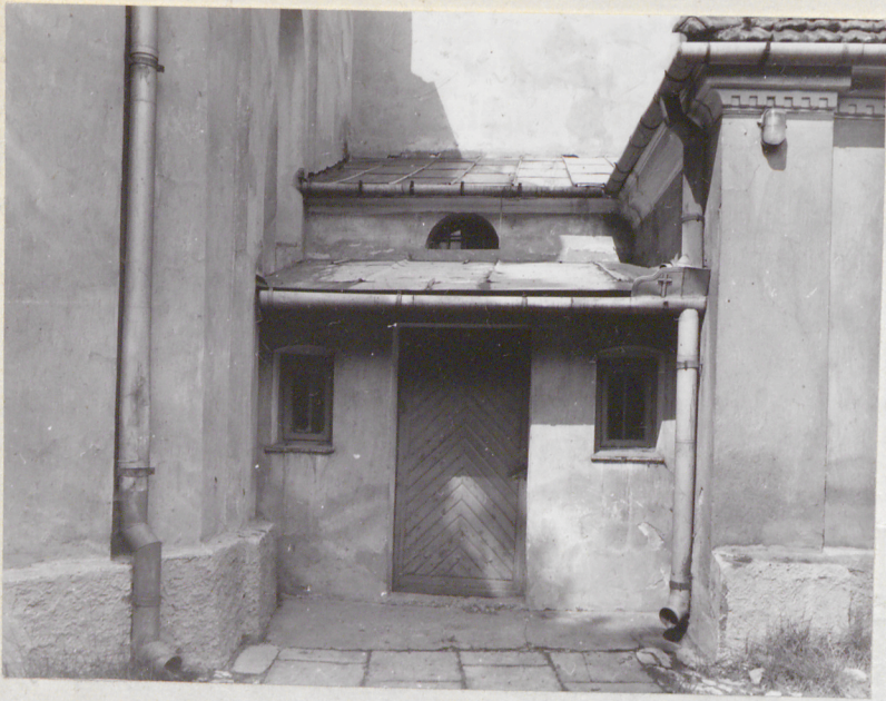
Pomieszczenia przy zakrystii.