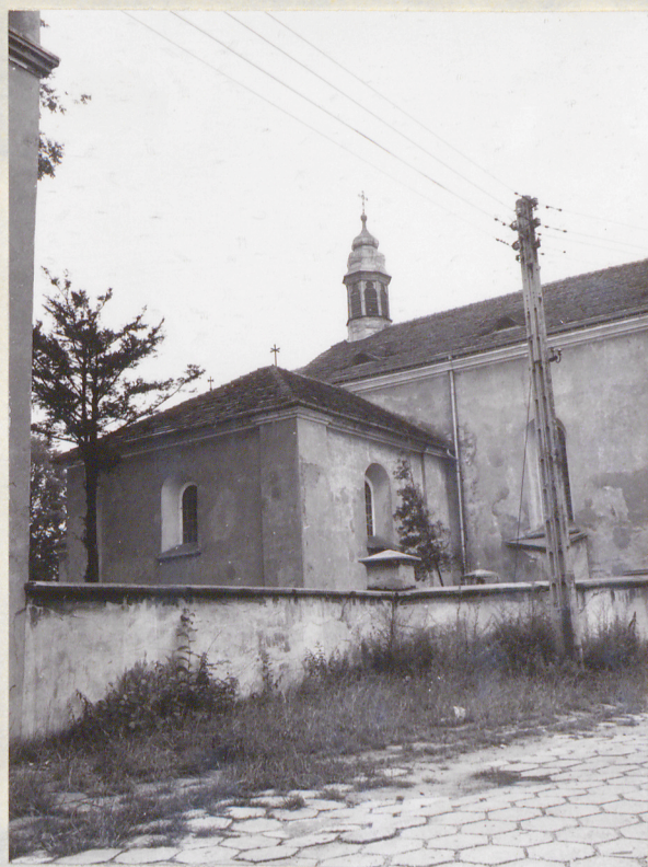
widok od strony północno- zachodniej na kaplicę pół- nocną /z ulicy/