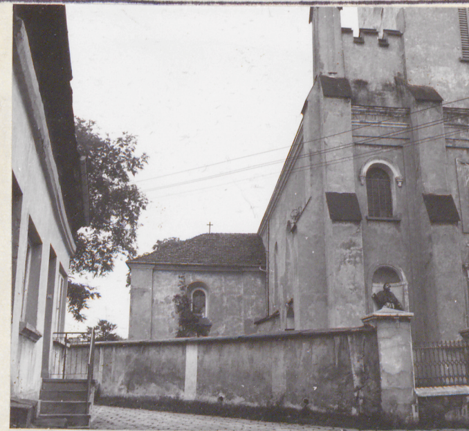
widok od strony zachodniej na kaplicę północną i fragment elewacji frontowej