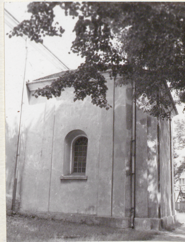
Kaplica południowa - widok od pd-zachodu.