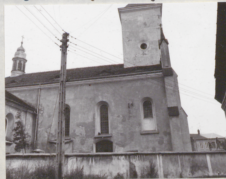
widok od strony północnej na zachodni fragment elewacji północnej /z ulicy/