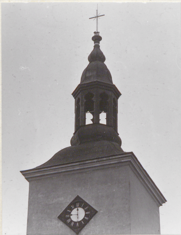
Hełm wieży od str. zach.