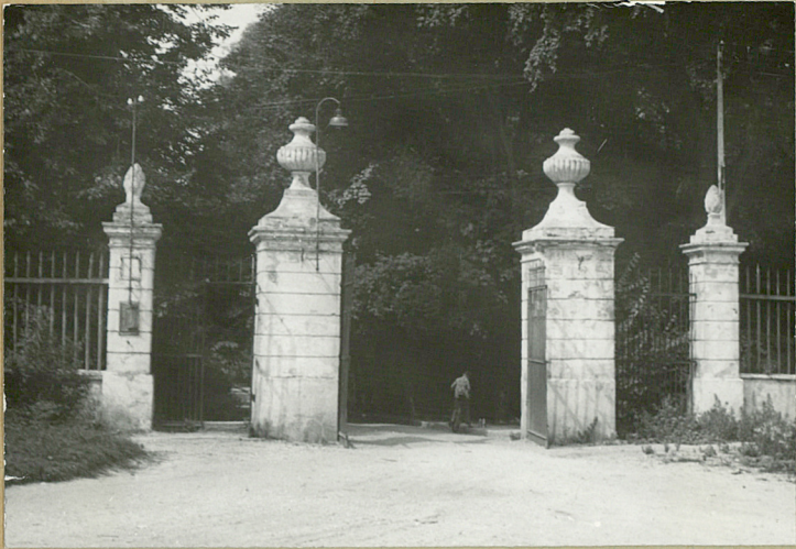
Plan i fotogra- fie - SGB Gołubiew