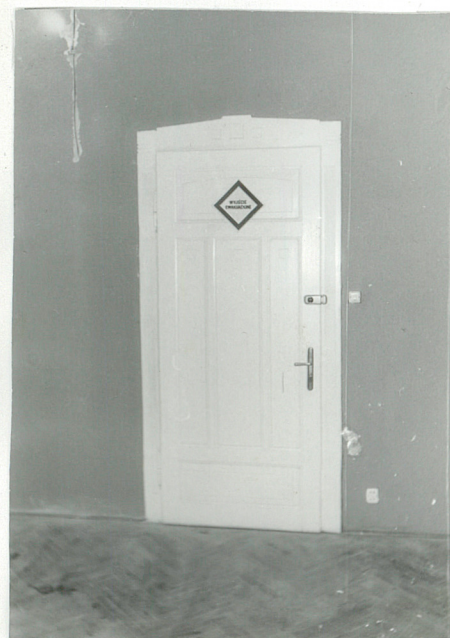
DRZWI IZBY NA PIĘTRZE