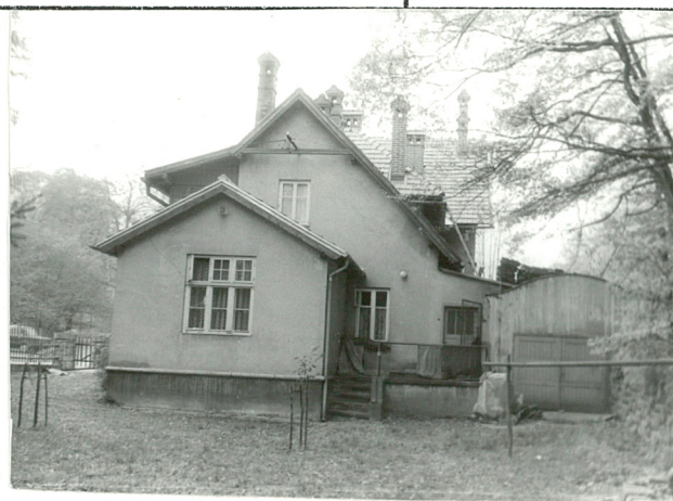
1-ELEWACJA PD. 2-ELEWACJA WSCH.