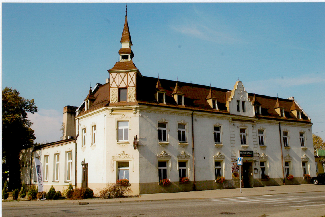
Budynek, widok od strony południowo-wschodniej