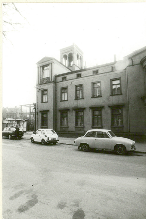
Pałacik Fitznera część północna elewacji zach.