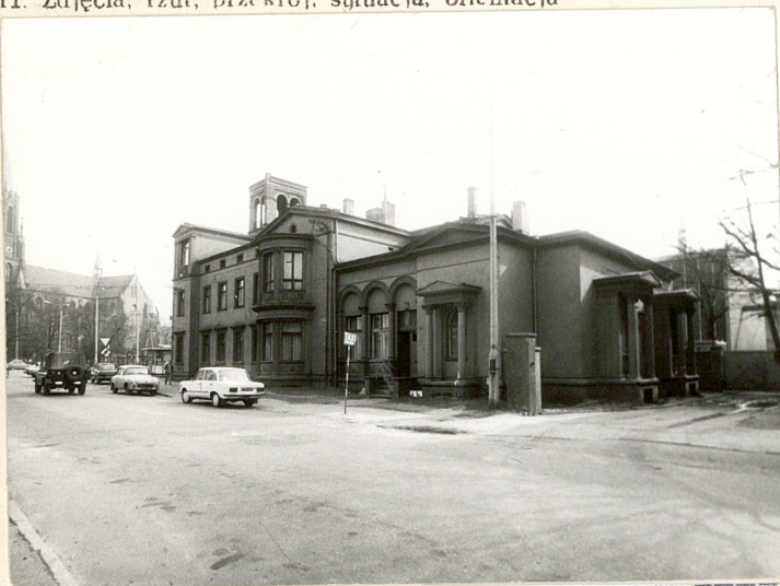
Pałac Fitznera widok pd pd.-zach.

11. Zdjęcia, rzut, przekrój, sytuacja, orientacja