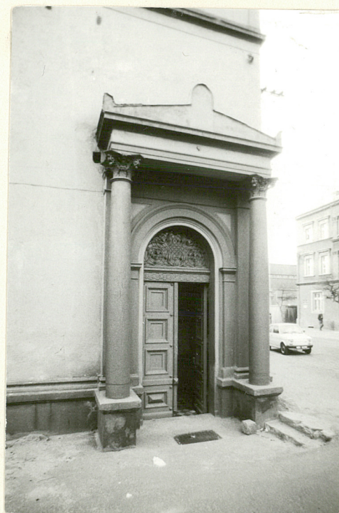
Pałacik Fitznera drzwi w elewacji pn.