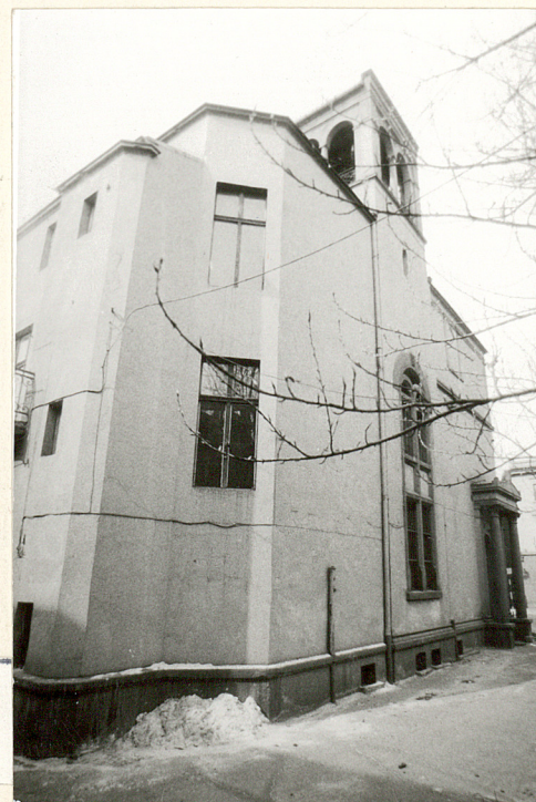
Pałacyk Fitznera elewacja pn. i naroże pn.wsch.