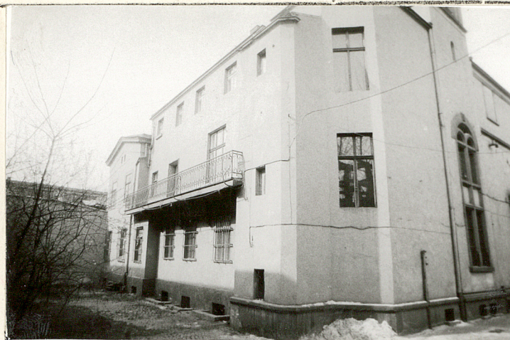
Pałacyk Fitznera od płn.-wschodu