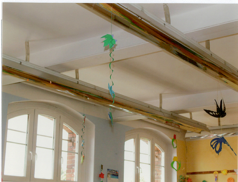
15. Fragment sklepienia płaskiego w sali lekcyjnej