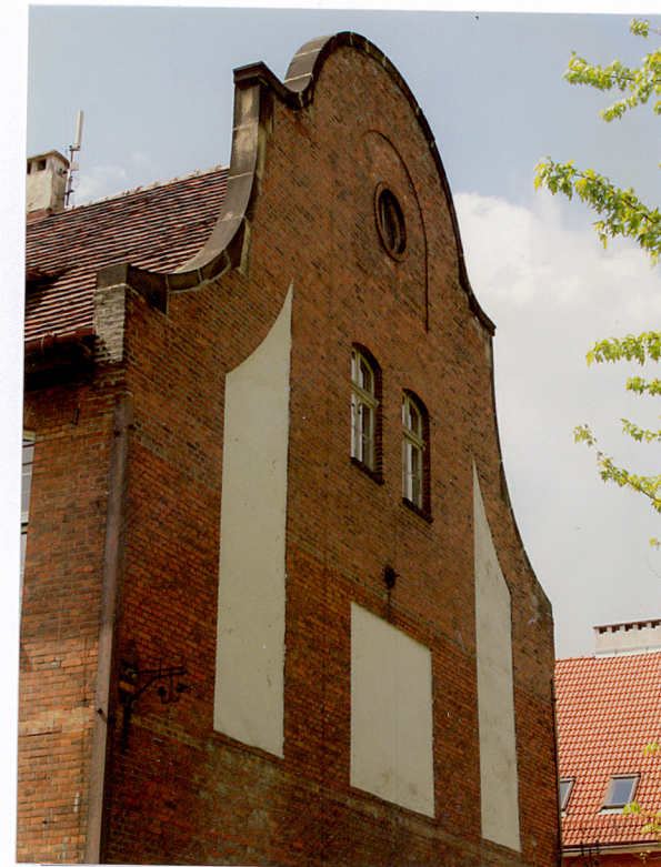
6. Ryzalit w elewacji bocznej - wschodniej