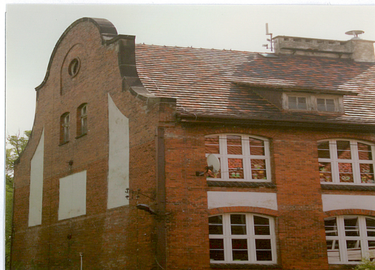
3. Elewacja boczna - wschodnia