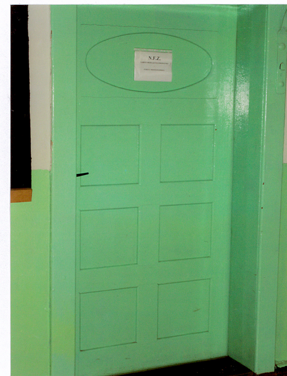
19. Główne drzwi wejściowe