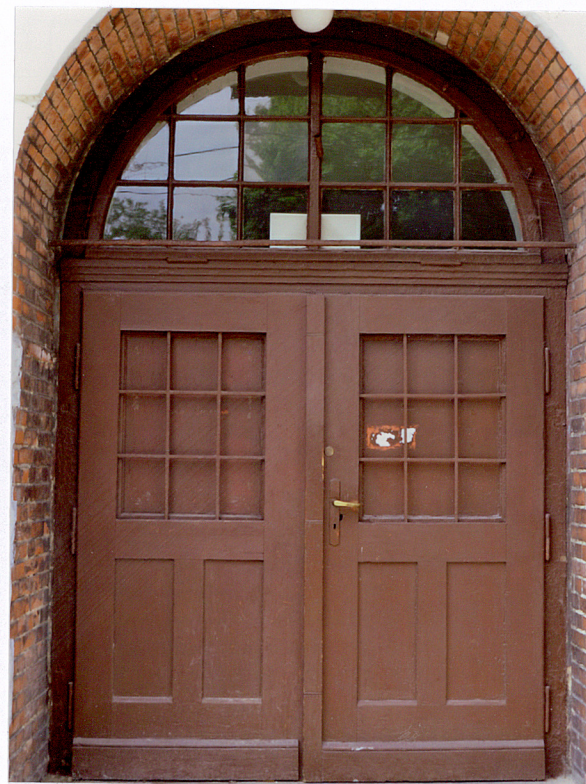
18. Drzwi główne w ryzalicie - elewacja frontowa