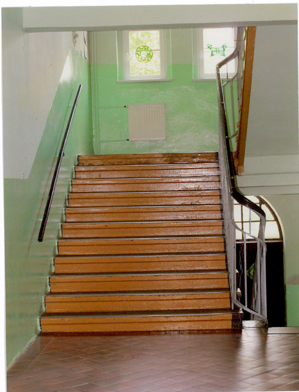
7. Hol, schody na parterze