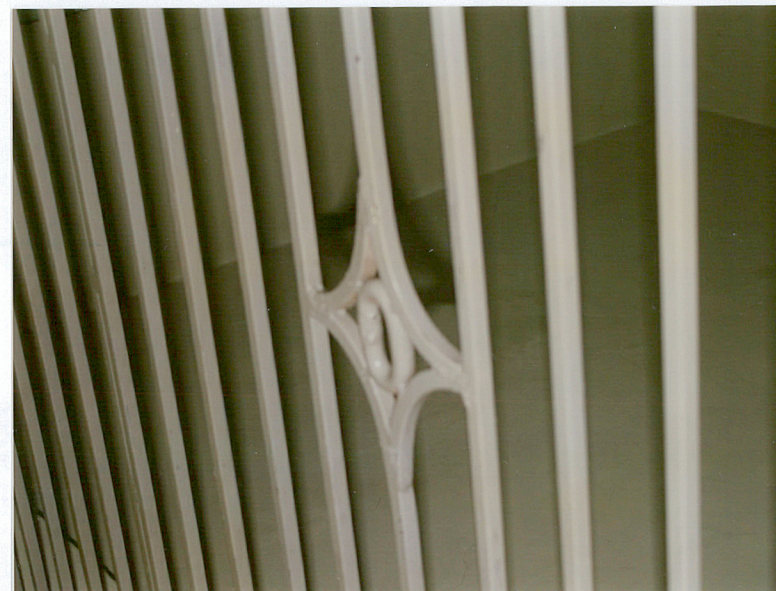
11. Ozdobne wykończenie balustrady