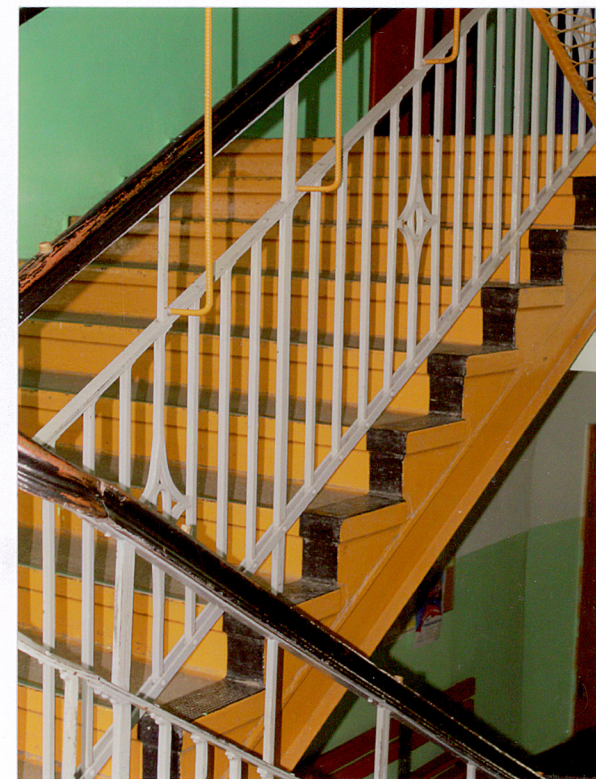
9. Hol, fragment balustrady schodów