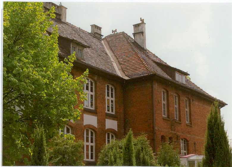
1. Elewacja tylna - zachodnia