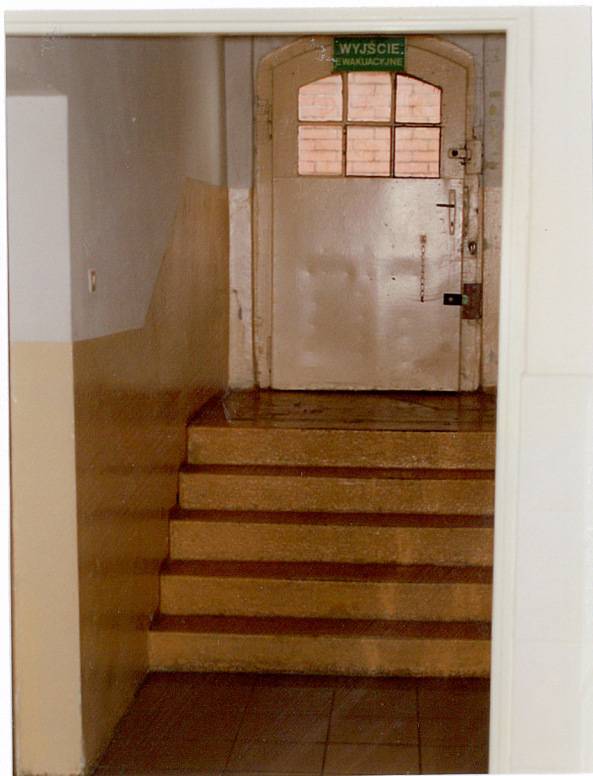
12. Drzwi wewnętrzne w elewacji zachodniej