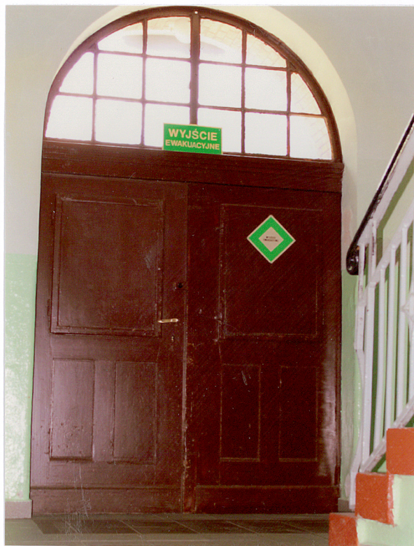
17. Drzwi wewnętrzne - wejściowe