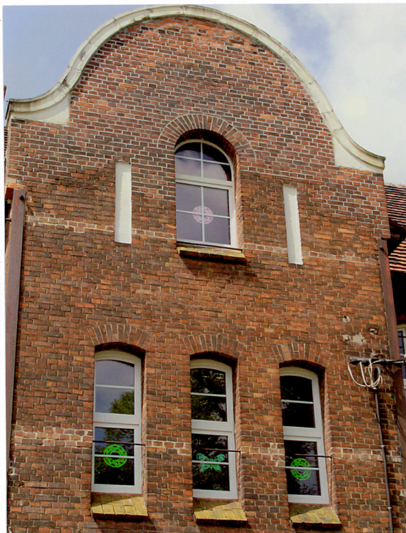
4. Okna w elewacji wschodniej, pierwsza kondygnacja - ryzalit