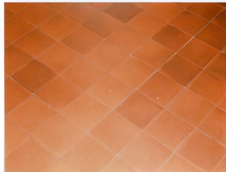
16. Fragment posadzki w korytarzu na parterze i pierwszej kondygnacji