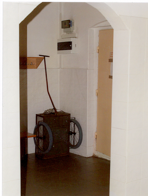
13. Fragment korytarza piwnicznego