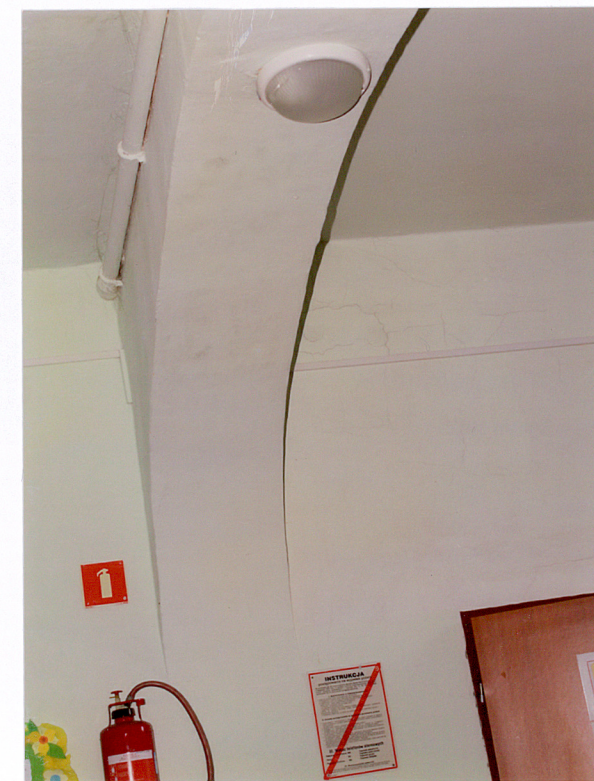
14. Fragment podciagu pierwszej kondygnacji