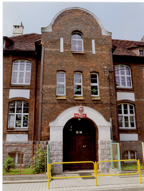
5. Elewacja frontowa - wejście główne - ryzalit