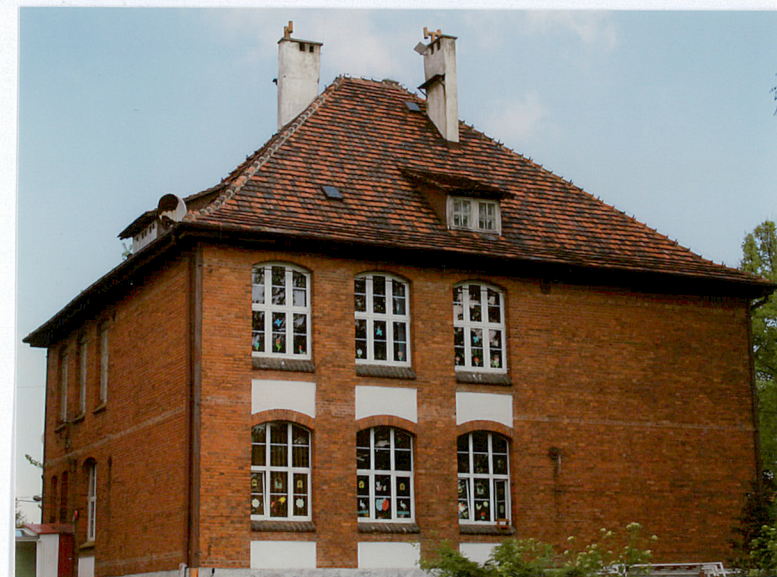
2. Elewacja boczna - północna