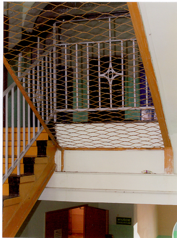
8. Hol, schody prowadzące na drugą kondygnację