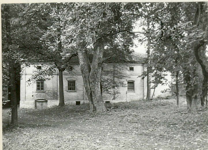
WÓZOWNIA, OBECNIE MAGAZYN - WIDOK OD STRONY PARKU