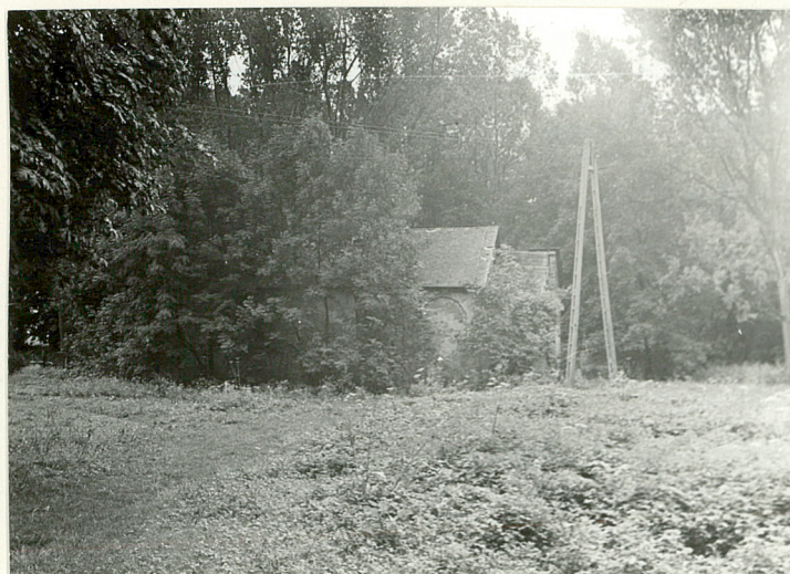
ZACHODNIA CZĘŚĆ PARKU Z PALMIARNIĄ - WIDOK OD STRONY PD.-ZACH.