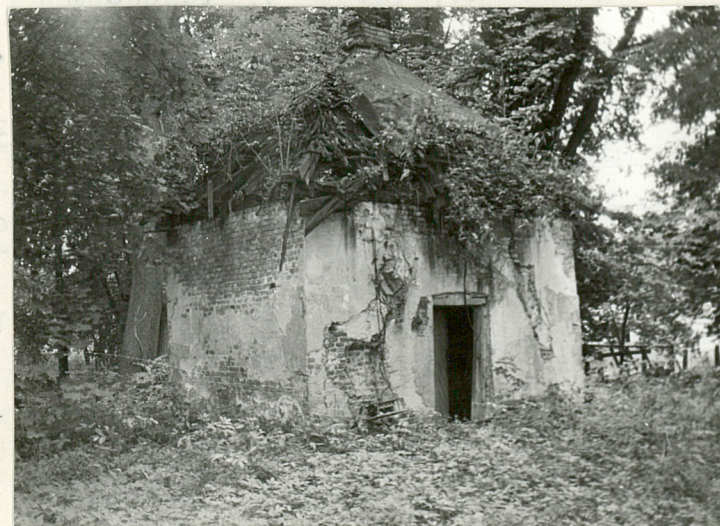
WĘDZARNIA - WIDOK OD PD.