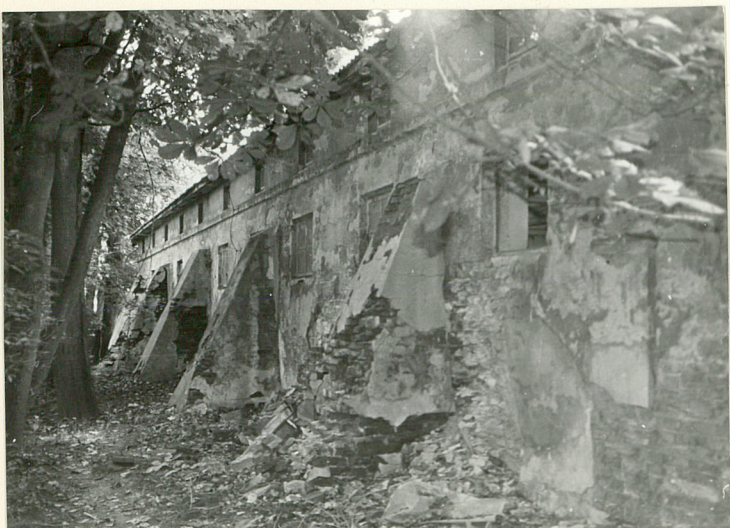
STAJNIA, OBECNIE JAŁOWNIK - WIDOK OD STRONY PD.-ZACH.