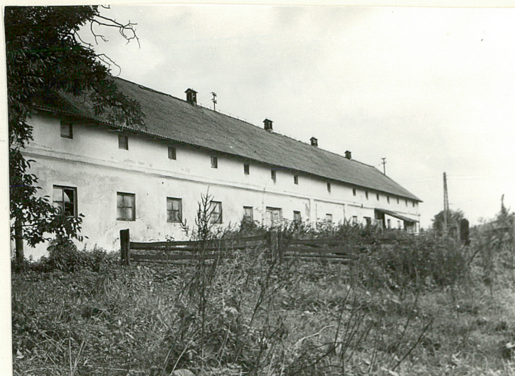
OWCZARNIA, OBECNIE OBORA - WIDOK OD STRONY DZIEDZIŃCA GOSPODARCZEGO