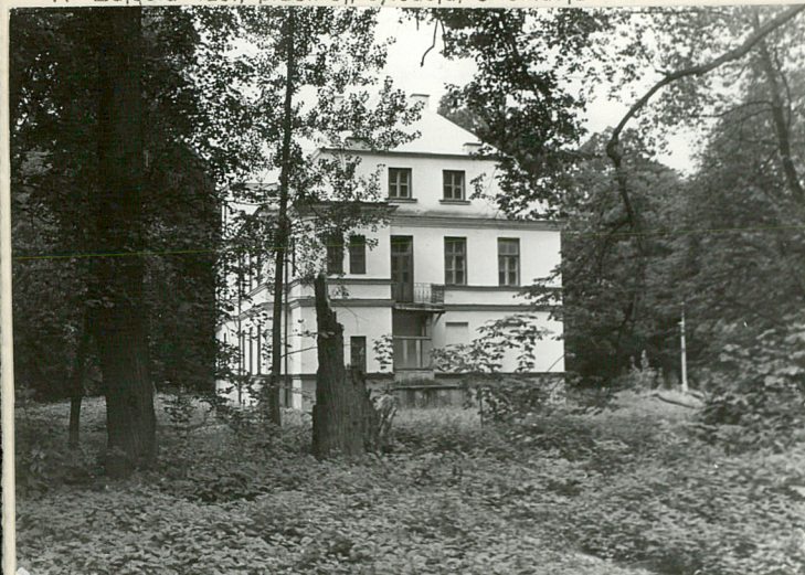
WIDOK NA PAŁAC OD STRONY WSCHODNIEJ

11. Zdjęcia: rzut, przekrój, sytuacja, orientacja