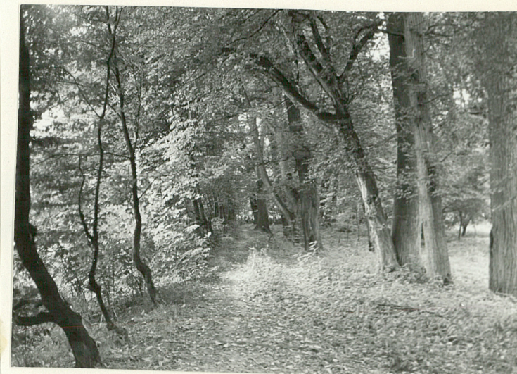
ALEJA WE WSCH. CZĘŚCI PARKU - WIDOK OD STRONY PD.-WSCH.