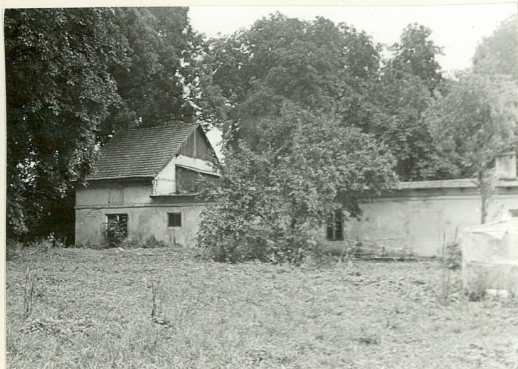
PRALNIA - WIDOK OD STRONY PD.-WSCH.

cd.pkt.12. Państwa i oddany w użytkowanie PGR. W latach 60-tych rozbudowano obiekty gospodarcze, zagęszczając znacznie założenie folwarczne. Stare budynki, zwłaszcza owczarnia, pozbawiono cech stylowych, niszcząc klasycystyczny portyk. W roku 1975 budynek pałacu uległ pożarowi, spłonął całkowicie dach. Od 1978 roku obiekt jest w remoncie.