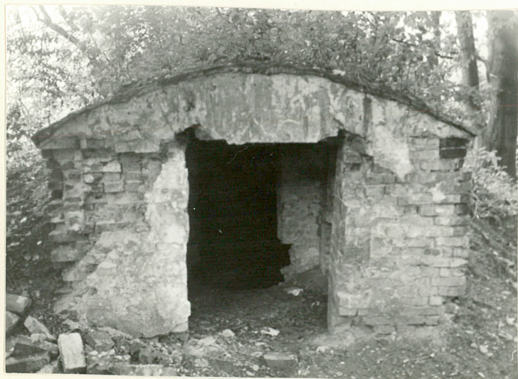
WIDOK NA PIWNICĘ