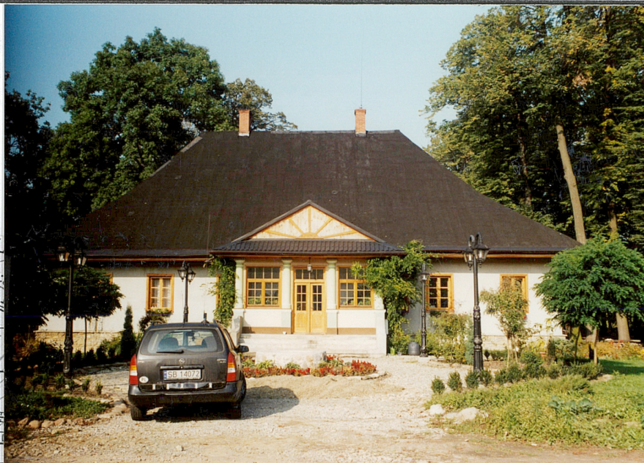
Widok frontowy dworu (od strony pd.)

11. Zdjęcia, rzut, przekrój, sytuacja, orientacja