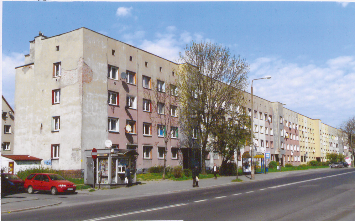
Widok ogólny od strony południowo-zachodniej.