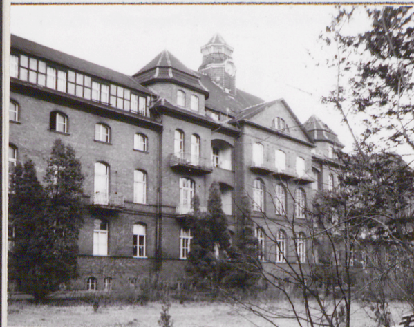
fragment elewacji południowej