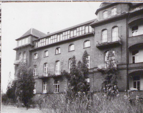
fragment elewacji południowej