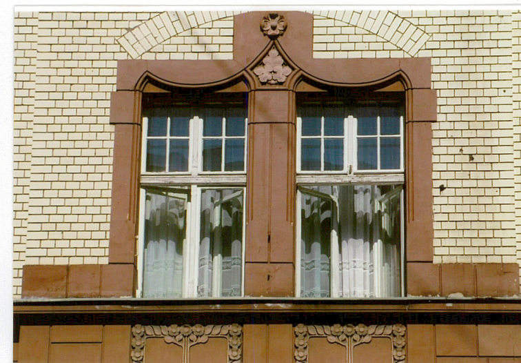
4. Okna 2 kondygnacji elewacji głównej ul. Ogrodowa 15, Racibórz.