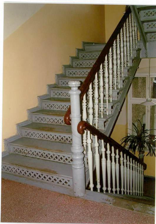
8. Wnętrze klatki schodowej ul. Ogrodowa 15, Racibórz.