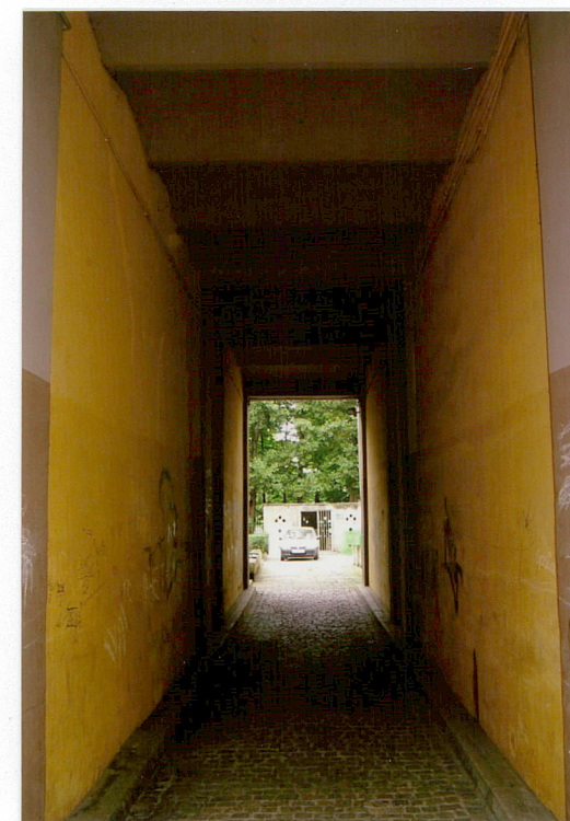
7. Wnętrze bramy przejazdowej ze sklepieniami Kleina, ul. Ogrodowa 15, Racibórz.