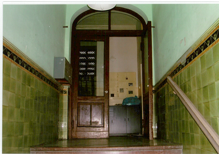
9. Wnętrze sieni, widok na drzwi wahadłowe ul. Ogrodowa 15, Racibórz.