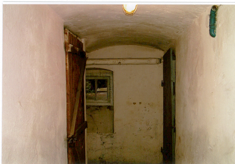
11. Wnętrze piwnic, ul. Ogrodowa 15, Racibórz.