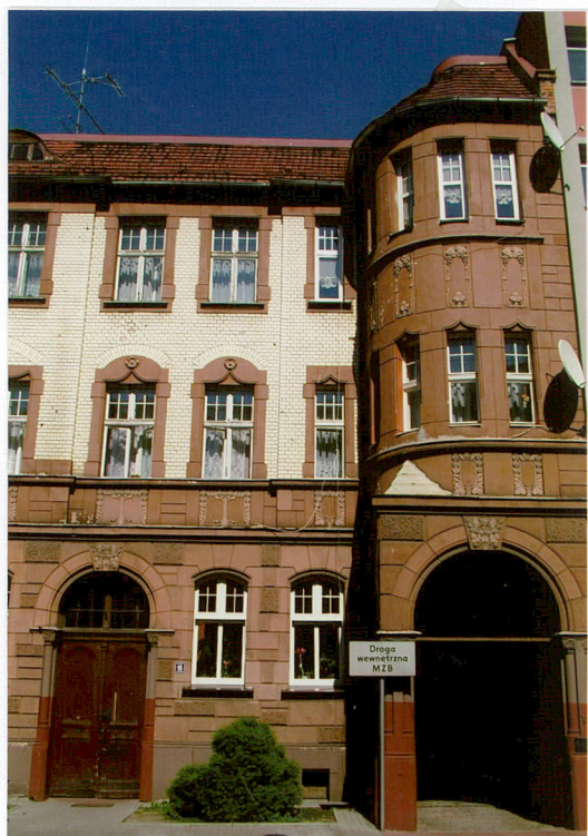
2. Fragment elewacji głównej północno - zachodniej, ul. Ogrodowa 15, Racibórz.