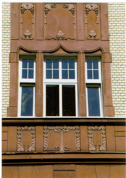
5. Okno 2 kondygnacji elewacji głównej ul. Ogrodowa 15, Racibórz.