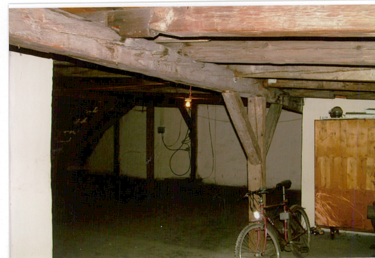
12. Wnętrze strychu, ul. Ogrodowa 15, Racibórz.