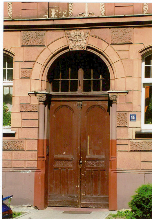
3. Drzwi główne płycinowo-ramowe ul. Ogrodowa 15, Racibórz.