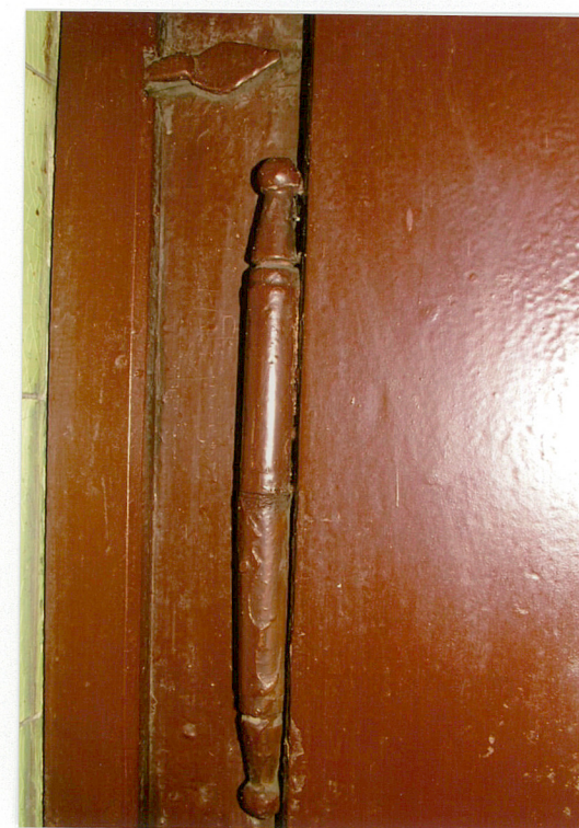
10. Zawias drzwi głównych ul. Ogrodowa 15, Racibórz.