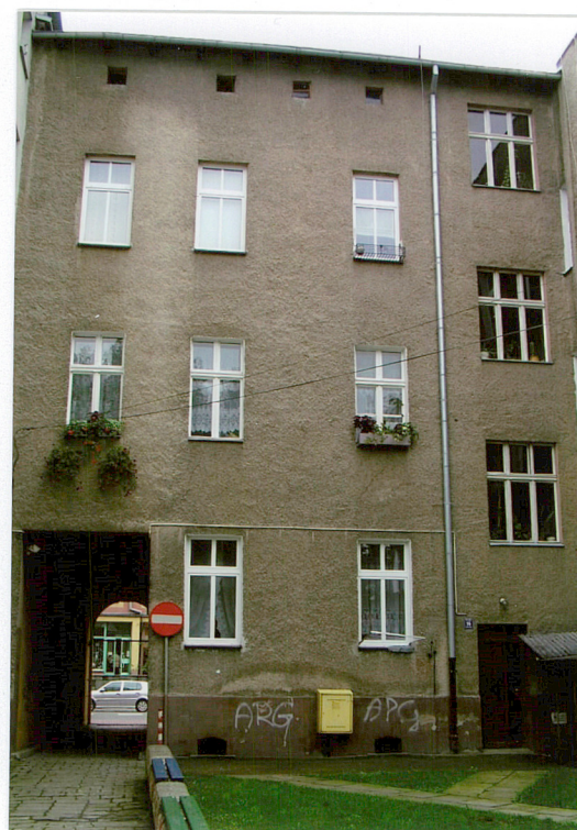
6. Elewacja tylna północno - wschodnia ul. Ogrodowa 15, Racibórz.