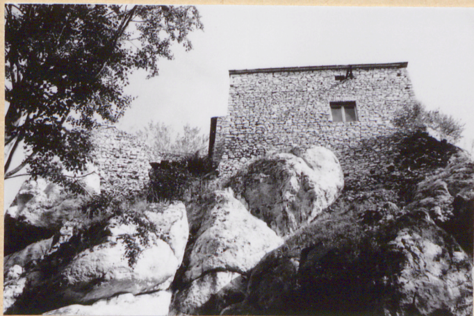
5. Widok od strony zach. (nadbudowana część).