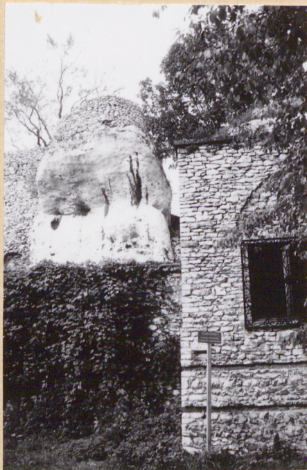
8. Fragment budynku od pd.-wsch. w głębi widoczny zarys baszty.