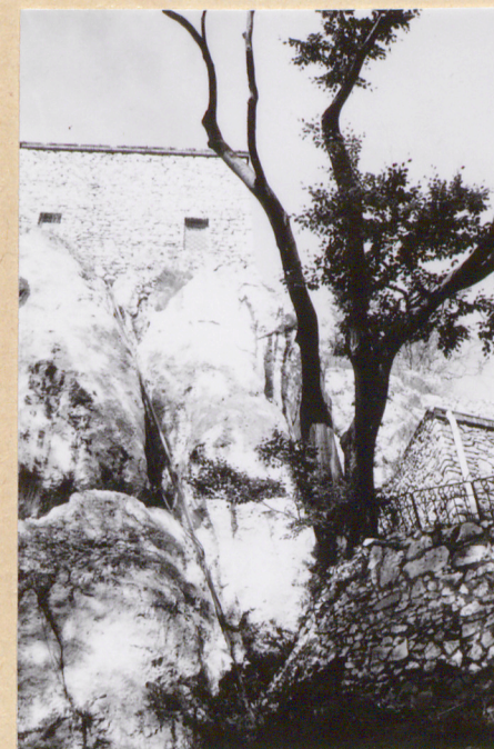
10. Zbocze skalne z dobudowanymi budynkami od zachodu.