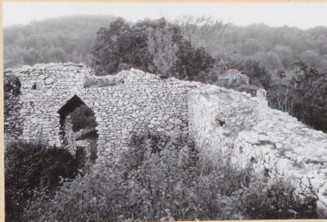
16. Widok z zach. naroża strażnicy.