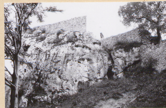
3. Pn.-wsch. część strażnicy - widok z podnóża skały z kierunku pn.