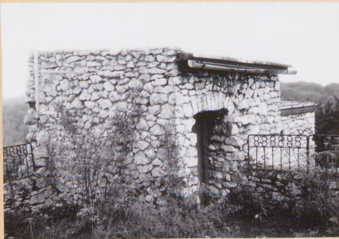
15. Wyjście na zamek górny. w pd.-zach. części założenia.