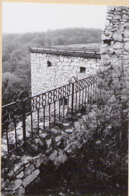
11. Fragment korony murów od pd. (w głębi budynek mieszkalny w pd.-zach. części zespołu).