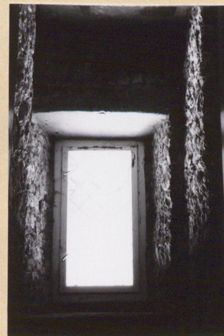
20. Okno w pawilonie pd.-zach.