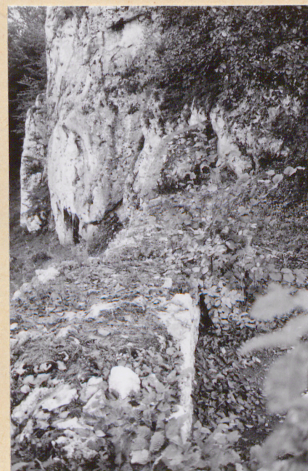
13. Obrys murów w części od pn.