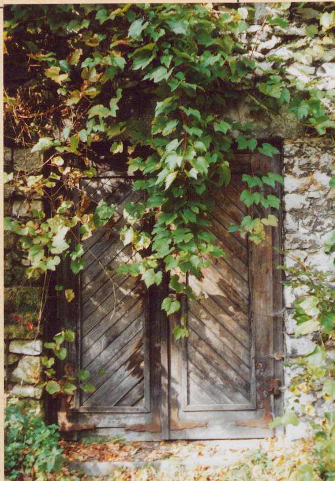
21. Jedne z drzwi w budynku jednokondyg. u podnóża wzgórza od strony pd.

Wkładkę założył : ..... mgr inż.arch. M.Herczyńska, 10. 2001 rok (imię, nazwisko, data,)