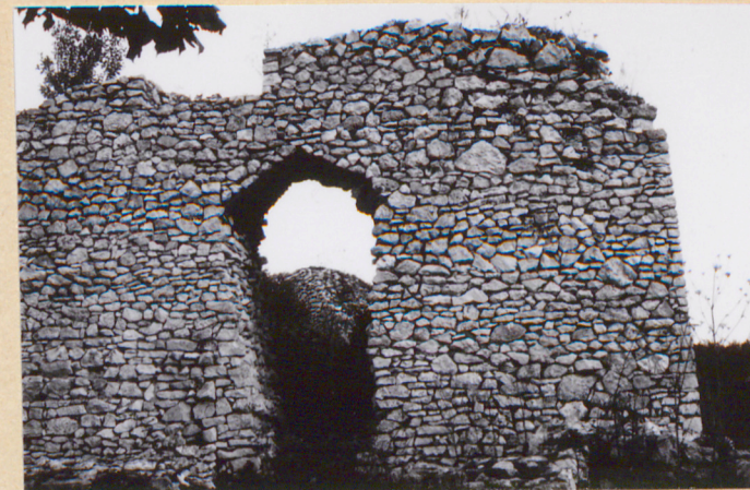
17. Zachowana ściana wewn. z pom w zach. części założenia.