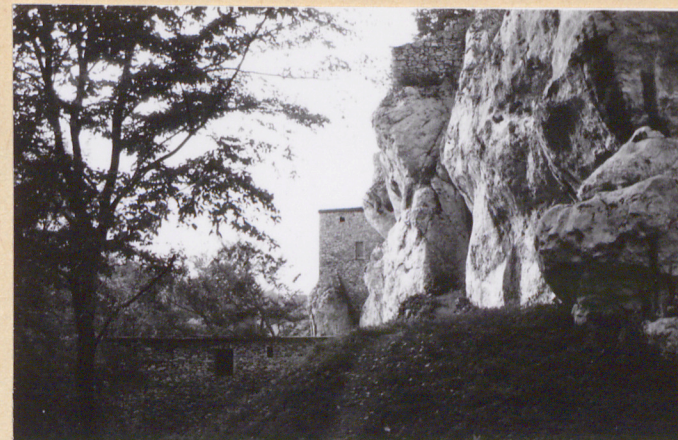
7. Podnóże wzgórza - z kierunku wschodniego.