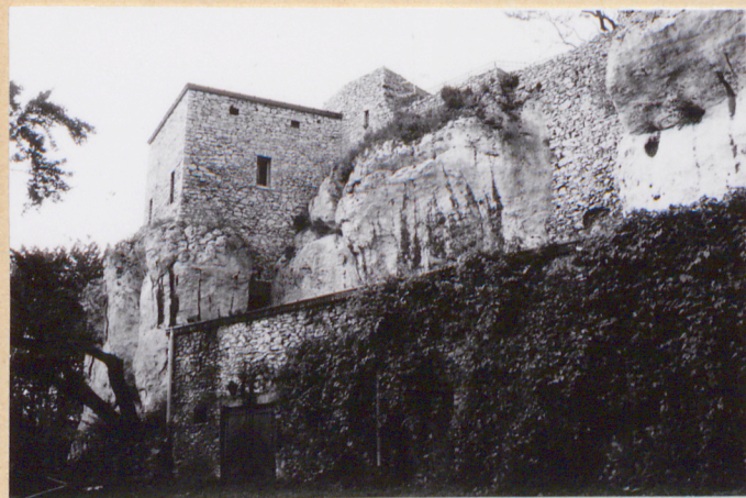
1. Widok na zamek z kierunku pd.