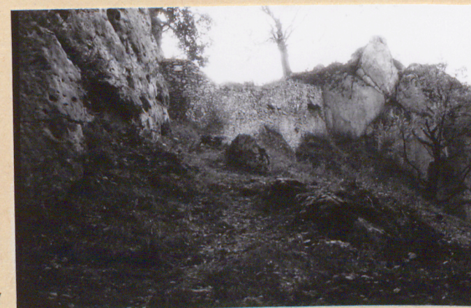
4. Obrys murów od strony północnej.

Wkładkę założył : mgr inż.arch. M.Herczyńska, 10. 2001 rok (imię, nazwisko, data,)