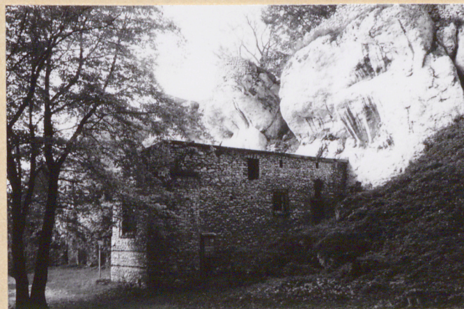
9. Pawilon mieszkalny w pd.-wsch. części założenia (jego fr. widoczny obok).