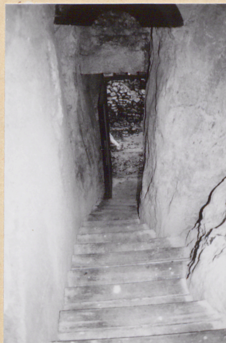
19. Schody wewnątrz pawilonu pd.-zach. (wejście na górny zamek).