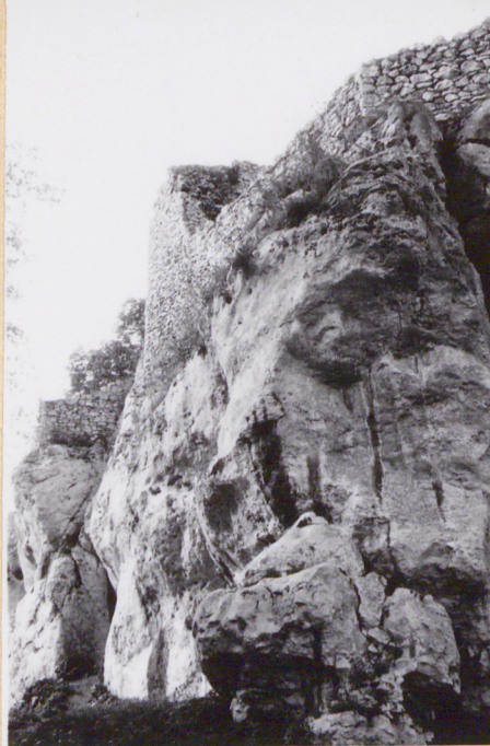
6. Widok z kierunku pd.-wsch. (fragment pd. murów).