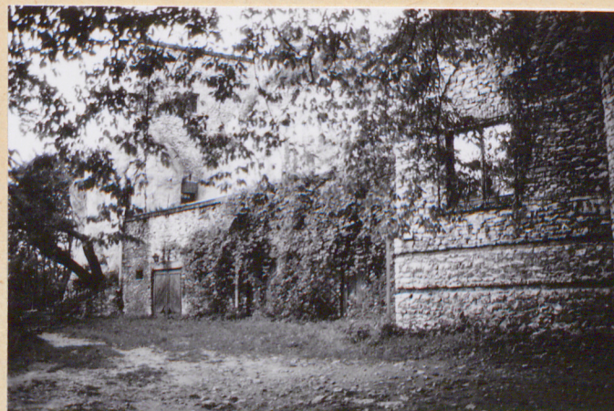
2. Podnóże wzgórza od pd. z dobudowanymi budynkami w latach 1929-33.