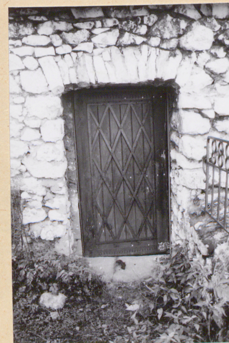
14. Drzwi wyjścia z pawilonu mieszkalnego na górny zamek

mgr inż.arch. M.Herczyńska, 10. 2001 rok