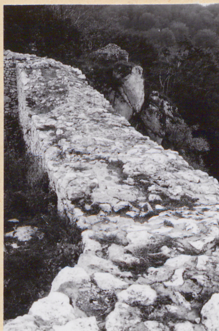
12. Obrys murów w środkowej części strażnicy od pd.