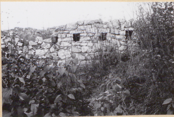
18. Otwory w ścianie pn. zachodniej części założenia.