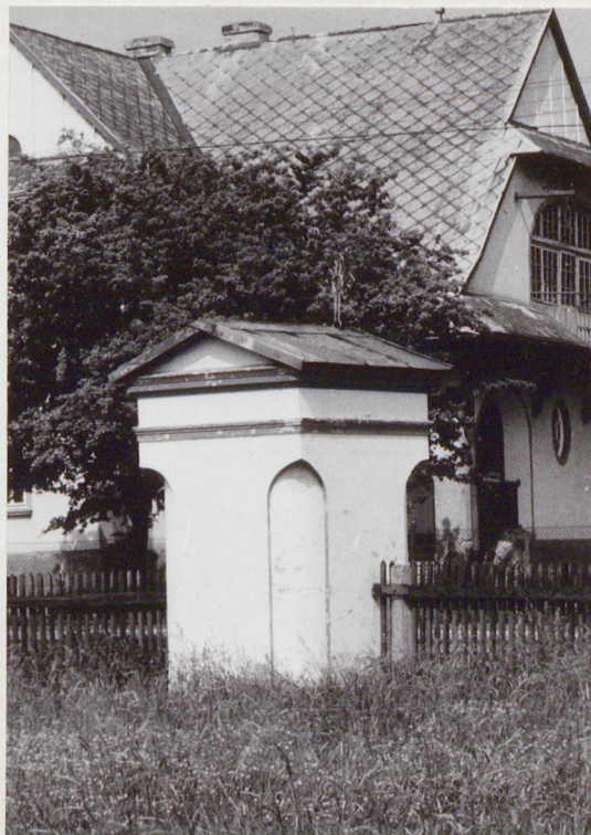
Widok od południowego-zachodu