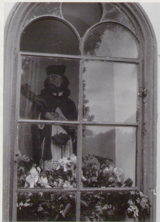
Wnętrze kapliczki z figurą św. Jana Nepomucena