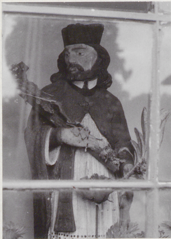
Figura św. Jana Nepomucena

Fotografia dodatkowa + plan sytuacyjny zespołu kościelno plebańskiego