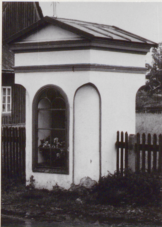
Widok od północnego-wschodu