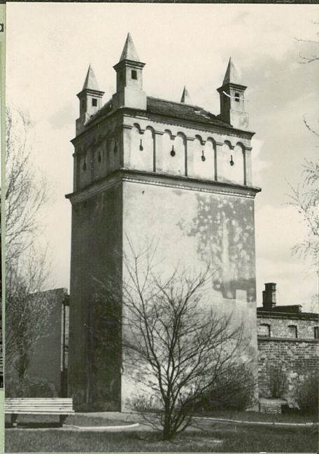
32. Przebieg prac konserwatorskich