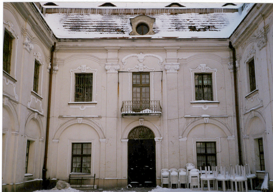
widok dziedzińca od str.pd