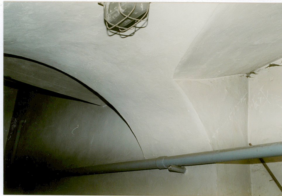
fragment sklepienia w piwnicy