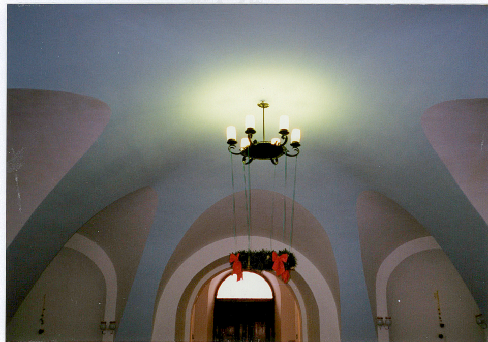
sklepienie sieni na parterze