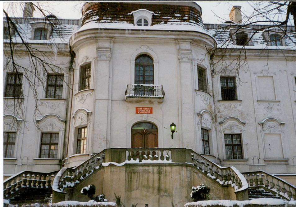
ryzalit elewacji frontowej