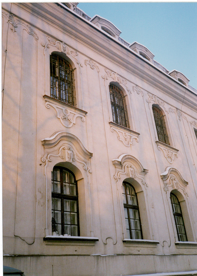
fragment elewacji wschodniej