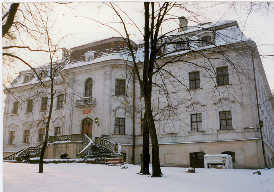
elewacja frontowa , północna