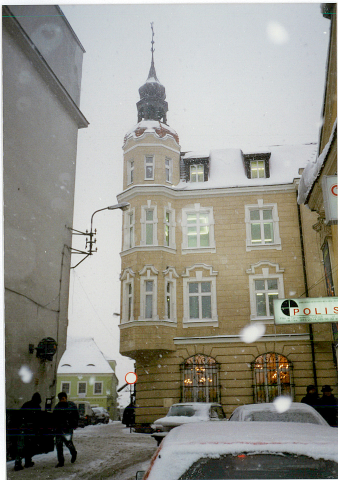
elewacja północna, część wsch.