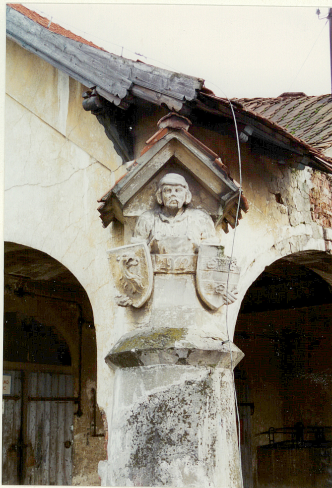
folwark - fragment dekoracji słupa narożnego kuźni