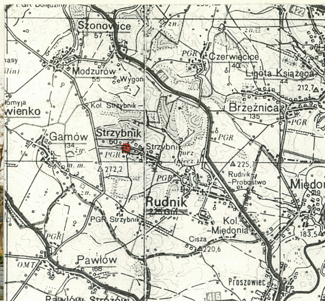
ORIENTACJA 1:100 000