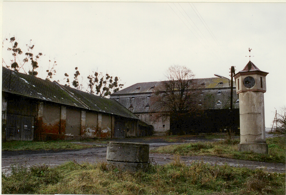
folwark - widok w kierunku spichlerza