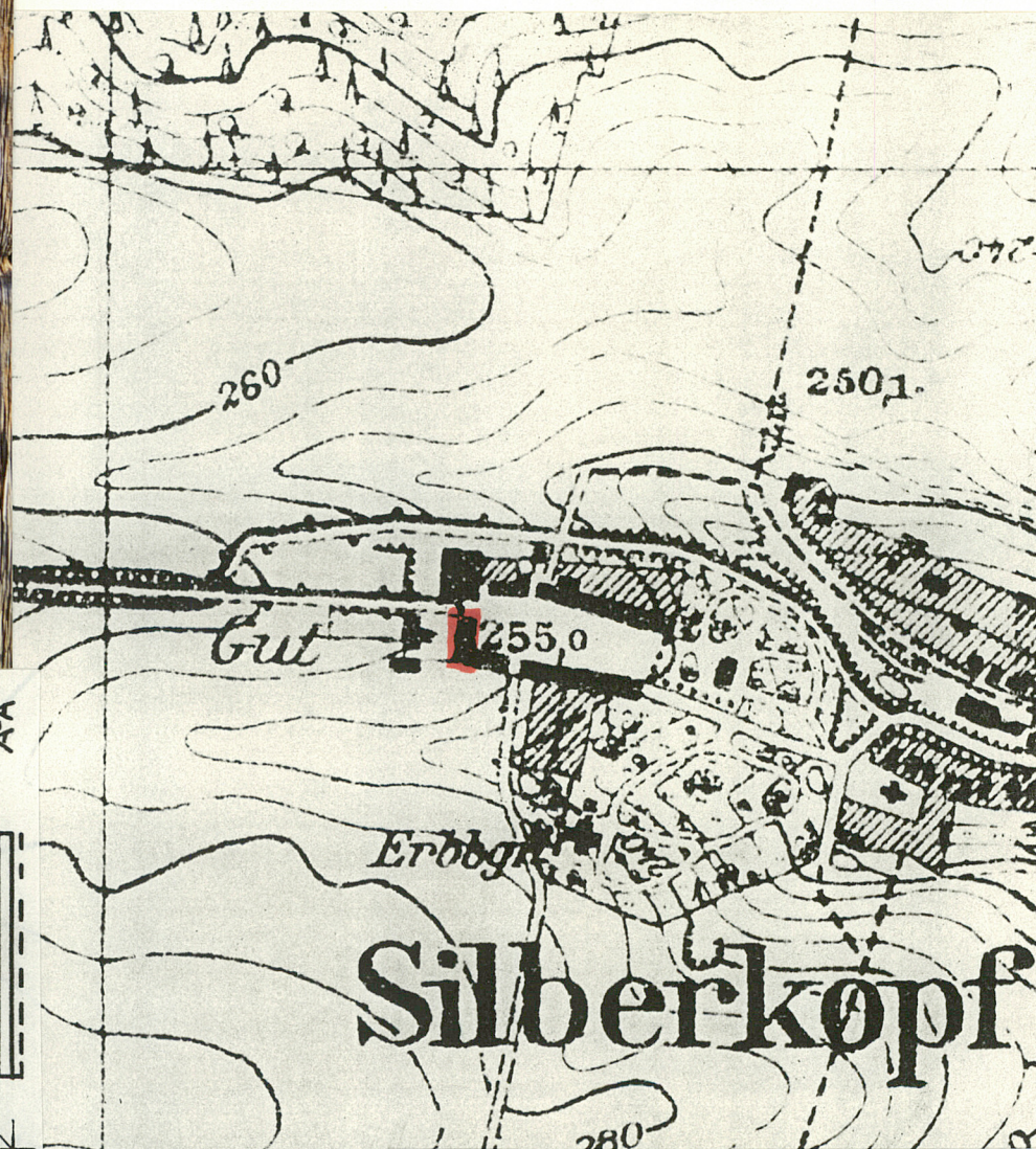
Pruska mapa topograficzna 1883r.