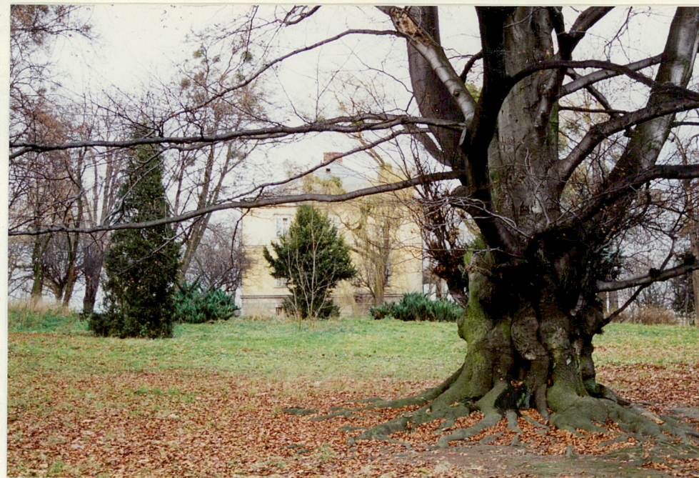
fragment parku pałacowego