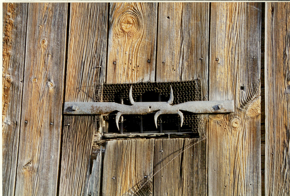
detal elewacji - okno