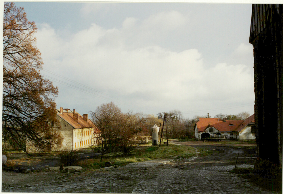
widok folwarku w kierunku wschodnim