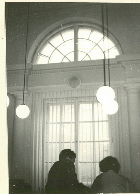
okno w hollu