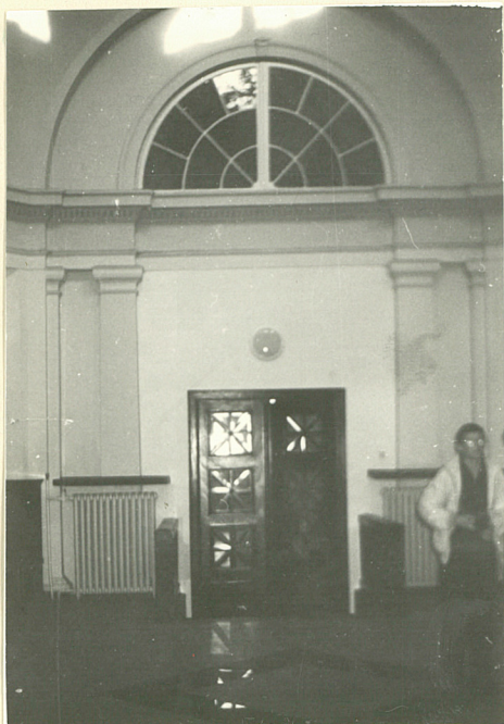
wejście do sali operacyjnej kasy