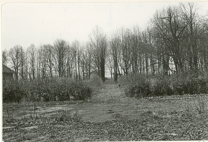
ALEJA WJAZDOWA DO PAŁACU - WSCH. CZĘŚĆ PARKU