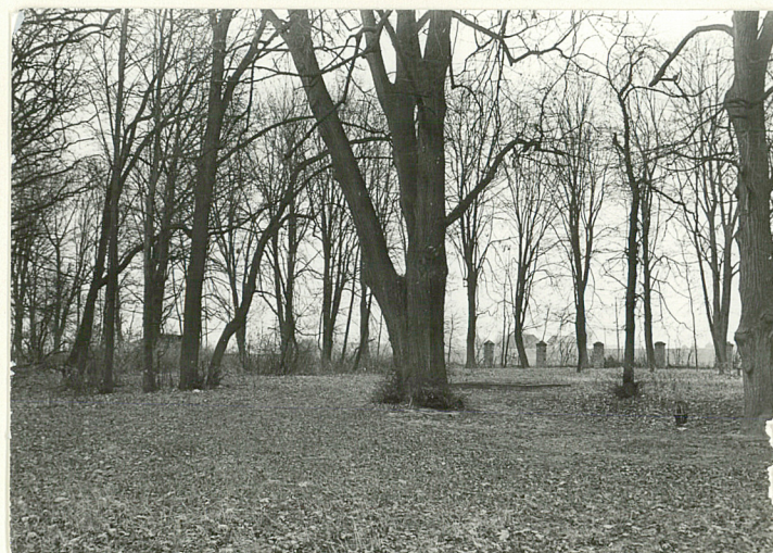
WIDOK NA WSCH. CZĘŚĆ PARKU OD STRONY POŁUDOCNEJ