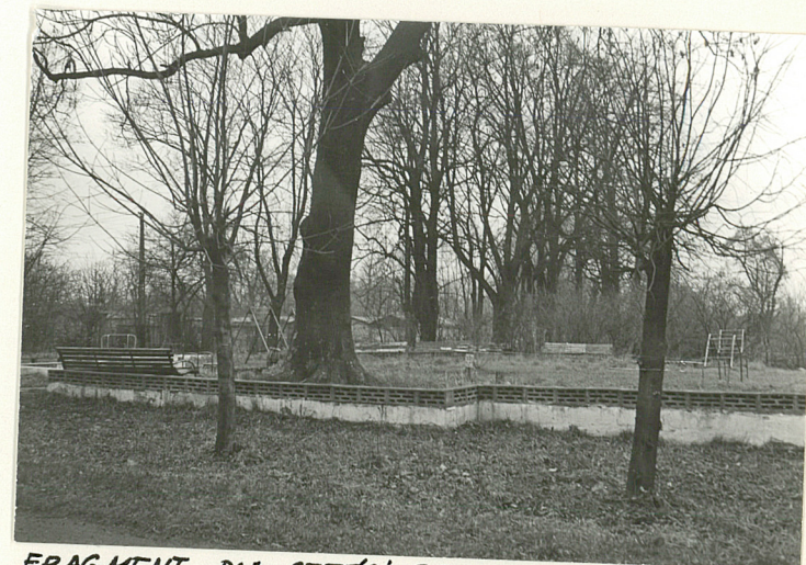
FRAGMENT PN. CZĘŚCI ZAŁOŻENIA Z WYDZIELONYM OGRÓDKIEM ZABAW DLA DZIECI

Wkładkę założył: ..... (imię, nazwisko, data)