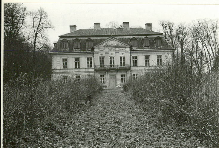
ELEWACJA FRONTOWA /WSCH./ PAŁACU

c.d.pkt.12 do remontu pałacu, ozdabiając go stiukami, boazeriami, wymieniono wówczas także stolarkę drzwiową wewnętrzną oraz przekomponowano park. Kolejna zmiana właścicieli miała miejsce prawdopodobnie na pocz. XIX wieku. Nakło i przyległe doń dobra znalazły się przejściowo w rękach rodziny Mohl, później Bukowskich, by w ok. 1911 roku ostatecznie utrzymali je najdłużej, bo aż do 1945 roku Komorowscy. Po zakończeniu II wojny światowej majątek upaństwowiono. Od 1945, po przebudowaniu pałacu, budynków gospodarczych /m.inn. spichlerza/ umieszczono tu Państwowy Dom Dziecka, który znajdował się do 1987 roku. Przez 45 lat oprócz prac zabezpieczających, nie przeprowadzono gruntownego remontu. W tym czasie wykonano basen oraz ogródek Jordanowski. Założenie dworskie stanowi jednolity barokowy układ stylistyczny. Zabudowania oprócz pałacu nie zachowały wyraźnych cech stylowych.