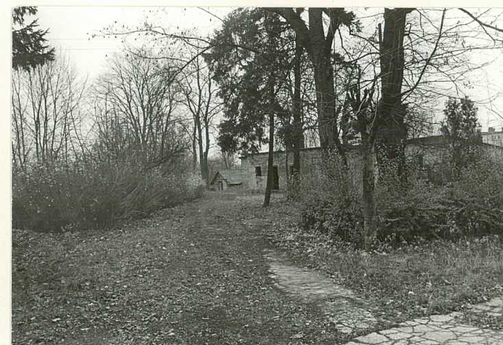
WIDOK SPÓD PAŁACU W KIERUNKU PN.-WSCH.

Wkładkę założył: ..... (imię, nazwisko, data)