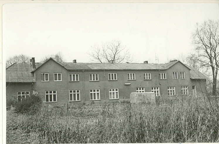
DAWNA OFICyna - ELEWACJA PD.