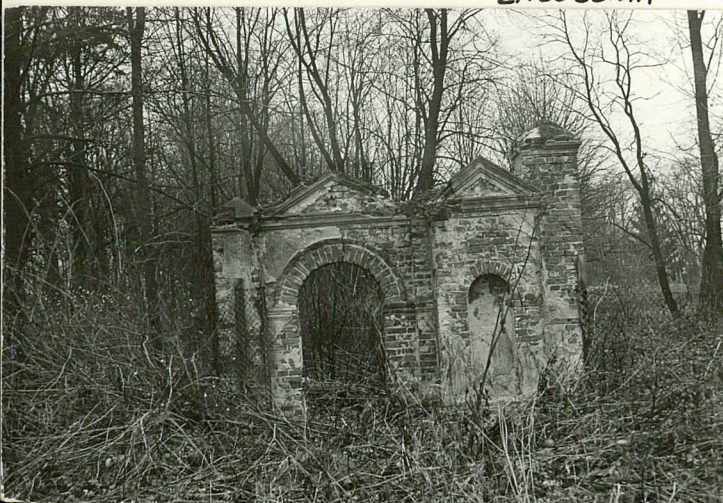
FRAGMENT GŁÓWNEJ BRAMY WJAZDOWEJ