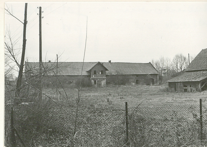
ZABUDOWANIA FOLWARCZNE - WIDOK O STRONY PD.