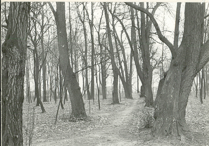
ALEJA W PD. CZĘŚCI PARKU