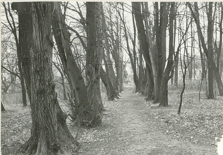
ALEJA WZDŁUŻ PN. GRANICY PARKU - WIDOK OD STRONY ZACH.