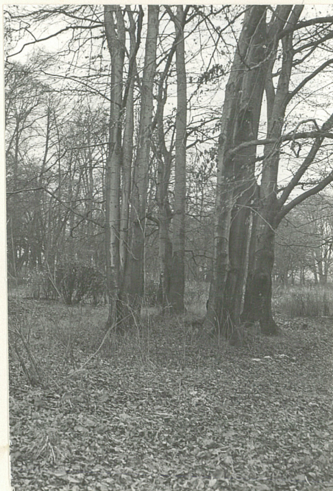
WNEȚRZE PARKOWE W PD.-WSCH. CZĘŚCI ZAŁOŻENIA