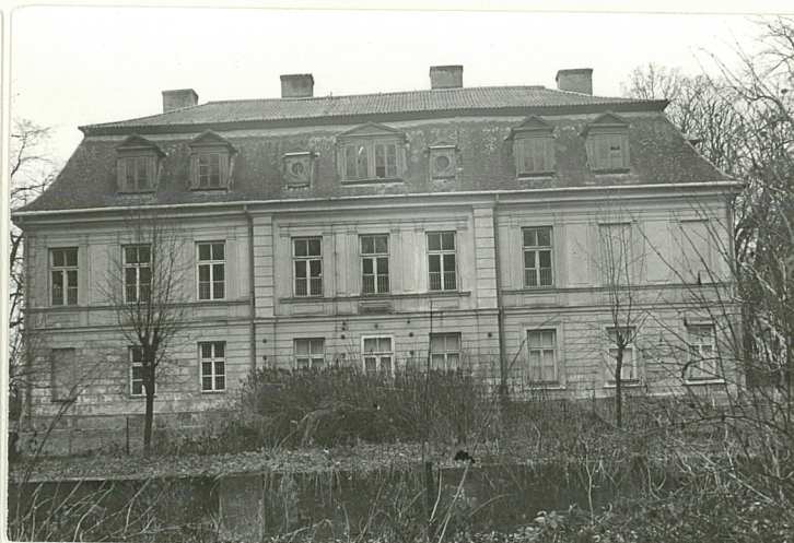
ZACH. ELEWACJA PAŁACU