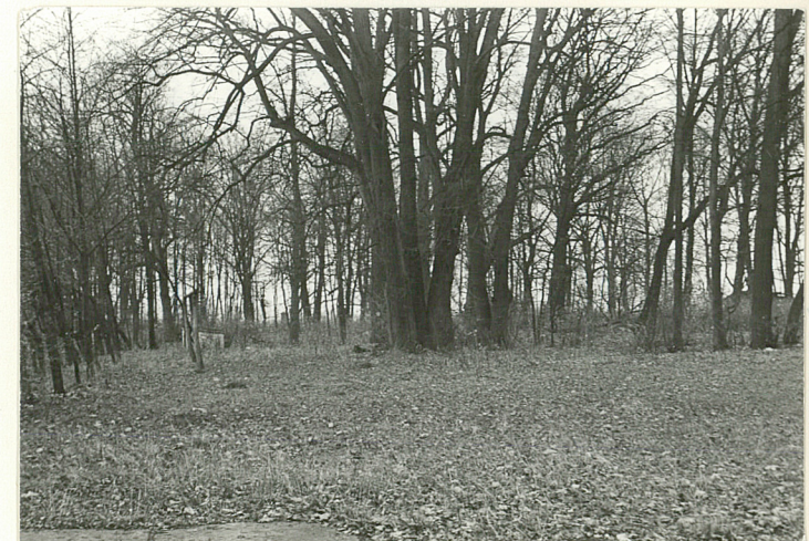
WIDOK NA PD. CZĘŚĆ PARKU SPÓD PAŁACU