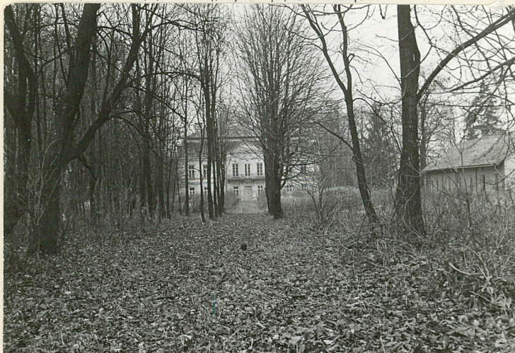
ALEJA PROWADZĄCA DO PAŁACU - WIDOK OD BRAMY WJAZDOWEJ (WSCH.)

11 Zdjęcia rzut, przekrój, sytuacja, orientacja