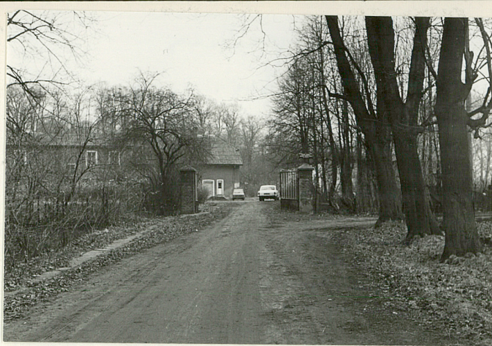
WJAZD GOSPODARCZY DO PAŁACU OD PN.