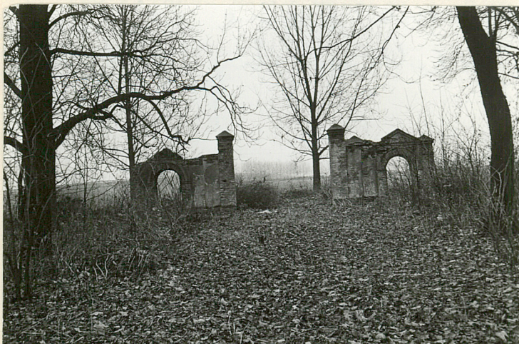
GŁÓWNA BRAMA WJAZDOWA - WSCH.