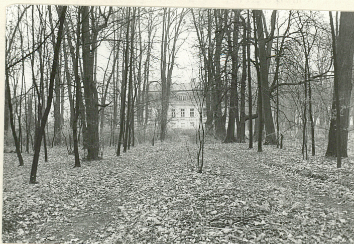
WIDOK PAŁACU OD STRONY ZACHODNIEJ, ALEJA W CENTRALNEJ CZĘŚCI PARKU