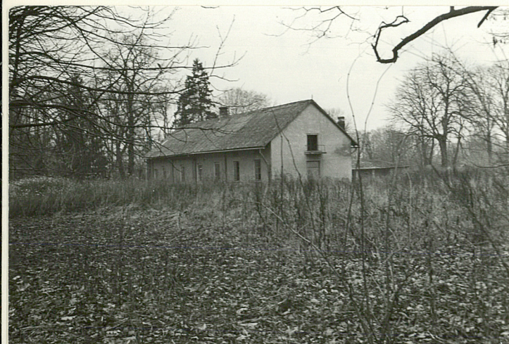
BUDYNEK GOSPODARCZY 12/-WSCH. CZĘŚĆ ZAŁOŻENIA