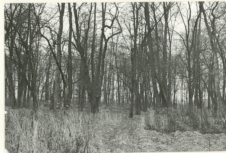
WNEȚRZE PARKU - CZĘŚĆ PD.