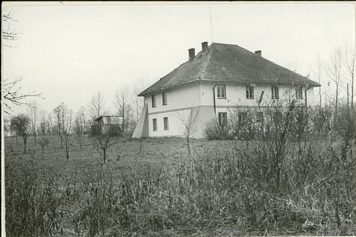
SPICHLERZ - WIDOK OD STRONY PD.-WSCH.