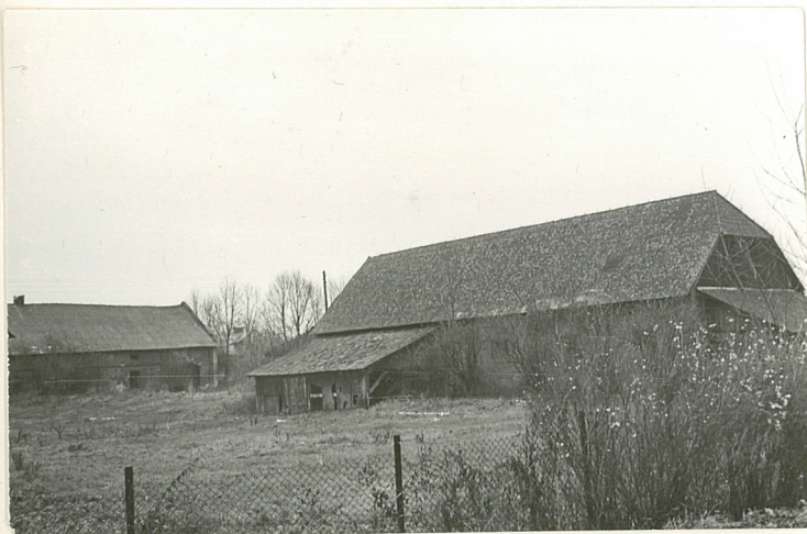
ZABUDOWANIA GOSPODARCZE - WIDOK OD STRONY PD.-ZACH.