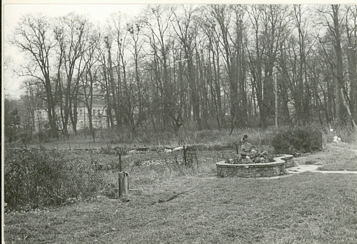
WIDOK NA PARK OD POŁNOCY