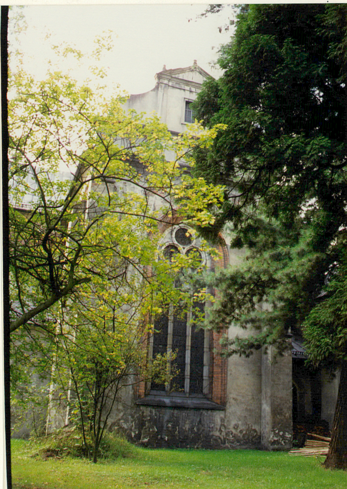
prezbiterium, elewacja wsch.