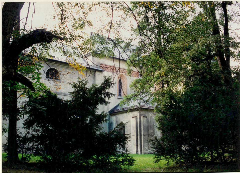
transept pd., elewacja wsch.