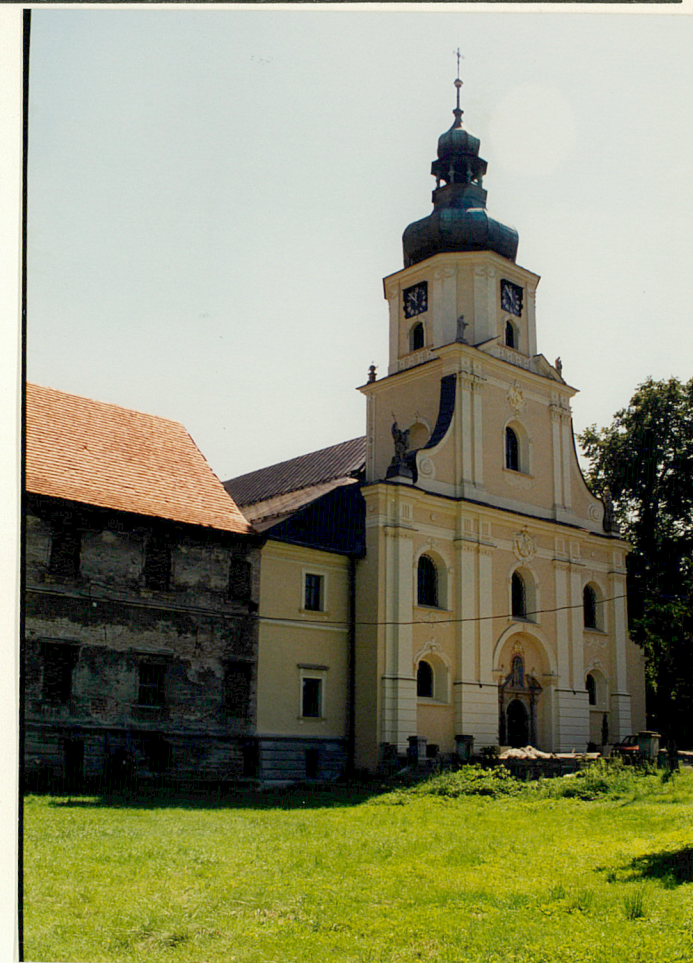
fasada zach. i fragment elewacji pałacowej