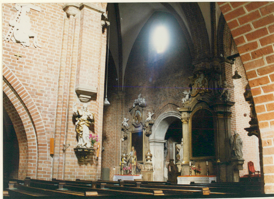
wnętrze, pn. skrzydło transeptu