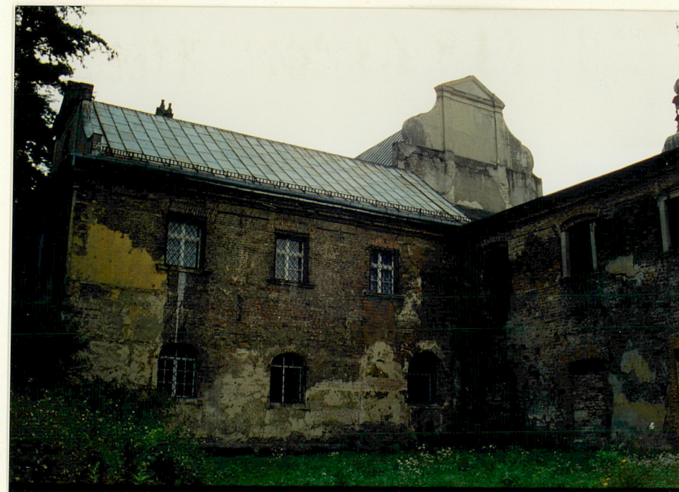
biblioteka, elewacja pn. i pn. szczyt transeptu