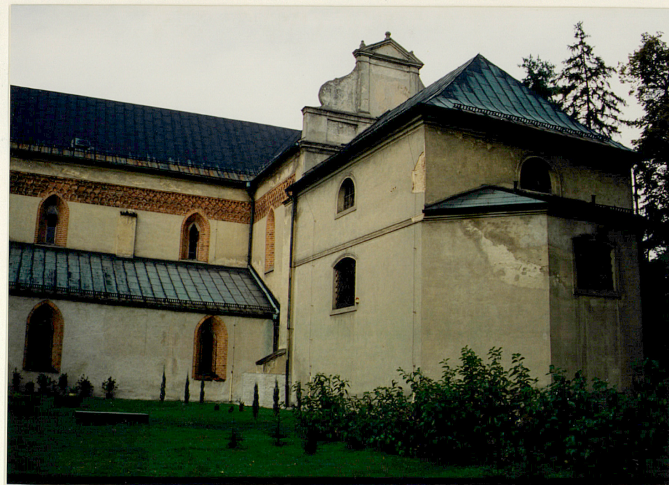
nawa boczna, pd. i kaplica Mariacka