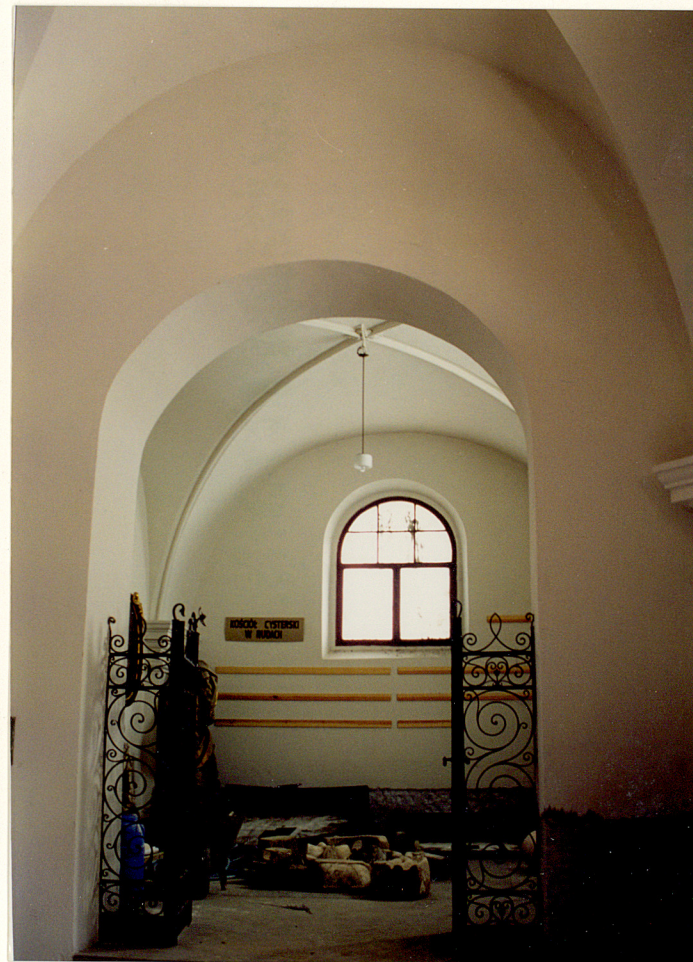
kruchta pod wieżą, cz. pd.