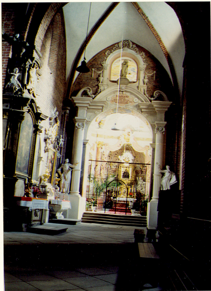
transept pd. i kaplica Mariacka,