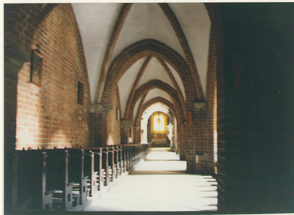
wnętrze, pn. nawa boczna

Wkładkę założył: Dorota Głazek (imię, nazwisko, data)