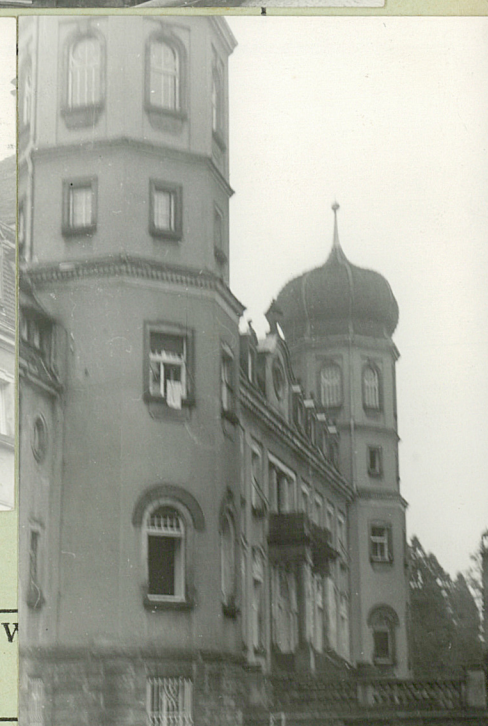
35. Uwagi różne

Bibliografia: Katalog Zabytków Sztuki w Polsce pow. Tarnowskie Góry 1957 r. Kloss E. Rode H. Bau und Kunstden- mäler des Kreises Tost Gleiwitz Breslau 1943 s.63