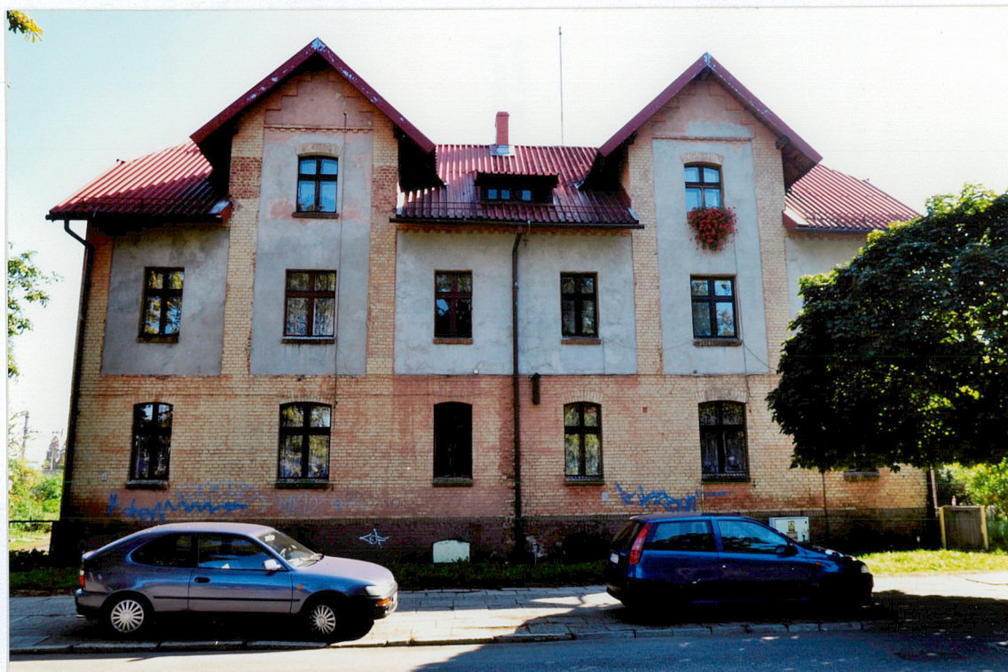
Budynek, widok od strony zachodniej