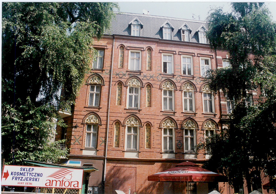
4. Elewacja od ulicy Aleja Przyjaźni.