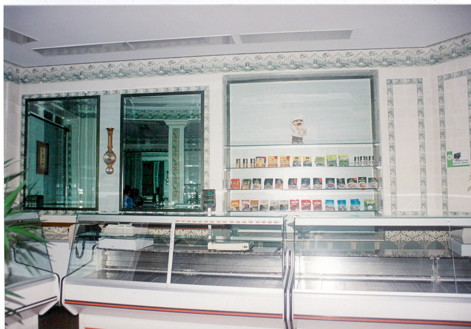
31, 32, 33 Wnętrze sklepu mięsnego na parterze.