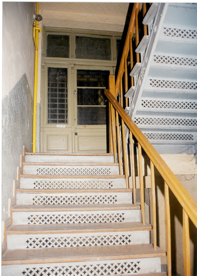
25. Klatka schodowa w części obiektu przy Zwycięstwa 38.

3. Zawartość wkładki Dokumentacja fotograficzna