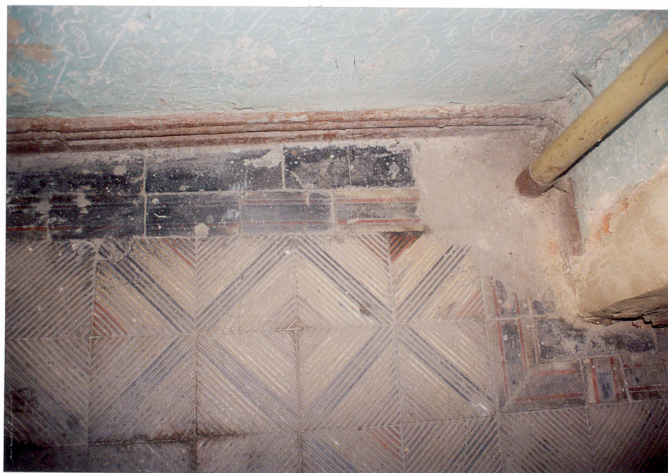
24. Zachowany fragment posadzki w klatce schodowej.