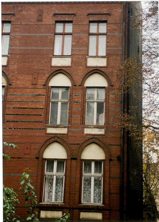
14. Fragment elewacji od Alei Przyjaźni.

3. Zawartość wkładki Dokumentacja fotograficzna