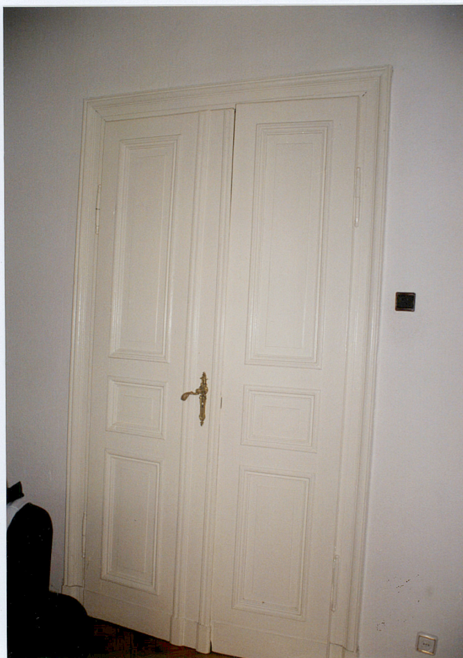
29. Przykład stolarki drzwiowej w mieszkaniach. (Zwycięstwa 38)