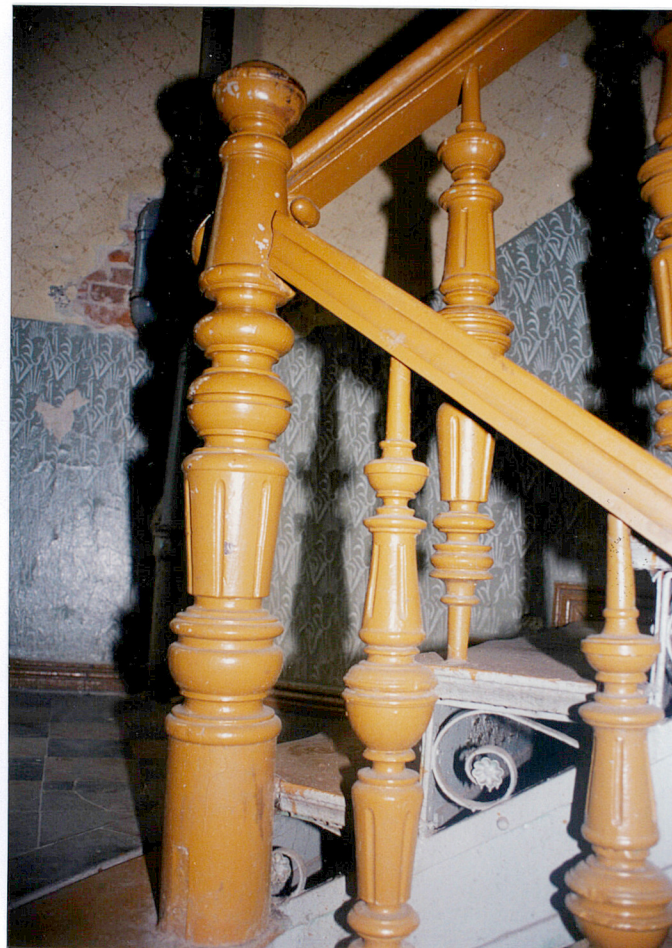
26. Fragment balustrady schodów w części obiektu przy Zwycięstwa 38.