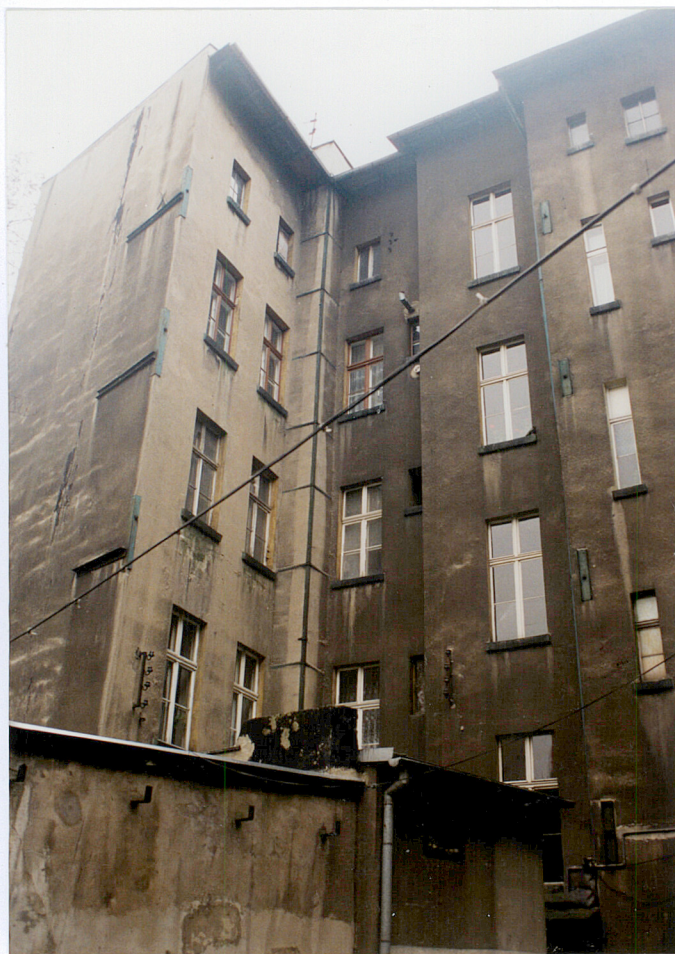
17. Widok od podwórza w stronę południowo-wschodnią.