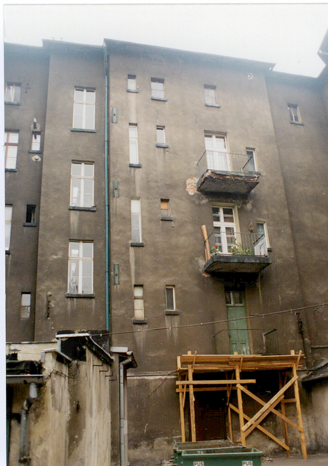
18. Widok od podwórza w stronę południową.