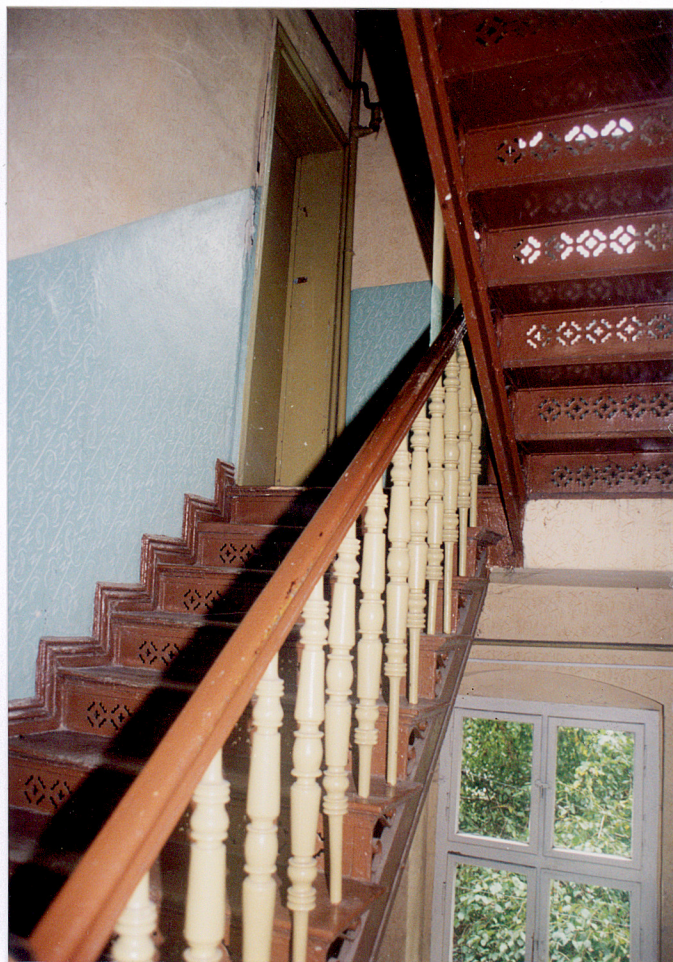
22.23 Klatka schodowa w części obiektu przy Alei Przyjaźni 11.