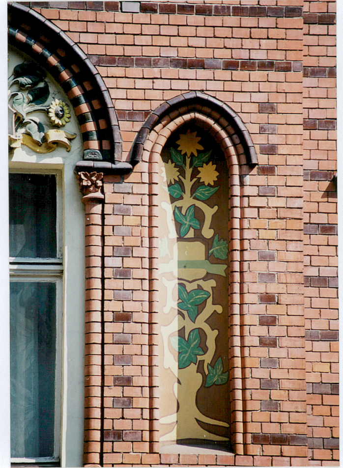
13. Fragment dekoracji elewacji.