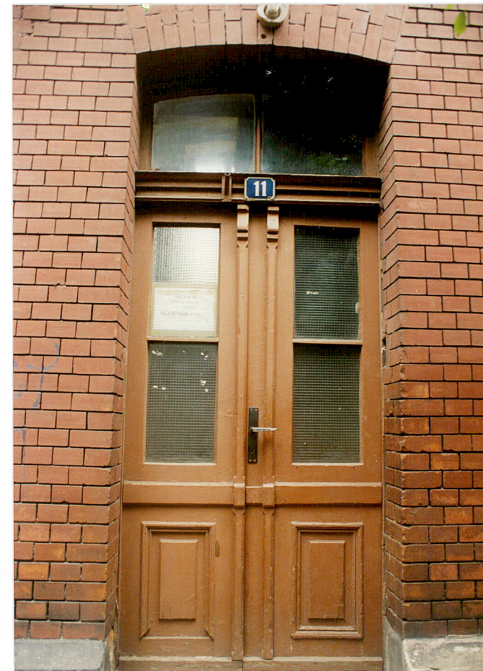
16. Drzwi wejściowe od Alei Przyjaźni do części mieszkalnej.