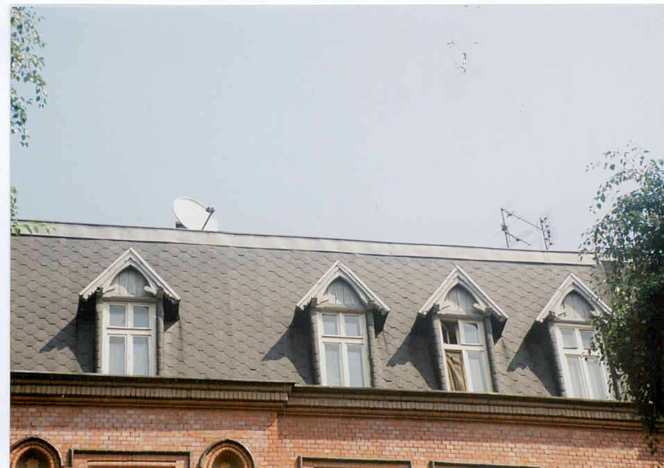
7. Fragment połaci dachowej.