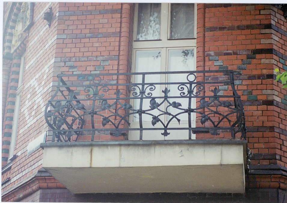
6. Balustrada balkonu.