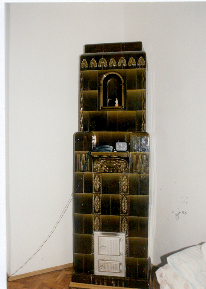
30. Zachowany piec kaflowy. (IV kondygnacja – Zwycięstwa 38).