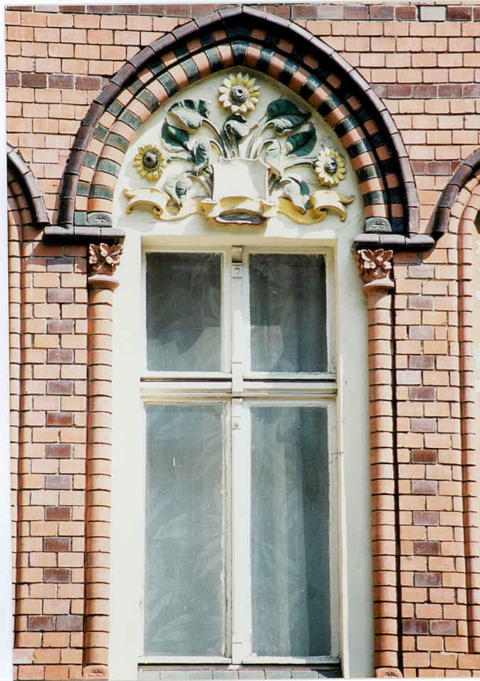
12. Dekoracja okienna.