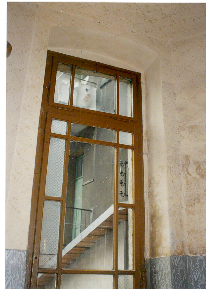
27. Okno klatki schodowej w części obiektu przy Zwycięstwa 38.