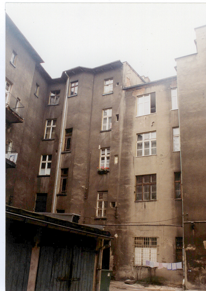
19. Widok od podwórza w stronę północno-zachodnią.