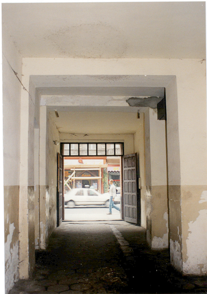
20. Przejazd bramny od ulicy Zwycięstwa.

3. Zawartość wkładki Dokumentacja fotograficzna