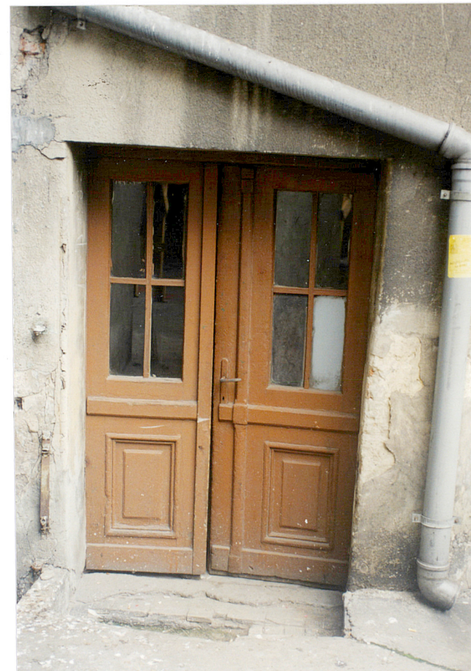
21. Wejście od podwórza do części przy Alei Przyjaźni 11.