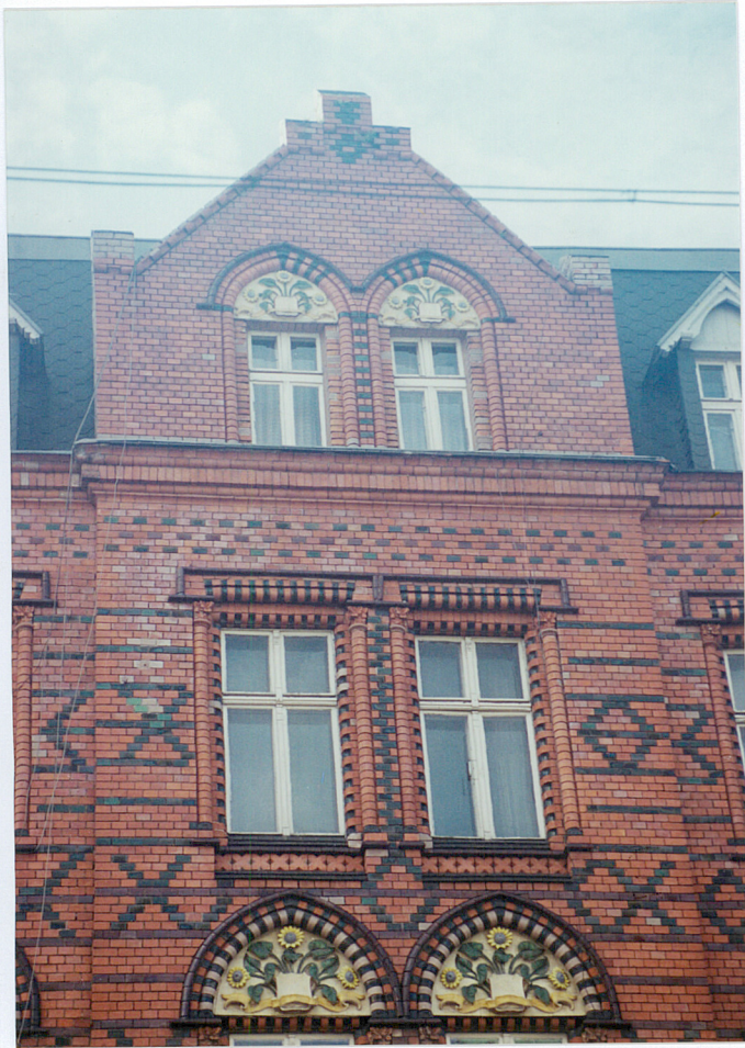
11. Pseudoryzalit w elewacji od ulicy Zwycięstwa.