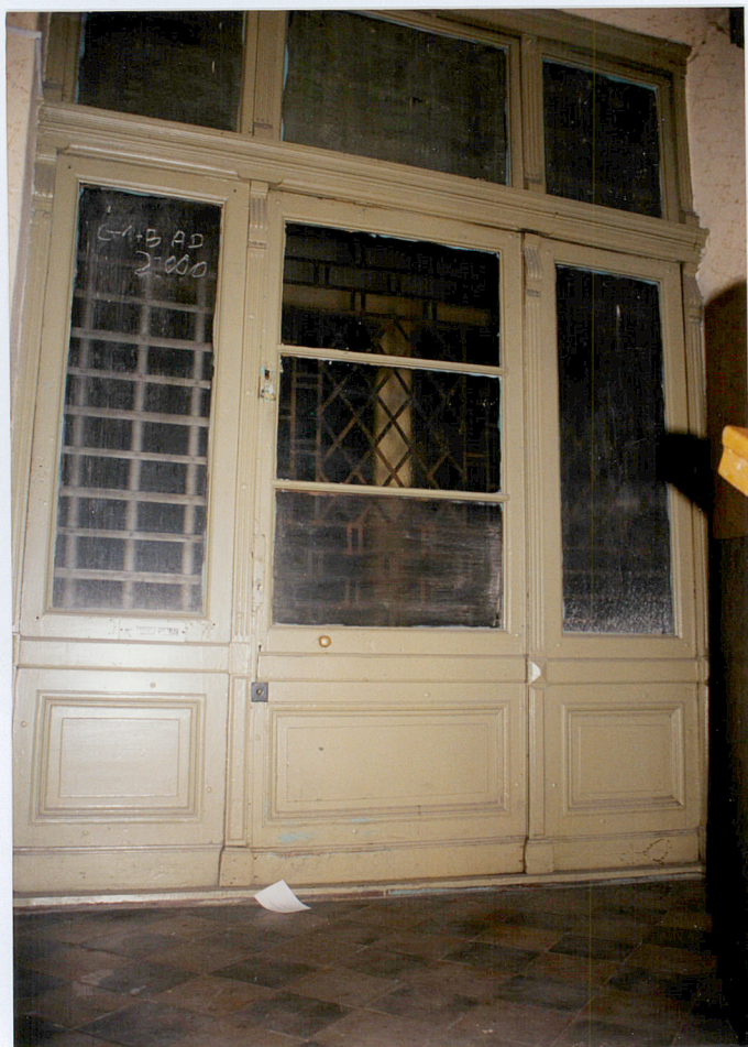
28. Zachowana stolarka drzwiowa do mieszkania na piętrze (Zwycięstwa 38)