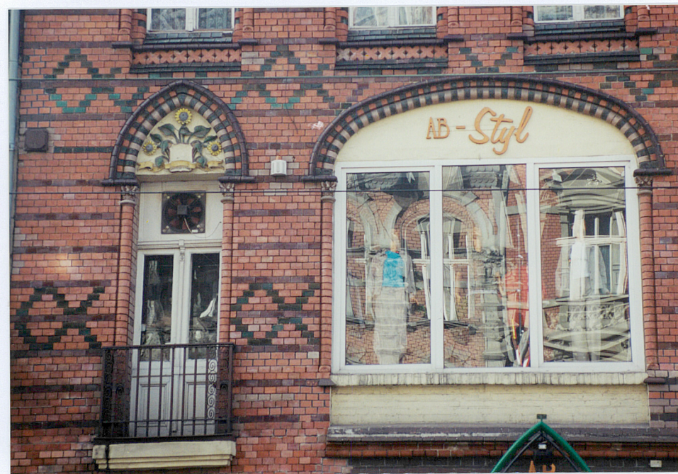
5. Fragment elewacji od ulicy Zwycięstwa – I piętro.