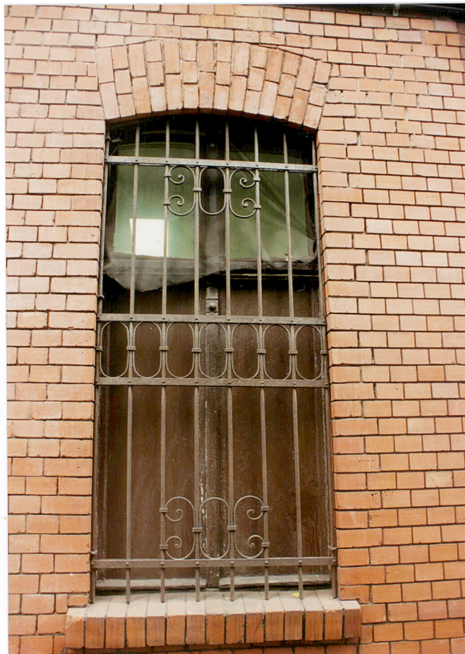
15. Okno parteru.