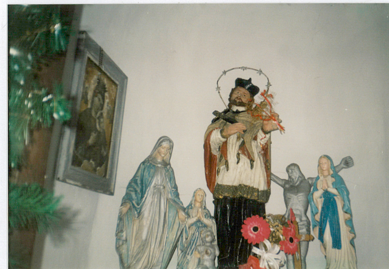
Rzeźba św. Jana Nepomucena