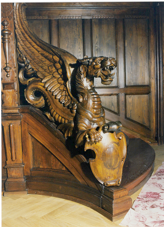
hall parteru, rzeźba przy schodach reprezentacyjnych