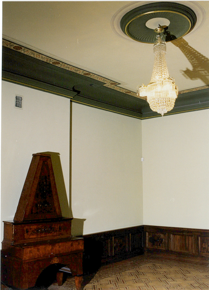
sala na I. piętrze -Salon Rodzinny