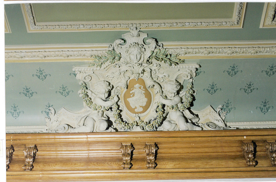
jadalnia, fragment stropu