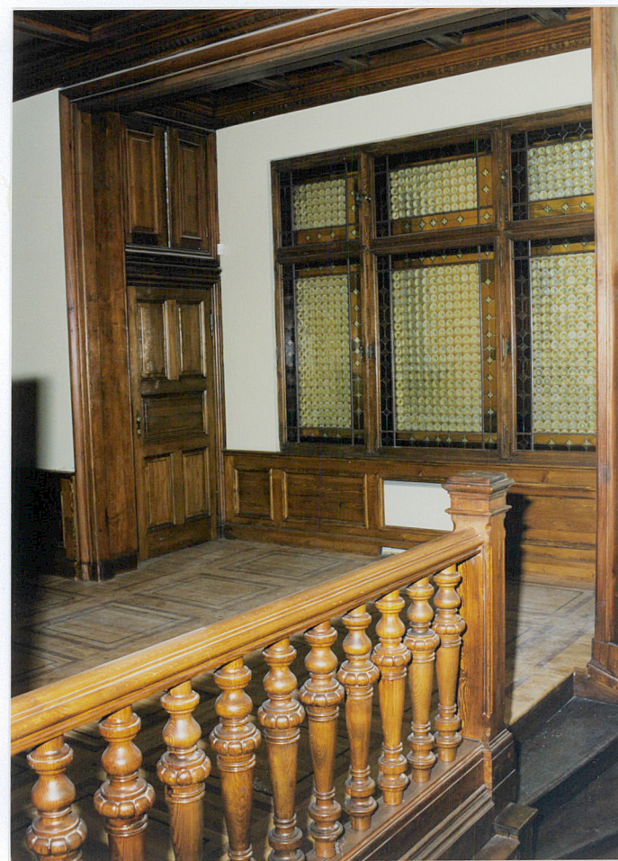
hall na I. piętrze