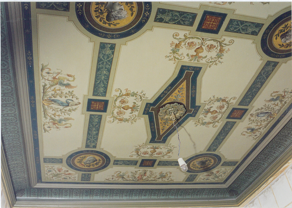
parter, strop w Muzeum Pana Domu