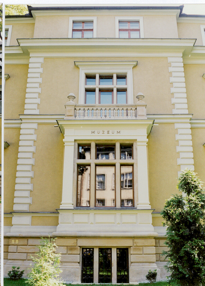
ryzalit elewacji południowej