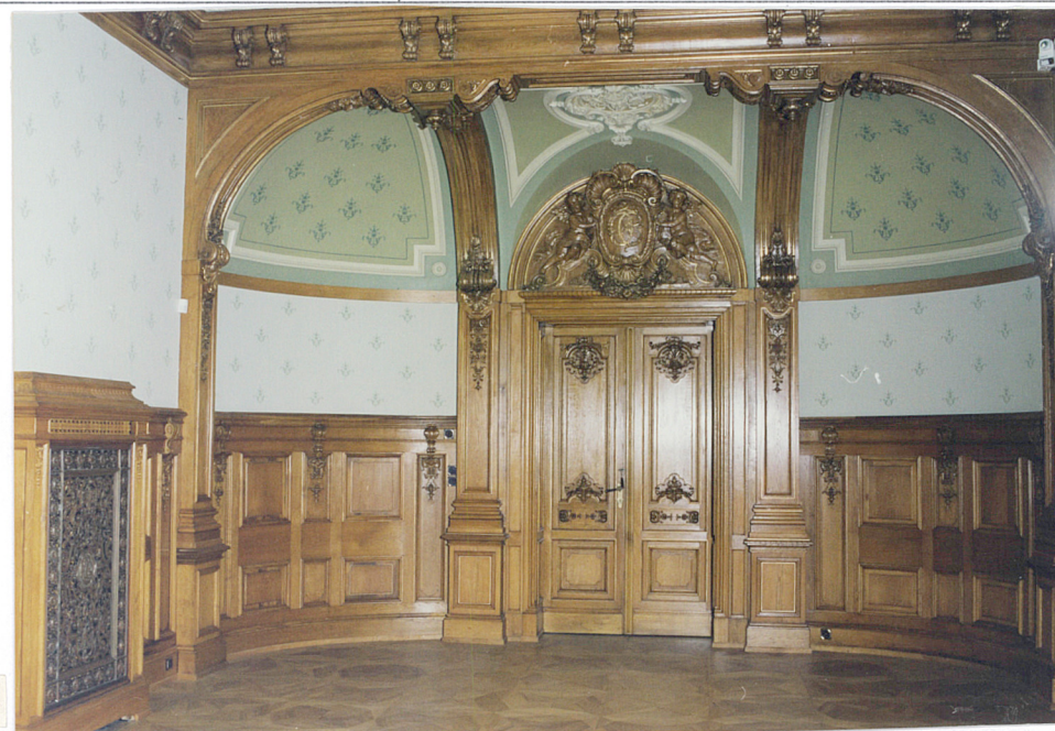
fragment jadalni na parterze