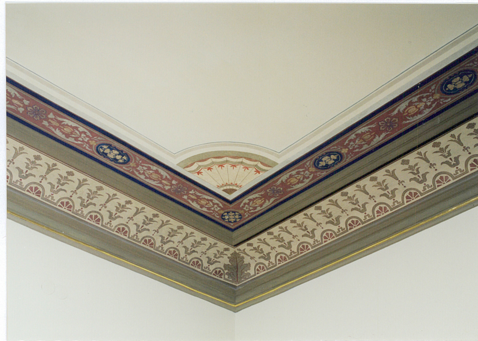
I. piętro, strop w buduarze