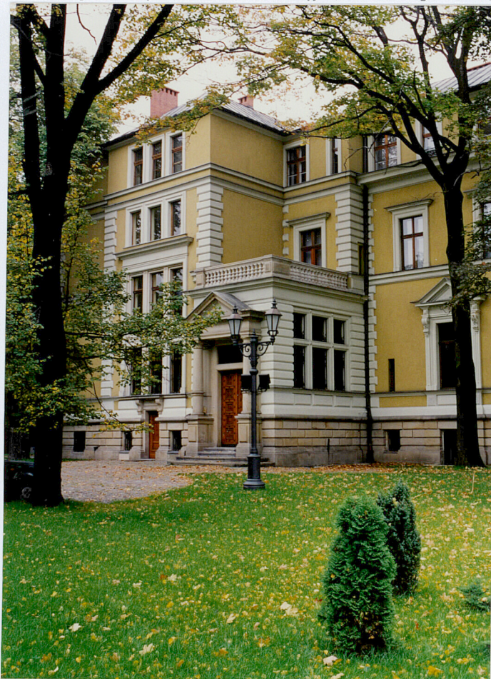
widok elewacji frontowej od pd-zach.

Instalacje - elektryczna, wodno-kanalizacyjna, centralne ogrzewanie, klimatyzacyjna, systemy przeciwpożarowy i antywłamaniowy.