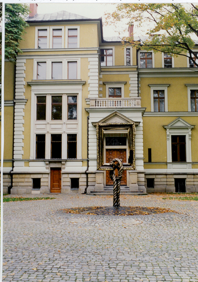
elewacja frontowa , zach.