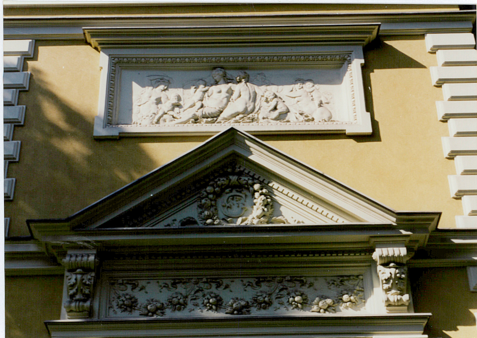
naczólek okna elewacji pn