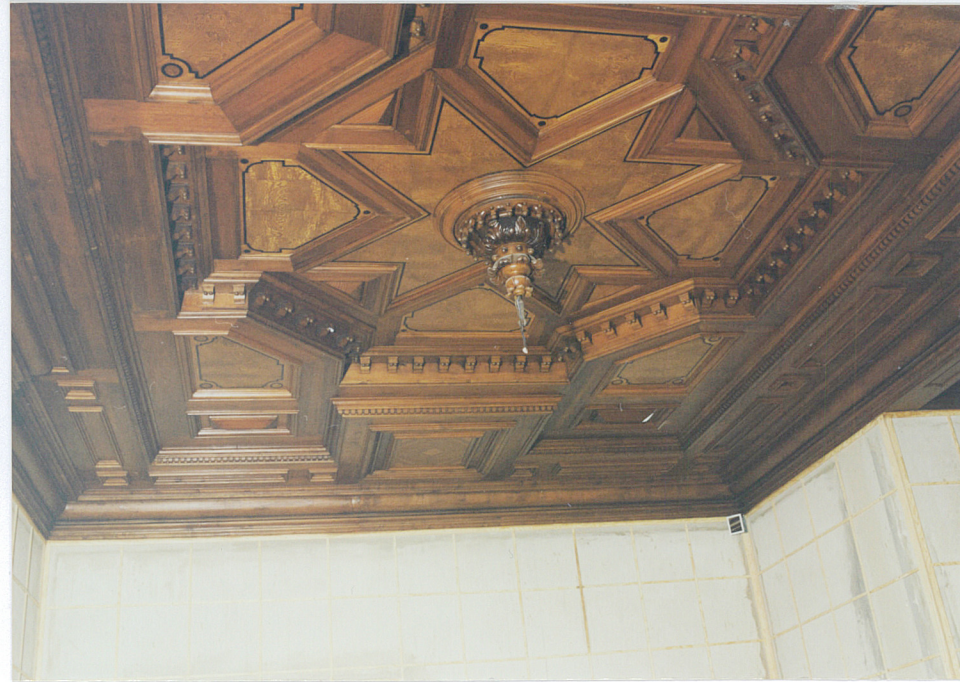
parter, strop w Pokoju Pana Domu