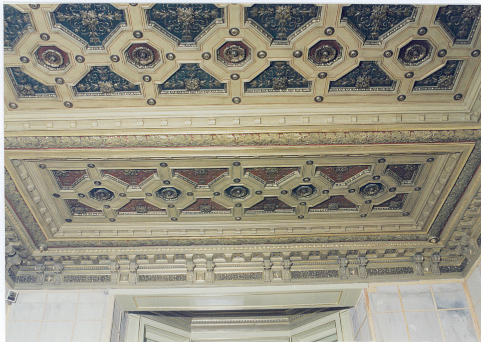
strop Dużego Salonu na parterze