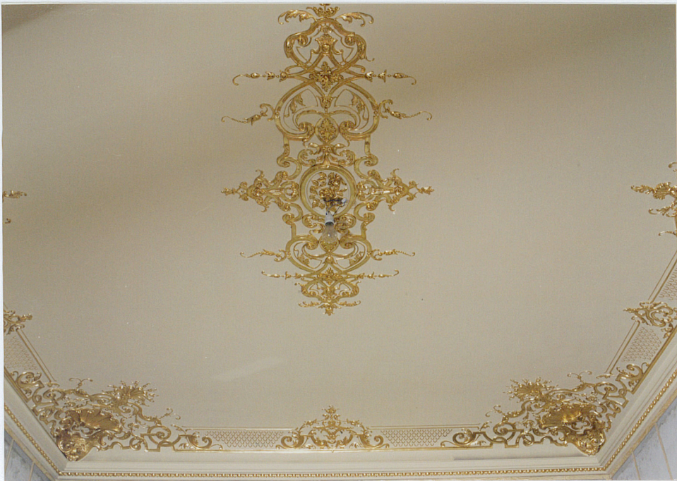
parter, strop saloniku narożnego