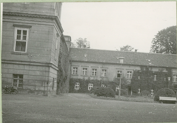
35. Uwagi różne

Bibliografia: Katalog Zabytków Sztuki w Polsce pow. Lubliniecki Grundmann G. Deutsche Kunst in befreiten Schlesien II Auflage Breslau 1943