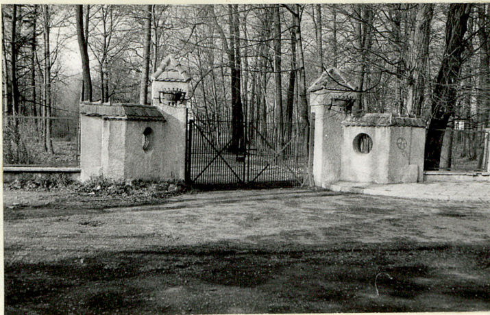
PARK • BRAMA OD UL. DĄBRÓWKI