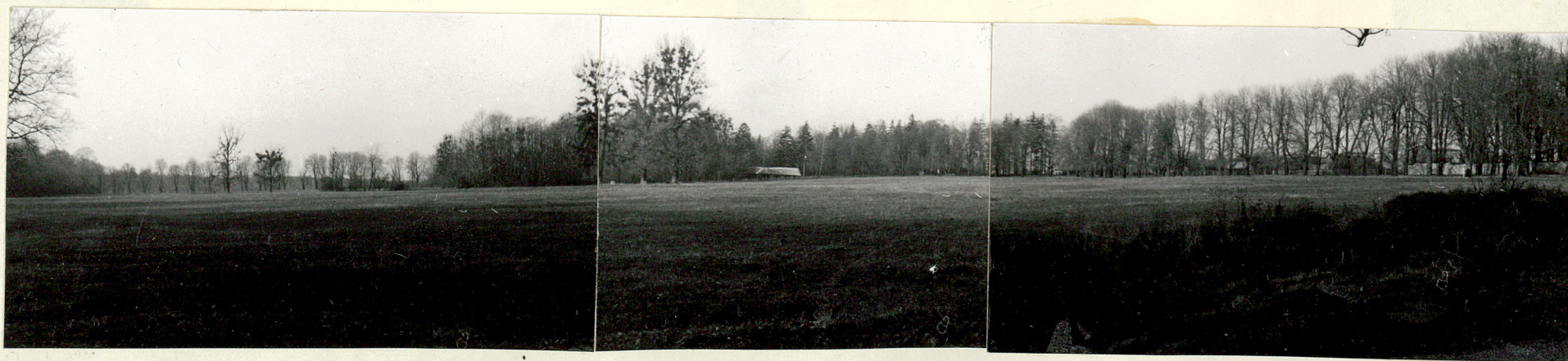
TEREN NA ZACHÓD OD PARKU OKOLONY ALEJĄ KASZTANOWĄ