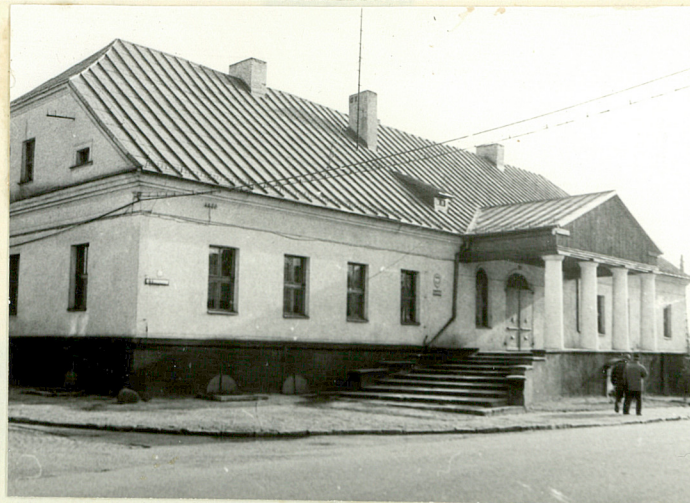
WIDOK ZACHODNI OD UL. SOBIESKIEGO