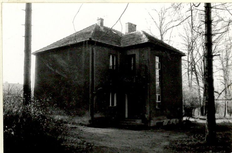
„WILLA” W PARKU (NR 2 NA SYTUACJI)