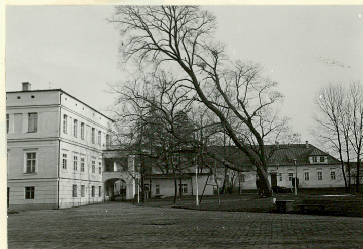
PAŁAC • BRAMA I PORTERMA