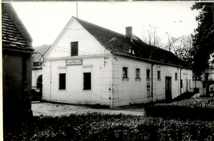
BUD. GOSPODARCZY- OBECNIE PGR (NR 8 NA SYTUACJI) - WIDOK OD UL. ZAMKOWEJ I OD TYŁU