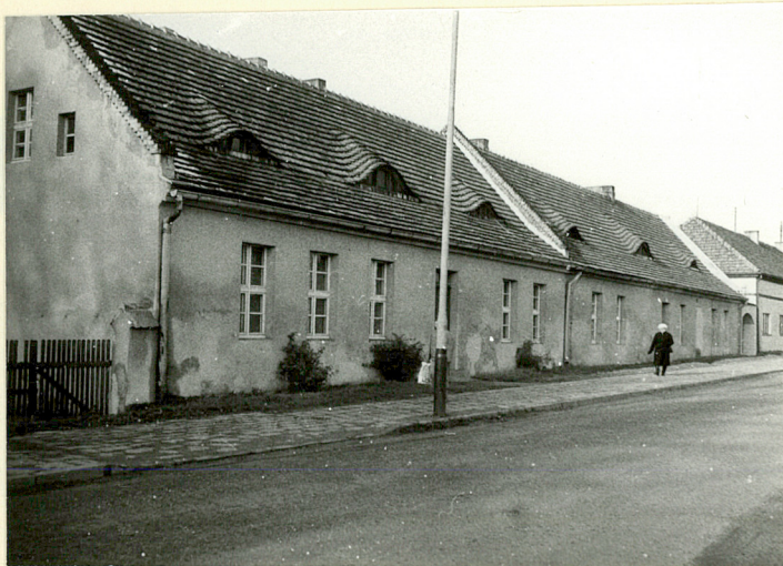
DAWNE CZWORAKI • WID. OD UL. SOBIESKIEGO (NR 10 NA SYTUACJI)