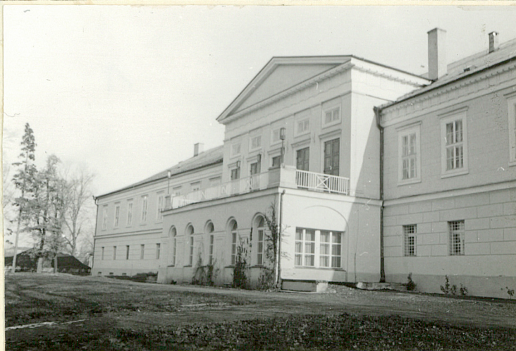
PAŁAC • ELEW. ZACHODNIA • RYZALIT CENTRALNY

zdjęcia - pałac, park i tereny za parkiem