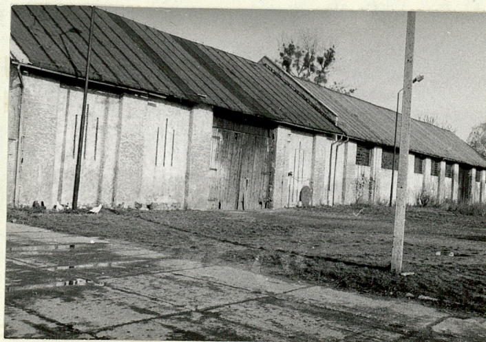
STODOŁA (NR 16 NA SYTUACJI) WID. POŁUDN.