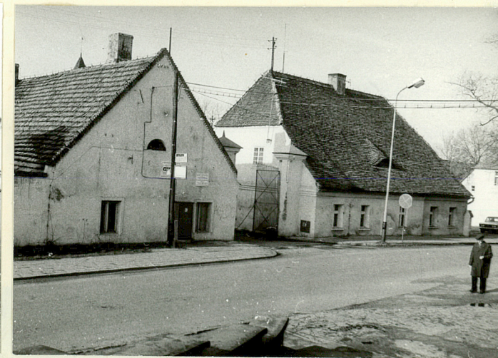
OFICyny II i, WJAZD W UL. ZAMKOWĄ (NR 9 i 6 NA SYTUACJI)