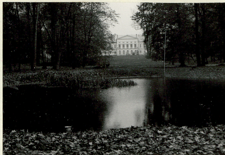
PARK • OŚ STAW - PAŁAC