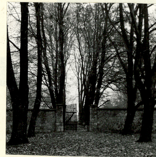
BRAMA B. CMENTARZA (NR 20)