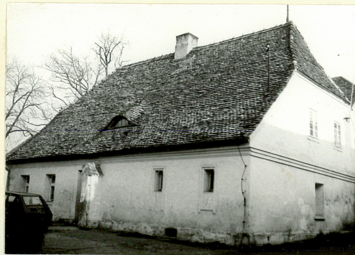
OFICyna I • WIDOK OD UL. ZAMKOWEJ (NR 6 NA SYTUACJI)