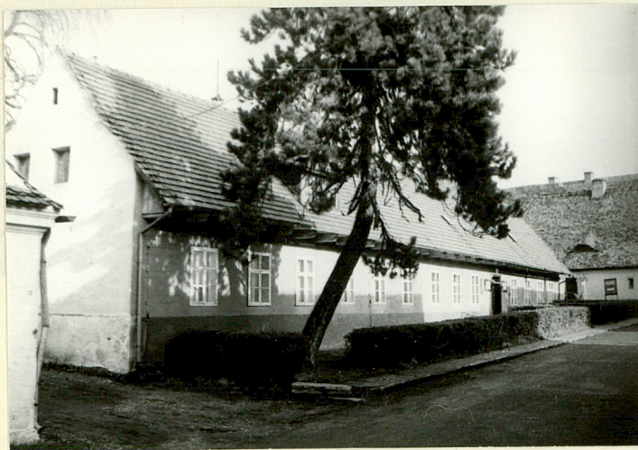
DOM MIESZKALNY II (NR 5 NA SYTUACJI) WIDOK POŁUDNIOWY OD UL. ZAMKOWEJ