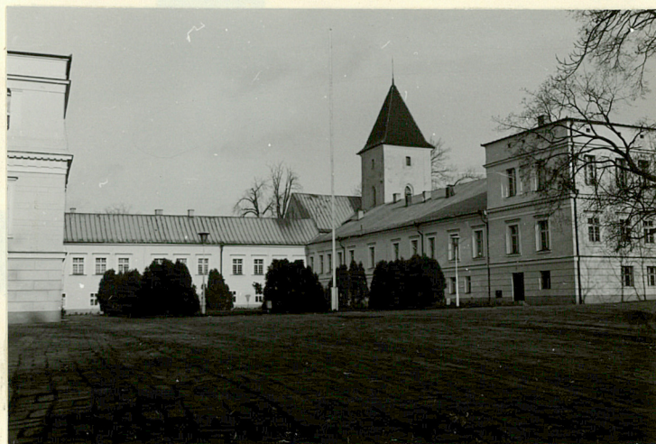
PAŁAC • DZIEDZINIEC