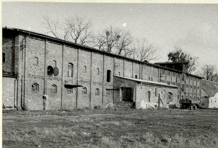
BUD. SKŁADOWO-PRZEMYSŁOWY (NR 13 NA SYT.) WIDOK POŁUDNIOWY