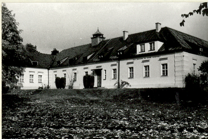
OBECNA SALA BALETOWA (NR 8 NA SYTUACJI) WID. ZACHODNI I POŁUDNIOWY