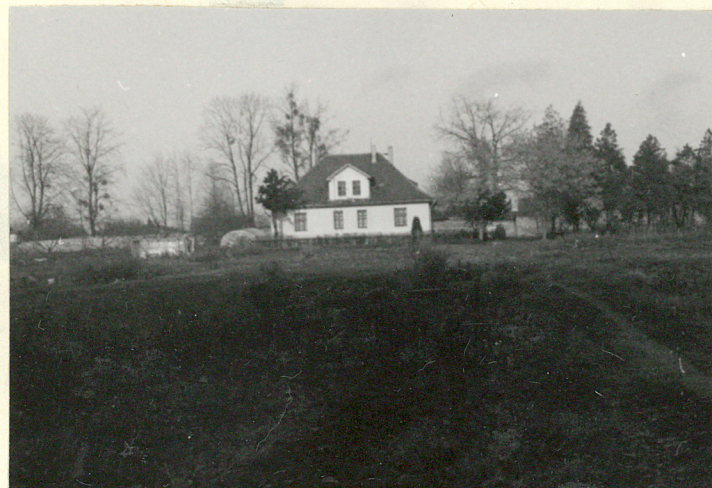
OGRODNICTWO DWORSKIE (NR 21 NA SYTUACJI)