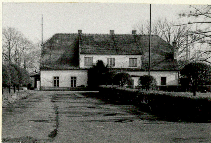
DOM MIESZKALNY V ( NR 15 NA SYTUACJI) WIDOK ZACHODNI