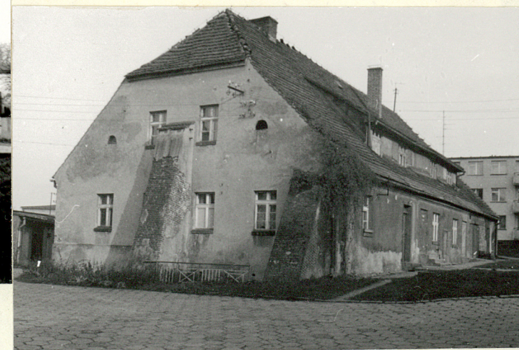
DOM MIESZKALNY I (NR 3 NA SYTUACJI)

Wkładkę założył: arch Wojciech Zaleski XI1992 (imię, nazwisko, data)