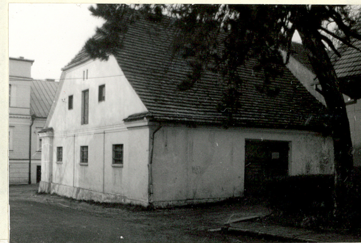
BUD. GOSP. PRZY UL. ZAMKOWEJ ( NR 4 NA SYT.)