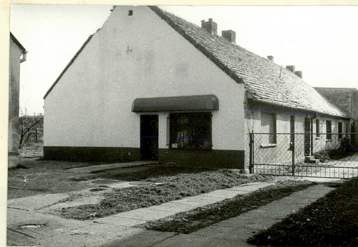
DOM MIESZKALNY IV (NR 12 NA SYTUACJI)

DOM ZARZĄDU DÓBR • OBECNIE NADLEŚNICTWO (NR 11 NA SYTUACJI)