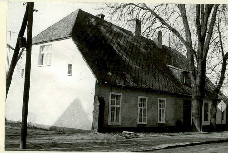
DOM MIESZKALNY III (NR 7 NA SYTUACJI)