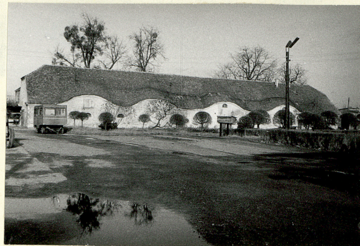
B. STAJNIE (NR. 14 NA SYTUACJI) WID. POŁUDN.