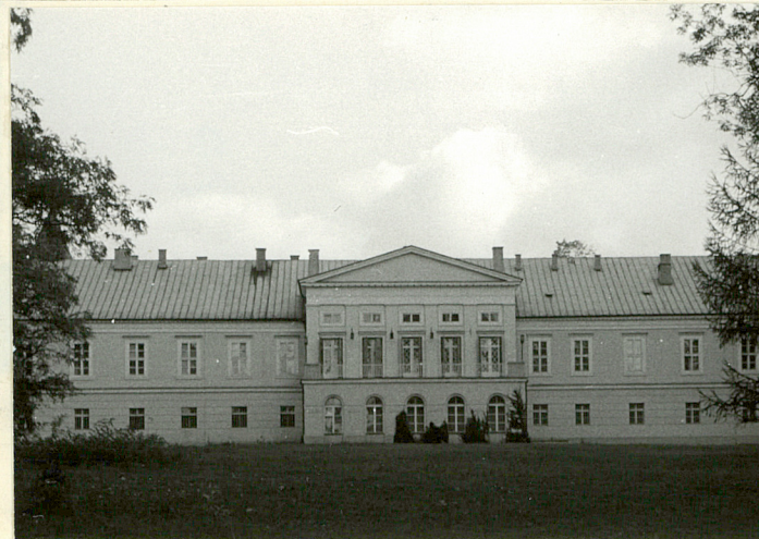
PAŁAC • ELEW. ZACHODNIA