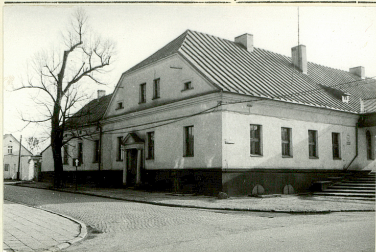
WIDOK PÓŁNOCNY OD UL. LIGONIA