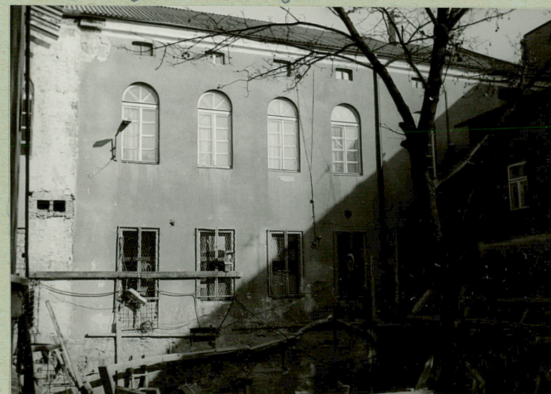
Budynek główny, widok od podwórka