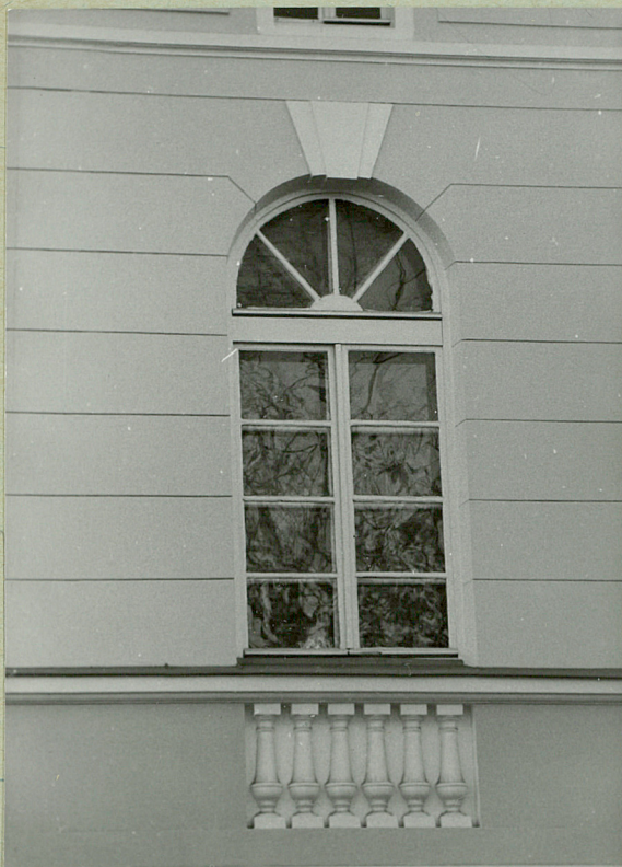
Okno elewacji frontowej