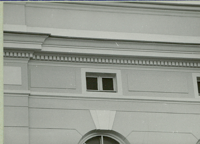
Gzyms wieńczący i okno strychu w elewacji frontowej