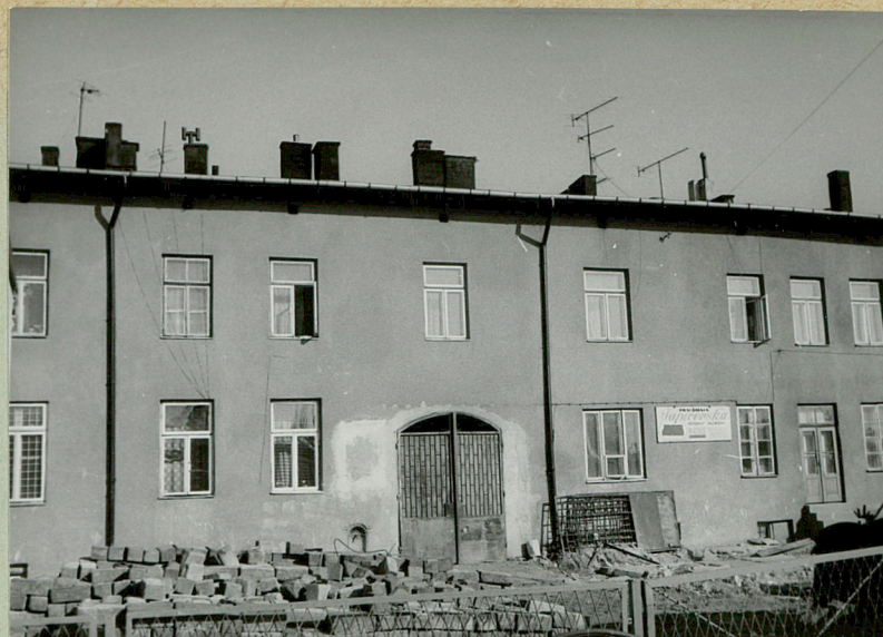
Oficyna tylna elewacja południowa