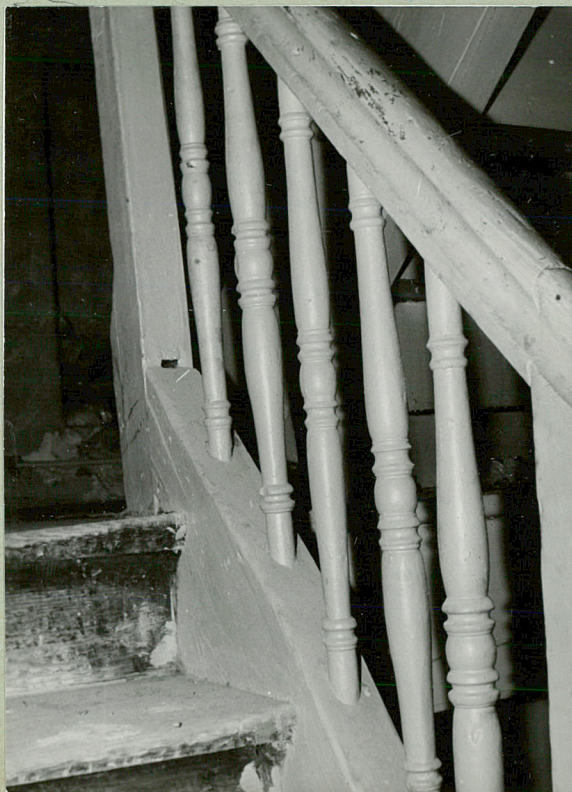
Fragment schodów i balustrady w klatce schodowej oficyny zachodniej