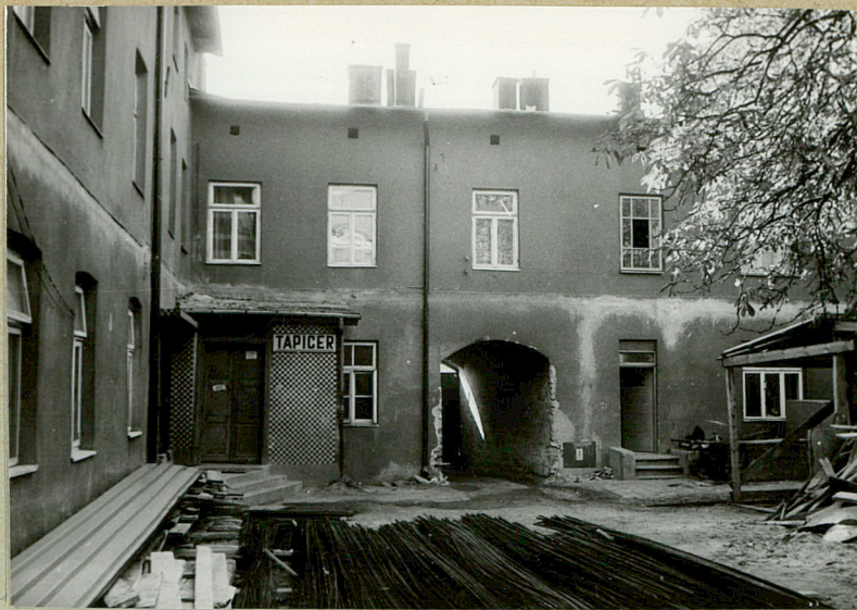
Oficyna tylna , widok od podwórka