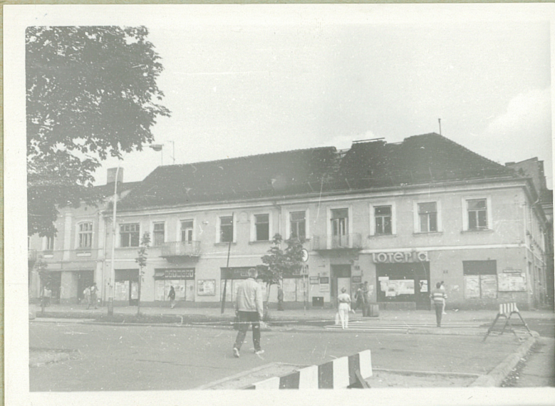
Elewacja południowa - frontowa