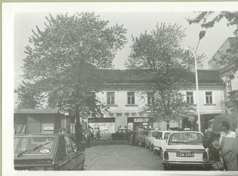
Elewacja wschodnia - frontowa