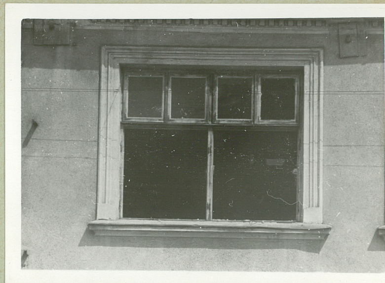
Okno I piętra