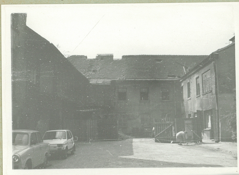
Widok ogólny od strony podwórka