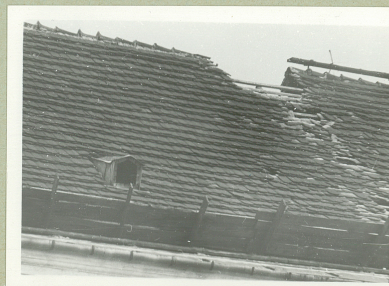
Pokrycie dachu - ubytki