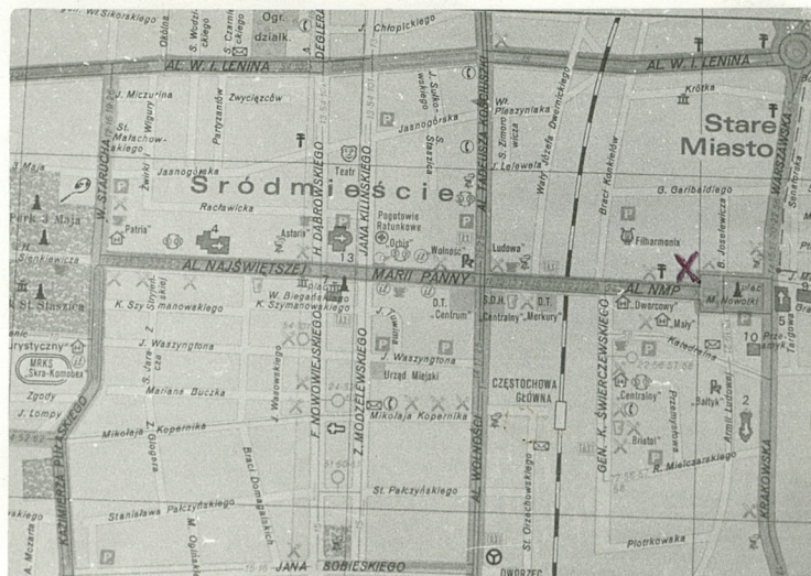
Plan orientacyjny wg planu miasta z 1981r