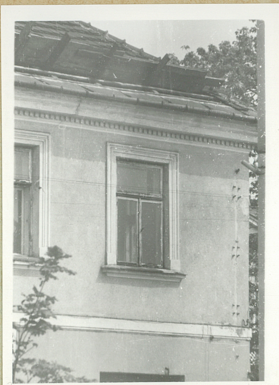
Okno I piętra