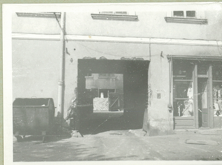
Sieni przejazdowa w elewacji wschodniej