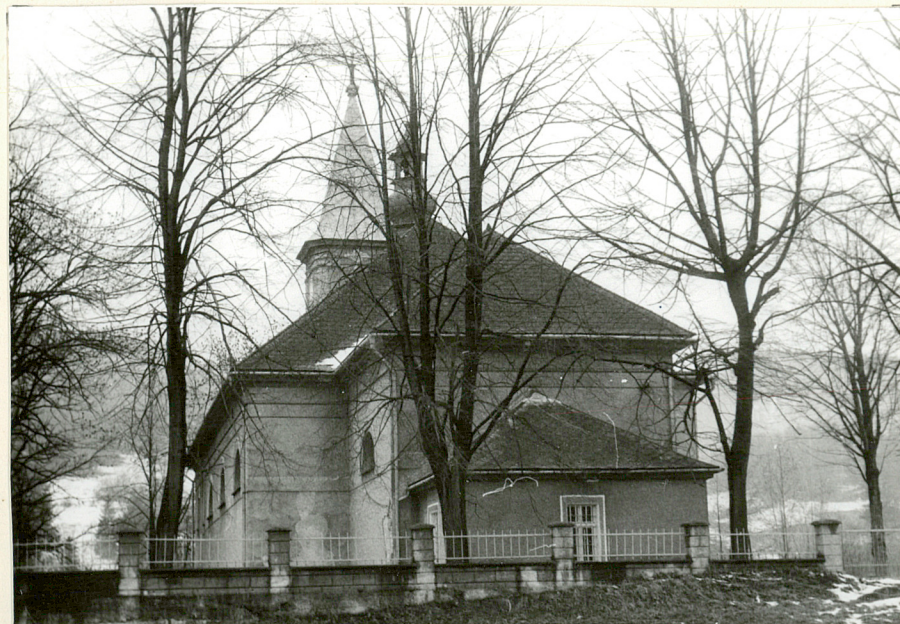
WIDOK KOŚCIOŁA OD STRONY WSCH.

Wkładkę założył: mgr Mariusz Godek 15.11. 1997 (imię, nazwisko, data)