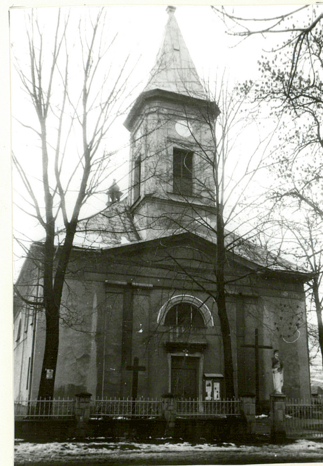
WIDOK NA FASADĘ

Wkładkę założył: mgr Mariusz Godek 15.11.1997. (imię, nazwisko, data)