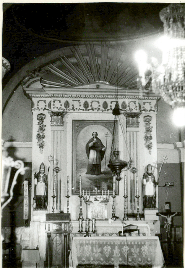
WIDOK NA OLTARZ GŁÓWNY

3. Zawartość wkładki (nazwa obiektu lub materiału uzupełniającego) zdjęcia