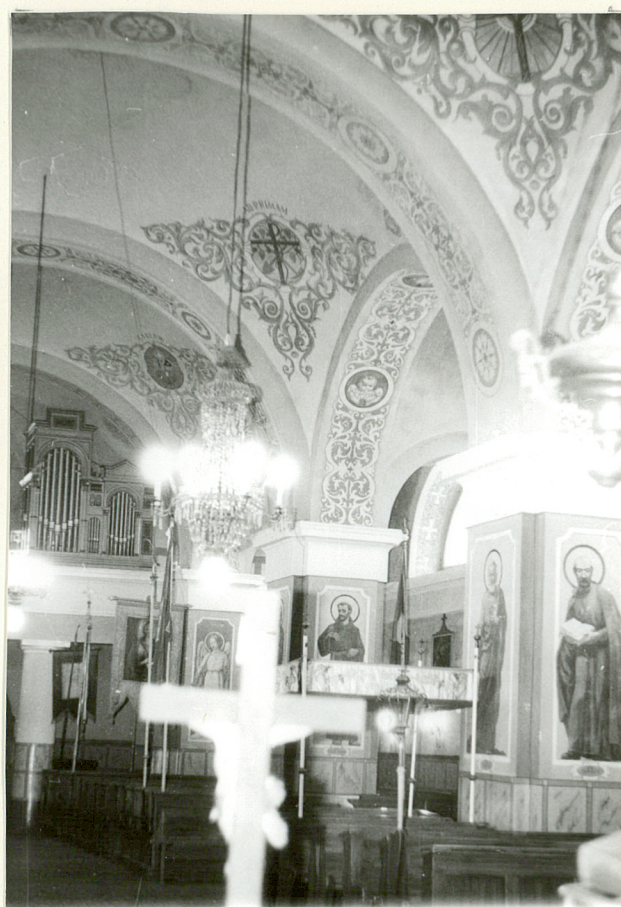
FRAGMENT WNETRZA NAWY