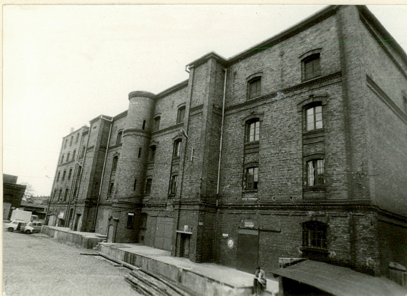
Widok od pd.