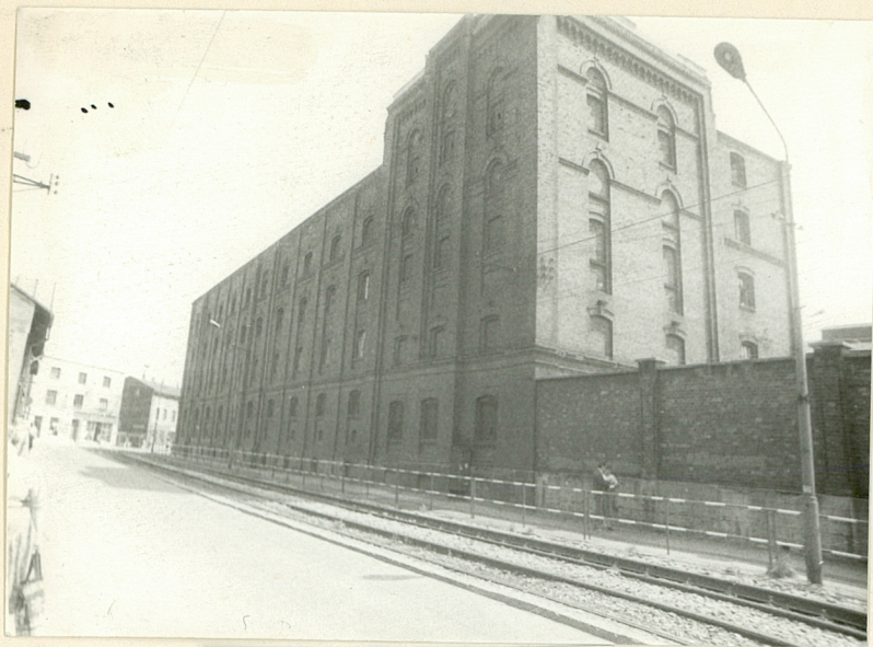
Widok od pn-zach