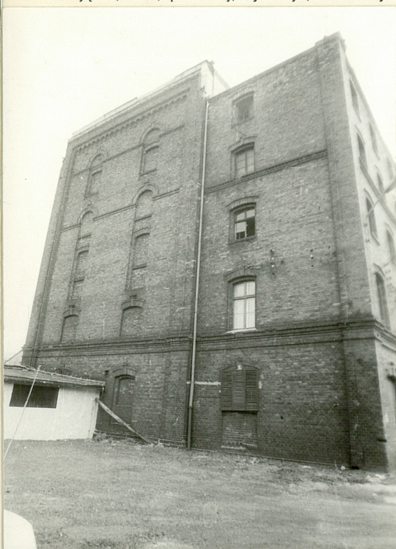
suszarnia przy słodowni nowej od zach.

11. Zdjęcia, rzut, przekrój, sytuacja, orientacja