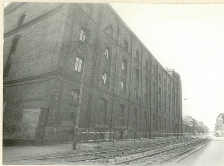
Widok od pn-wsch.